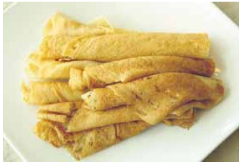
Pönnukökur eru listrænar í útliti einar og sér og ágætar upprúllaðar með sykri.

Kjúklingakjöt rífið niður. Pönnukakan smurð með Hoi Sin sósu. Kjúklingurinn settur ofan á og niðurskorinn vorlaukur yfir. Pönnukakan brotin saman í fernt, hituð á pönnu og gúrkustrímlar bornir fram með.