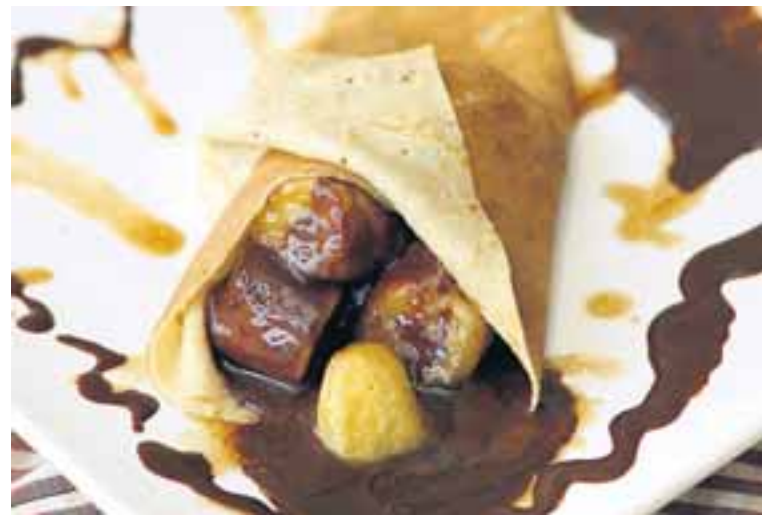
Ís, bananar og súkkulaðisósa sett á pönnukökuna og hún brotin saman.