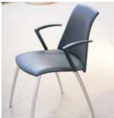
Hægt verður að finna flottar sýningarvörur á allt að 50 prósent afslætti í Epal fram á laugardag.

Helst ber þó að nefna að hægt er að fá sýningarvörur með 20 prósentu afslætti og allt upp í helmings afslátt. Þar má meðal annars finna vörur eftir frægustu húsgagnahönnuði heims, til dæmis Arne Jacobsen, Philippe Starck, Hans J. Wegner og Vico Magistetti. Eins og áður segir