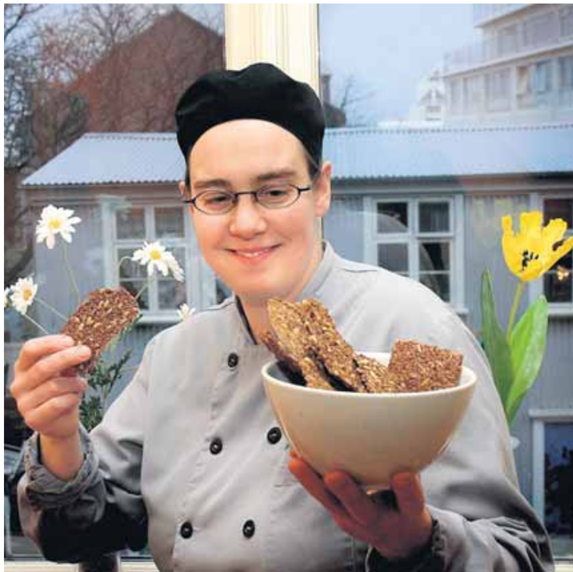
Dóra býður upp á hörfræxíð á veitingastaðnum Á næstu grösom.