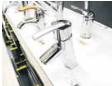
Blöndunartæki eru á þrjátíu prósentu afslætti.

Í Húsasmiðjunni og Byko má fá ýmsar vörur með allt að áttatíu prósentu afslætti.