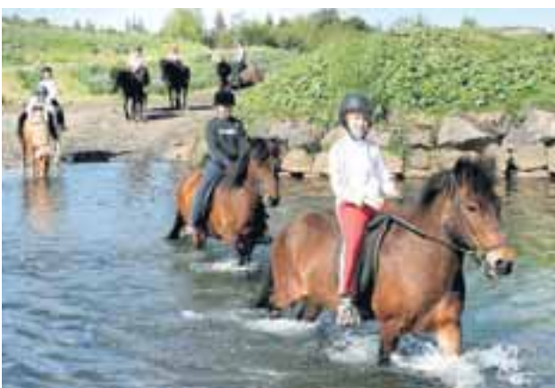
Íslenski hesturinn á sér aðdáendur á öllum aldri og úti um allan heim.

Allir nemendur þurfa að hafa lokið stúdentsprófi til þess að geta skráð sig í inntökupróf í læknadeild. Síðastliðin ár hafa 48 stúdentar verið teknir inn í deildina að hausti.