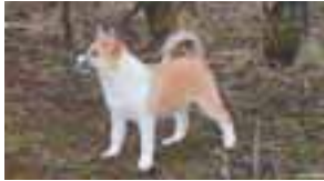
Íslenskur fjárhundur - tíkarhvolpar með yndislegt skap til sölu. Sími 894 0485.