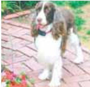
English Springer Spaniel hvolpar til sölu. Upplýsingar í s. 661 6892.