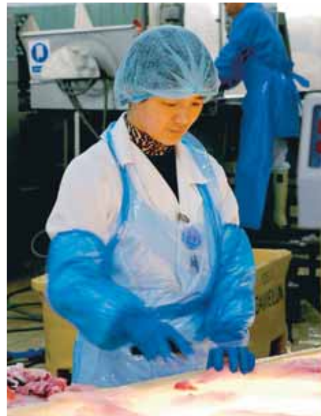
Búast má við mikilli vinnu í fiskvinnslunni hjá Granda í sumar. Hér er litið yfir salinn.

Vakin er athygli á stefnu Reykjavíkurborgar um jafnan hlut kynja í störfum hjá borginni. Atvinnuauklýsingar má einnig skoða á heimasíðu Reykjavíkurborgar: www.reykjavik.is/storf Hjá símaveri Reykjavíkurborgar, 4 11 11 11, færð þú allar upplýsingar um þjónustu og starfsemi borgarinnar og samband við þá starfsmenn sem þú þarft að ná í.