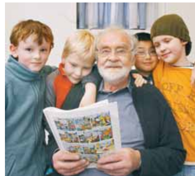
Kristján telur að unga fólkid og það gamla eigi ágæta samleið.

Starfsúmsókn er einnig hægt að fylla út á www.postur.is