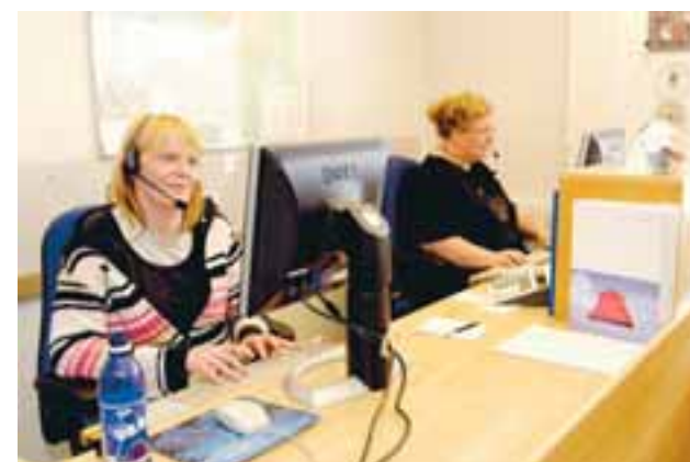
Upplýsingamiðlun innan stofnana þykir betri en áður.