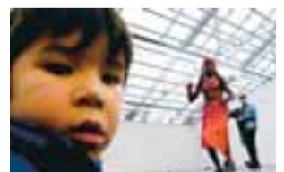
Í árslok 2005 voru 13.778 erlendir ríkisborgarar með lögheimili á Íslandi.

Í árslok 2005 voru 13.778 erlendir ríkisborgarar með lögheimili á Íslandi. Á sama tíma voru 15.045 Íslendingar með lögheimili á Norðurlöndum en auk þess býr