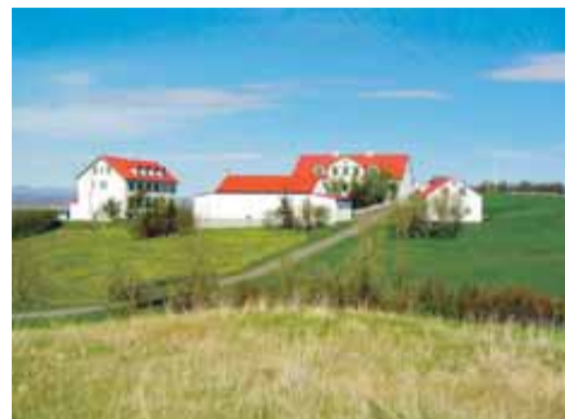
Byggðaping verður haldið á Hvanneyri 9. júní.