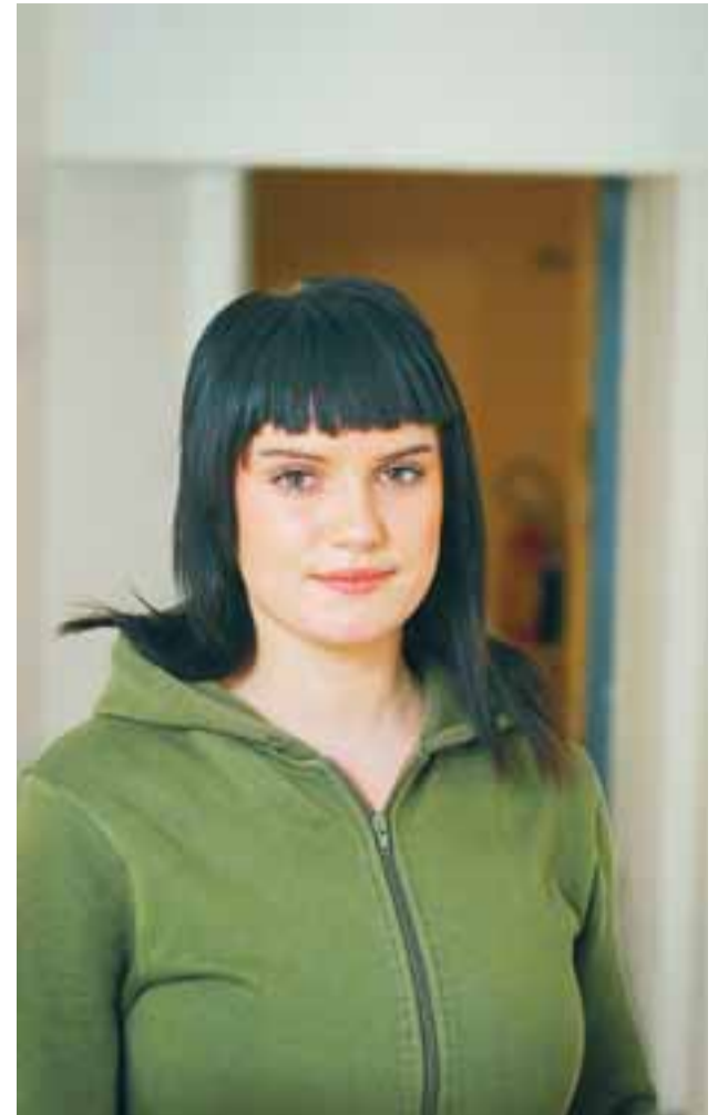
Gígja er mjög ánægð í vinnunni.

Bakkabraut 9 · 200 Kópavogur · Sími: 414-7777 · Fax: 414-7779 · borg@evborg.is · www.evborg.is