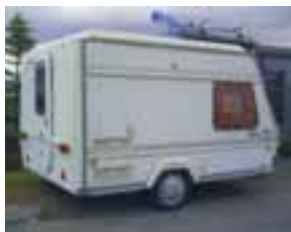
Til sölu Safari hjólhýsi árg.'95. Verð 750 þús. Uppl. í s. 699 4329.