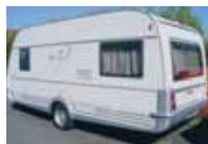
Nýtt Tabbert Vivaldi 450 TD Listav. 3.m Tilboð 2.700 þús. Uppl. 899 8819

LMC Dominant 560 RDB árg. 06. Aukahlutir fyrir yfir 650 þús. s.s. ALDE hitakerfi +gölfhluti sjónvarpslöfnet, 4 m. skyggni, sólarsetla, útvarp, CD. Tilboð 2.750 þús., áhv. 1600 þús. Uppl. s. 660 1304.