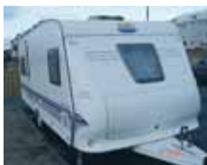
Til sölu Hobby Hjólhýsi m/ leðri og falgem innréttingum árg.2007 mjög lallegt hús uppl. s.6604568