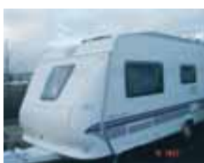
Hobby hjólhýsi 540 UL excelsior árg.07 2007 stórglæsilegt hús. fæst á mjög góðu verði. upp.s.6956387