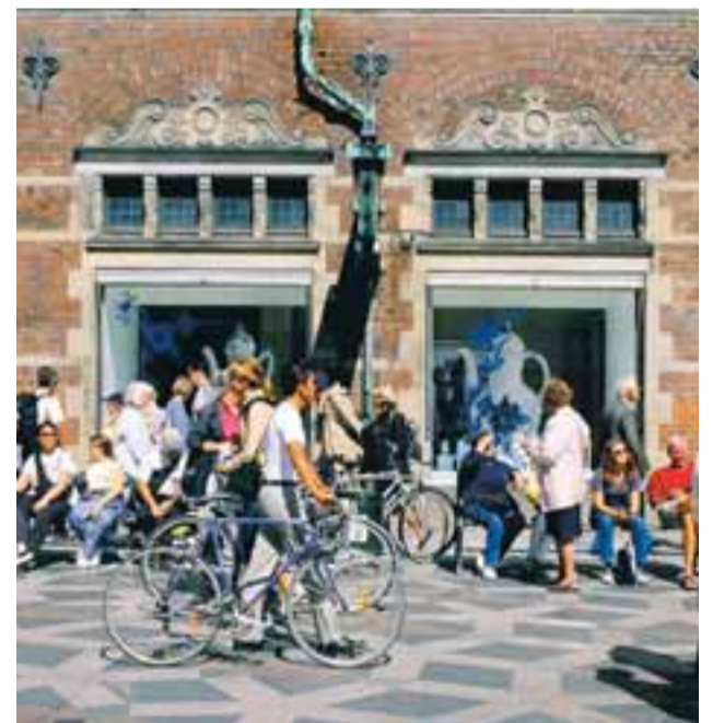
Kaupmannahöfn er mörgum Íslendingum kunnugleg.

Hægt er að sækja um og fá frekari upplýsingar á heimasíðu ÍTR, www.itr.is og hjá starfsmannaþjónustu ÍTR, Bæjarhálsi 1, í síma 411 5000