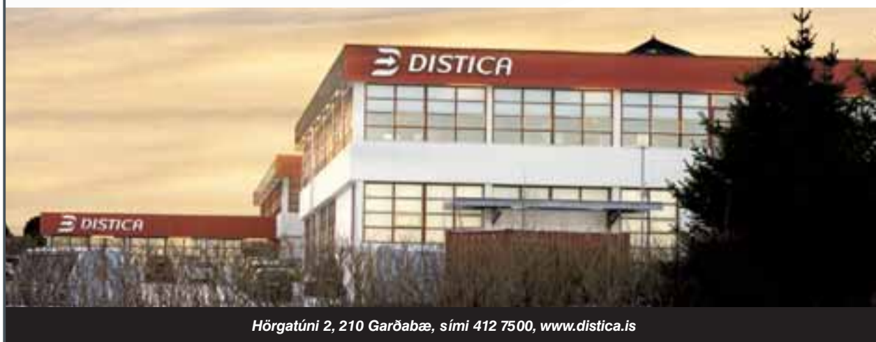
Hörgatúni 2, 210 Garðabæ, sími 412 7500, www.distica.is

Farið verður með allar umsóknir sem trúnaðarmál og öllum umsóknnum svarað.