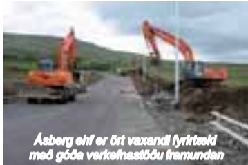
Ásberg ehf er ört vaxandi fyrirtæki með góða verkefnastöðu framundan