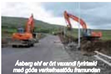
Ásberg ehf er ört vaxandi fyrirtæki með góða verkefnastöðu framundan