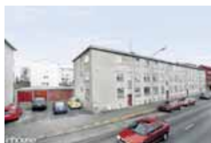
Hringbraut 109, 107 Reykjavík