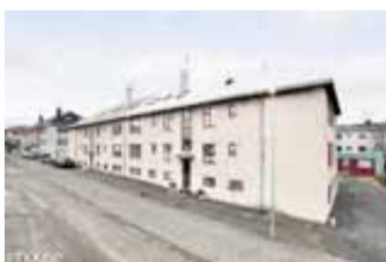
Miklabraut 60, 105 Reykjavík