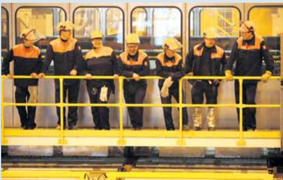
Heimsmet slegið í samfelldri, láréttri T-barrasteypu: Fjórir barrar á færibandinu þokast nær.

Starfsmenn Alcoa Fjarðaáls eru nú orðnir ríflega 400 og gangsetning álversins við Reyðarfjörð er vel hálfnuð. Við eigum enn eftir að ráða nokkra starfsmenn á vaktir í skautsmiðju, kerskála og steypuskála.