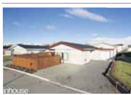
Smárarími 27, 112 Reykjavík