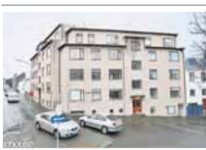
Vesturvallagata 1, 101 Reykjavík