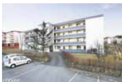
Lundarbrekka 10, 200 Kópavogur