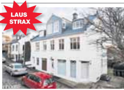
Gunnarssund 8, 220 Hafnarfjörður