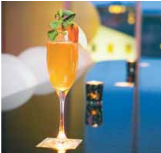
Fallegur áfengislaus fordrykkur sem hægt er að dreypa á með góðri samvisku.