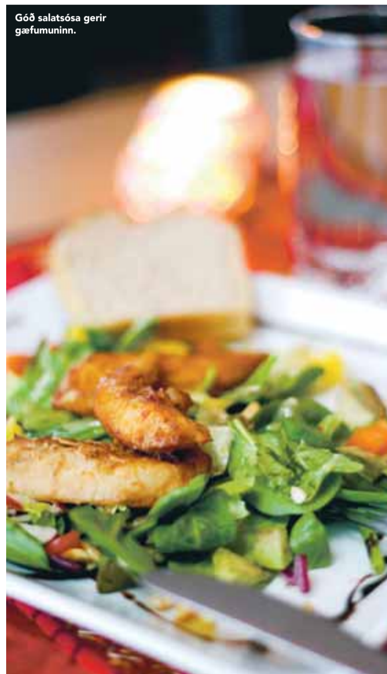
Góð salatsósa gerir gæfumuninn.