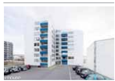
Engihjalli 19, 200 Kópavogur