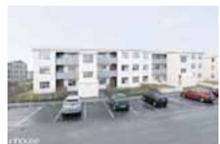
Frostafold 37, 112 Reykjavík