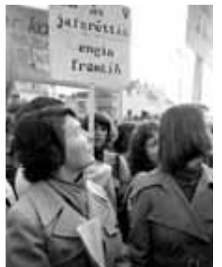
Íslenskar konur hafa í áratugi barist ótulllega fyrir jafnrétti kynjanna.

Hlutfall kvenna meðal æðstu yfirmanna er níttján prósent. Konum hefur því fjölgað milli ára í stjórnum og æðstu stjórnendastöðum. Í þrettán af hundrað og tuttugu stærstu fyrirtækjum