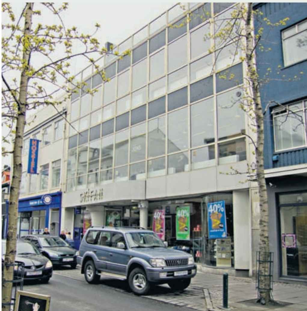
Rúmgóð verslunarhæð á besta stað við Laugavegin.