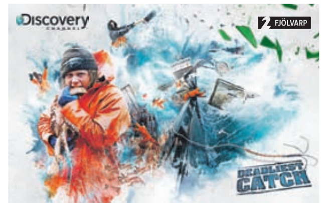
DISCOVERY CHANNEL ER Á STÖÐ 2 FJÖLVARP | FÁÐU ÞÉR ÁSKRIFT Á STÖÐ 2. IS