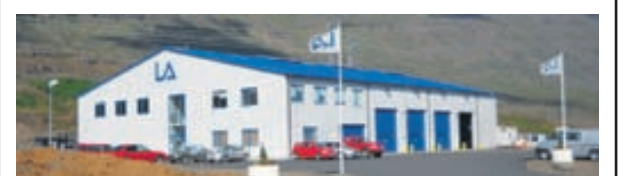
Launafli ehf er iðnfyrirtæki í Fjarðabyggð.

Toyota Kaupúni Kaupúni 6 Sími: 570 5070 www.toyotakaupuni.is