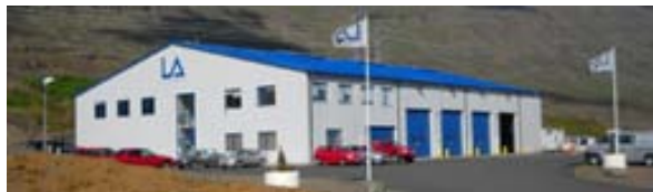
Launafli ehf er iðnfyrirtæki í Fjarðabyggð.