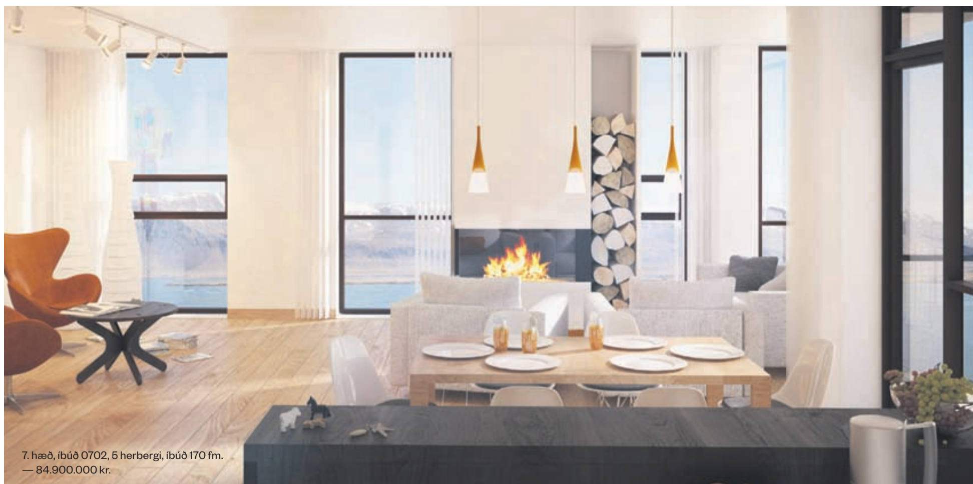
7. hæð, íbúð 0702, 5 herbergi, íbúð 170 fm. — 84.900.000 kr.