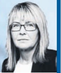
Íris Hall Löggiltur Fasteignasali Sími: 512 4900