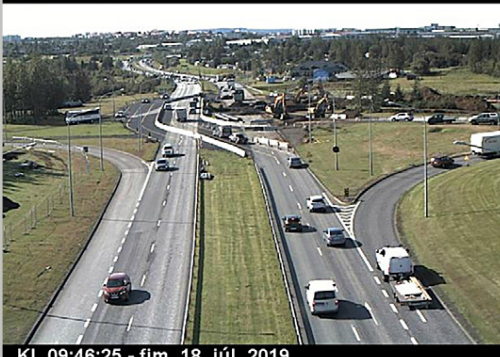
Kl. 09:46:25 - fim. 18. júl. 2019

Vegagerðin er eftirsóknarverður vinnustaður sem hentar jafnt báðum kynjum.