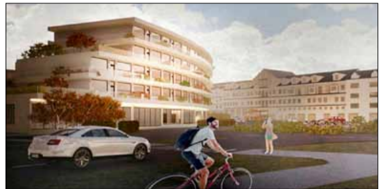
Teikning af byggingum á Steindórsreitnum sem gerð var fyrir nokkru.

væri að móta ramma um byggð sem styrkja myndi heildarmynd borgarinnar. Þess er skemmt að geta að ýmsar athugasemdir komu fram við þessar skipulagshugmyndir. Einkum komu þær frá íbúum við vestur enda Ásvallagötunnar sem fannst að sér þrengt en einnig annarsstaðar frá. Athugasemdir komu fram um að hluti húsnæðisins væri ætlaður fyrir hótélrekstur.