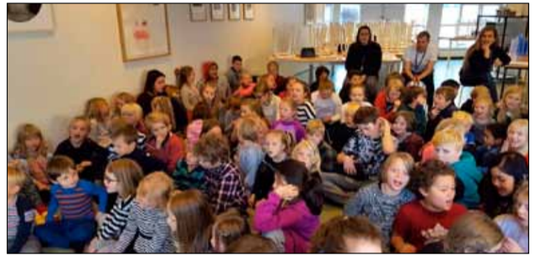
Frá degi íslenskrar tungu í Landakotsskóla.

Æ algengara er að mörg tungumál séu töluð í grunnskólum hér á landi. Flestir nemendur þar sem þannig háttar til eru annað hvort tví- eða þrjú tungumál. Þeir eiga sitt móturmál. Síðan læra þeir íslensku og jafnan einnig ensku sem er það tungumál sem flestir sem koma frá ólíkum málsvæðum nota hvort sem það er í samskiptum á netmiðlum eða daglegu tali.