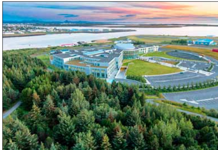
Ein stoppistöð borgarlínunar verður við Háskólann í Reykjavík.

Gert er ráð fyrir að þriðji áfangi borgarlínu, áfanginn frá Mjódd að BSI muni koma til framkvæmda árið 2024 og ljúki 2026. Gert er ráð fyrir að ný Umferðamiðstöð taki að hluta við því hlutverki sem Hlemmtorg hefur gegnt þótt áfram verði skiptistöð á Hlemmi. Gert er ráð fyrir að ný umferðamiðstöð muni þjóna auk þess að vera stoppistöð fyrir Borgarlínuna að vera