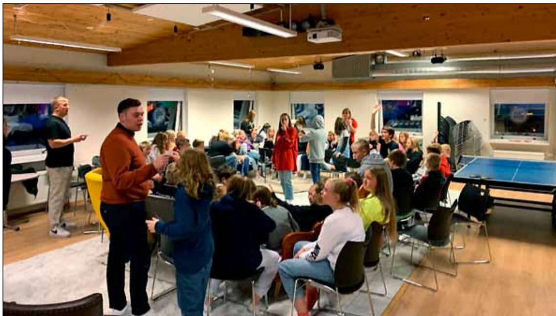
Frá starfsemi Frosta á síðasta hausti.

Nóg er um að vera í Frosta á nýju ári og er dagskráin fyrir janúar stútfull af skemmtilegum viðburðum og uppákomum. Þar ber hæst að nefna söngkeppni Tjarnarinnar sem verður haldin 24. janúar en það er undankeppni fyrir Söngkeppni Samfés. Þar munu nemendur í Hagaskóla etja kappi við unglunga úr Miðbæ, Austurbæ og Hlíðum.