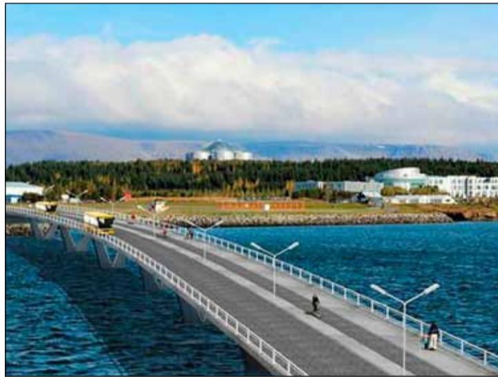
Tölvuteikning sem sýnir hvernig Fossvogsbúnaðsbrúin gæti litið út.

Matsnefnd mun fara yfir umsóknirnar og velja fimm aðila til að taka þátt í hönnunarsamkeppninni. Gert er ráð fyrir að niðurstaða liggja fyrir þessa dagana og að hönnunarsamkeppnin hefjist í framhaldinu. Að lokinni samkeppni er gert ráð fyrir að samið verði við sigurvegarann um fullnaðarhönnun nýrrar brúar yfir Fossvog.