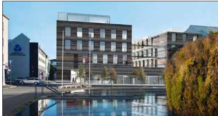
Tölvugerð mynd af fyrirhugaðri nýbyggingu Alþingis.

Um er að ræða um sex þúsund fermetra byggingu sem gert er ráð fyrir að muni rísa á fjórum árum kosta um 4,4 milljarða auk verðbóta á tímabilinu. Byggingin verður tengd nær öllum öðrum byggingum Alþingis þannig að innan gengt verður til Skála og þinghússins sjálfs auk húsalengjunnar við Kirkjustræti. Í húsinu verða skapaðar nútímalegar og fyrsta flokks vinnuáðstöður fyrir þingmenn og ekki síður starfsfólk Alþingis. Þá verða góðar aðstæður til að taka á móti gestum sem koma til Alþingis og þingnefnda.