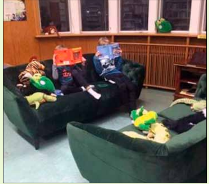
Kósihornið í Melaskóla.

Búið er að laga kósihornið í Melaskóla. Komnir eru sófar, pop-up sparibækur og fræðibækur um náttúru Íslands og von er á grjónapúða fljótlega.