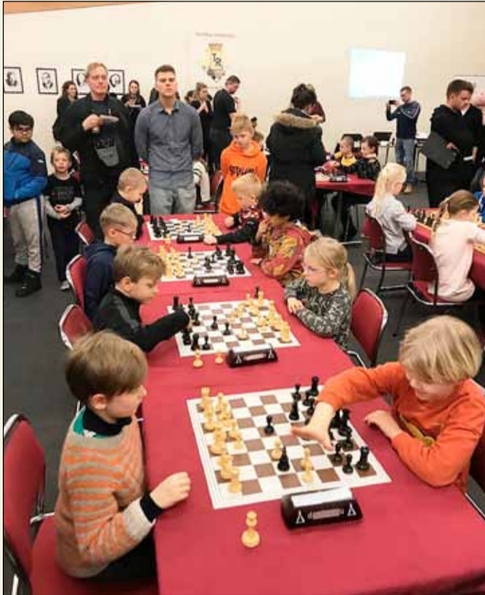
Nemendur Landakotsskóla að tafli á Reykjavíkurmótinu.

A-sveit 4.-7. bekkjar Landakotsskóla í landaði silfrinu á Reykjavíkurmóti grunnskóla sem fram fór í Taffélagi Reykjavíkur 3. til 4. febrúar sl.