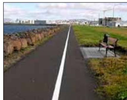
Mánaleið liggur meðfram Sæbraut.

Stígarnir sem hlutu nöfn eru sex talsins. Þeir nefnast, Mánaleið, Sólarleið, Árleið, Kelduleið, Eyjaleið og Bæjarleið. Mánaleið nefnist stígurinn meðfram Sæbraut. Sólarleið liggur meðfram Ægisíðu í gegnum Fossvog, inn í Elliðaárdal. Árleið liggur í gegnum Elliðaárdal. Kelduleið liggur meðfram Sæbraut, í gegnum Geirsnef og svo Vesturlandsveg inn í Mosfellsbæ. Eyjaleið liggur frá Bryggjuhverfi, í gegnum Grafarvoginn inn í Mosfellsbæ meðfram sjónum og Bæjarleið liggur frá Nauthólsvík, meðfram Öskjuhlíð og niður í miðbæ Reykjavíkur.