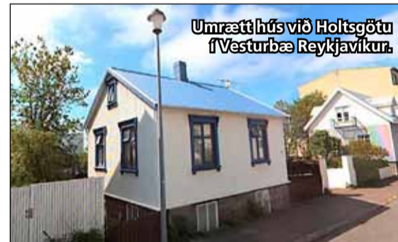
Umrætt húsið við Holtsgötu í Vesturbæ Reykjavíkur.

Deilan um húsið við Holtsgötu hófst fyrir fimmtán árum þegar borgin samþykkti deiliskipulag á svokölluðum Holtsgöturéit. Deiliskipulagið kvað á um að byggja mætti fjölbýlishús á lóðinni við hliðina á umræddu húsi auk þess sem mætti rífa það og byggja annað og stærra. Húsið var auglýst til sölu fyrir fimm árum með þeim formerkjum sem deiliskipulagið kveður á um. Í millitíðinni höfðu lög tekið gildi sem aldursfriðuðu öll hús 100 ára og eldri. Húsið við Holtsgötu var reist árið 1904. Minjastofnun greip þá inn í sölu hússins og sagðist hvorki ætla að