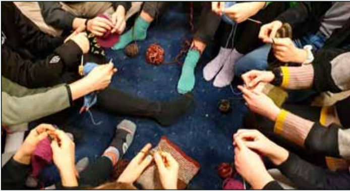
Þrjónað fyrir pokadýr í Grandaskóla.

Nemendur og kennarar í Grandaskóla tóku þátt í verkefninu „Þrjónað fyrir pokadýrin í Ástralíu“ sem er sjálfbærliðaverkefni á alþjóðavísu.