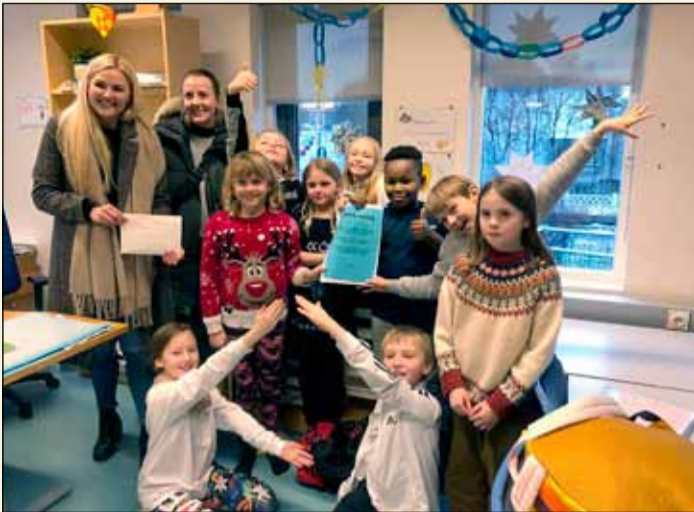
Afmælisbörnin ásamt fulltrúum Unicef.

Afmælisbörn októbermánaðar í fjórða bekk Vesturbæjarskóla tóku þá ákvörðun að gefa afmælispening sinn til starfsemi Unicef. Afmælisbörnin fengu síðan fulltrúa frá Unicef í heimsókn á dögnum.