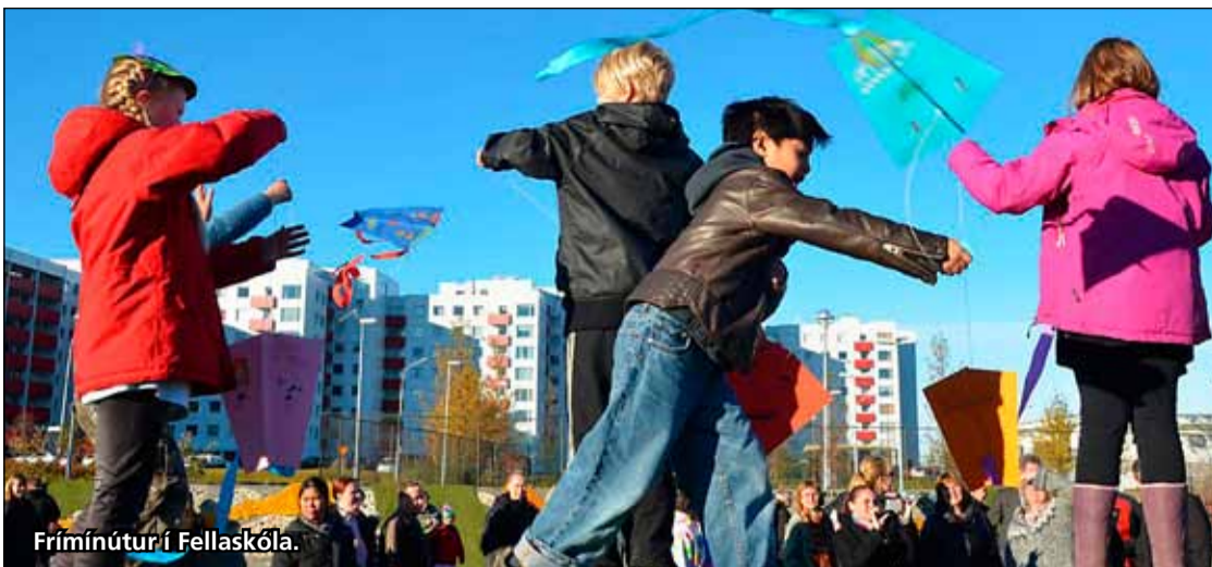
Frímínútur í Fellaskóla.

Með upplýsingatækninni gefast tækifæri til að samþætta íslenskukennslu við aðrar námsgreinar og auka flæði á milli greina og skólastiga. Nemendur hafa meðal annars unnið með Google og möguleika þess. Í náminu er farið í nokkur verkefni sem endurspeglar það sem fólk verður að nota í vinnu í framtíðinni.