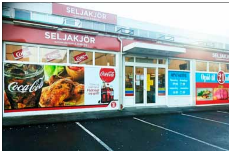
Seljakjör við Seljabraut sem hér eftir mun bera heitið Iceland.