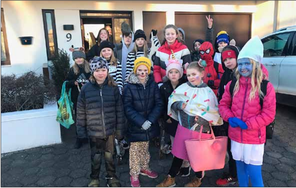
Ýmsa búninga má sjá á öskudaginn.

Foreldrum í Breiðholti býðst styrkur til þess að kaupa sælgæti í tilefni öskudagsins. Foreldrafélögin eru er að skipuleggja rölt um hverjð seinnipart öskudags, 26. febrúar nk. milli kl. 17 og 19. Öllum börnum í hverfinu gefst kostur á að ganga í merkt hús, eða hús sem skráð eru í skjalinu, og syngja fyrir nágretta sína í von um sælgæti eða annars konar góðgæti t.d. kleinur, kex, límmiða eða pönnuköku að launum. Þetta hefur reynst mjög skemmtilegt og seinustu ár hafa nágrettar sem búa í sama stigagangi tekið sig saman og tekið á móti syngjandi krökkum í anddyri blokkanna.