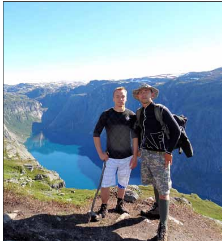
Í fjallgöngu í Noregi