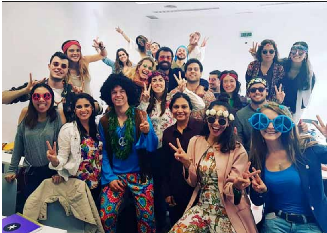
Skólafélagar í framhaldsnáminu í Madrid.