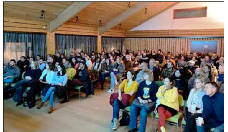
Margt var um manninn á kynningarfundinum í Gerðubergi.

Námskeiðið sem mun standa í nokkrar vikur og er markmiðið að útskrifa innflytjendur með sinn eigin matarvagn þegar sólin hækkar á lofti. Gríðarlegur áhugi var á kynningarfundi um verkefnið fyrir áramót þegar 150 innflytjendur mættu í Gerðuberg til að kynna sér málið. Verkefnið er unnið í samstarfi við Reykjavík Street Food sem hefur staðið fyrir mörgum matartengdum