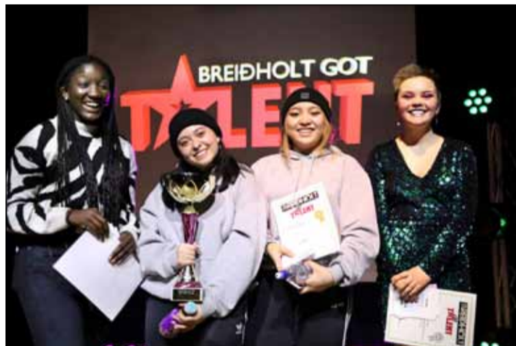
Efstu þrjú sætin í BGT.

Hin árlega hæfileikakeppni Frístundamiðstöðvarinnar Miðbergs, Breiðholt got talent, fór fram í Breiðholtsskóla föstudaginn 7. febrúar síðastliðinn. Keppnin, sem nú var haldin í ellefta sinn, hefur fyrir löngu fest sig í sessi sem einn helsti viðburður ársins meðal barna og unglinga af frístundaheimilum og félagsmiðstöðvum í Breiðholti. Mikið er lagt upp úr að umgjörðin sé eins og best verður á kosið, með fullkomnu hljóð- og ljósakerfi.