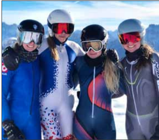
Ungar enn en aðeins eldri komnar á ferð og flug um Alpana.

Nú í janúar og febrúar stendur yfir bikarmótaröð Skíðasambands Íslands. Við tókum þátt í þeim mótum, svo höldum aftur út á vit ævintýrana en komum aftur heim í byrjun apríl og tókum þátt í Landsmóti Skíðasambands Íslands, fyrir hönd Skíðadeildar ÍR.