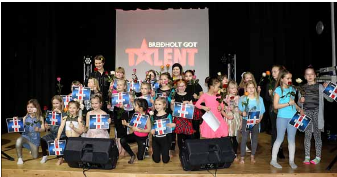
Allir keppendur í barnakeppninni.