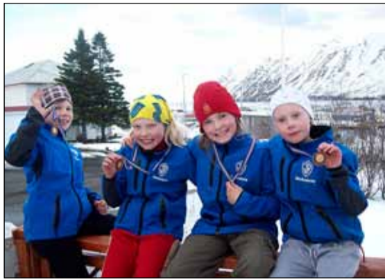
Ungar skíðakonur í ÍR.

Mótin hafa gengið ágætlega og höfum við allar bætt okkur eitthvað á heimlista en stefnan er sett miklu hærra og við höldum áfram að vinna að því á hverjum degi í dásamlegu umhverfi og félagskap.