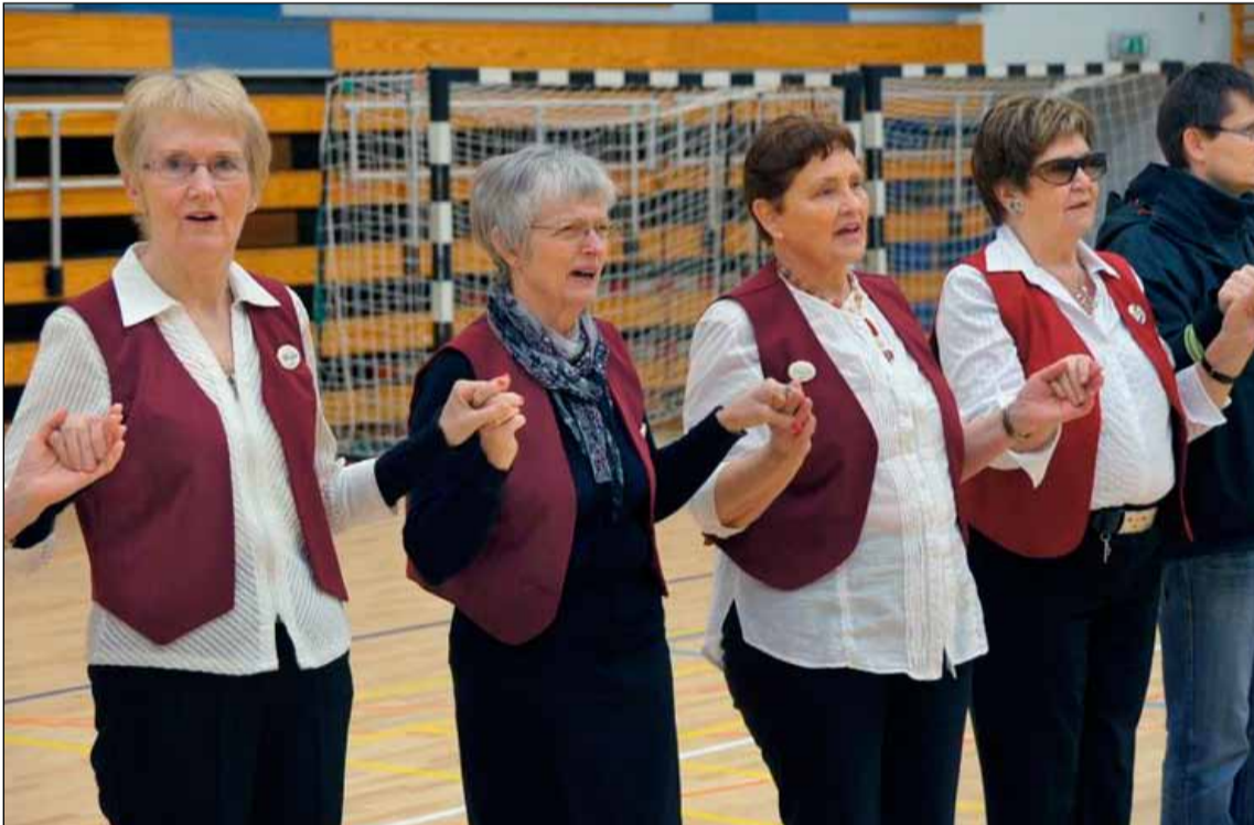
Glaðar í íþróttum fyrir eldri borgara hjá ÍR.