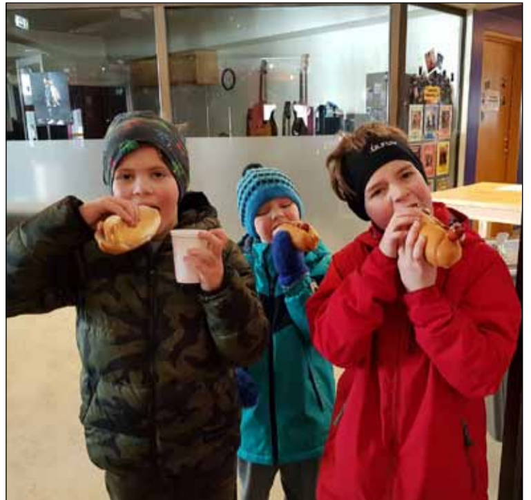
Ein með öllu stendur alltaf fyrir sínu.