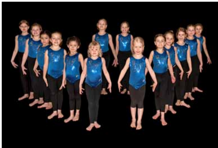
Fimleikastúlkur ÍR í hinum nýja félagsbúningi.

Hópfimleikaliðið er skipað átta stúlkum fæddar 2009, 2010 og 2011 og keppa þær í 4. flokki. Hér má sjá mynd af öllum stúlkunum sem æfa í Framhaldshópi ÍR fimleika en einnig er boðið upp á æfingar fyrir byrjendur.