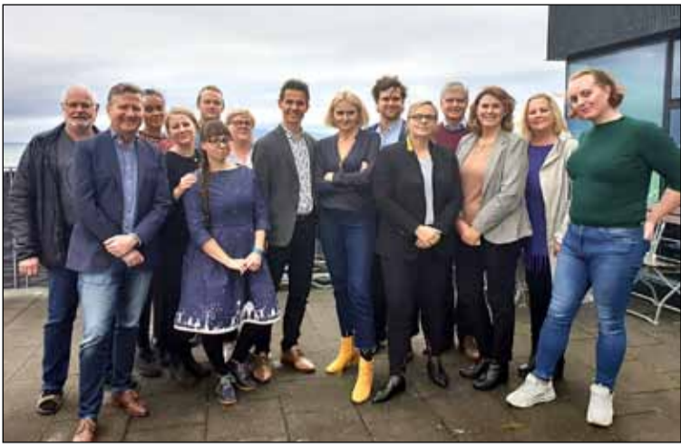
Betri borg fyrir börnin í Breiðholti gæti þessi mynd heitið en þar eru stjórnendur og starfsfólk frístunda- og velferðarsviðs saman komin í tilefni af verkefninu Betri borg fyrir börn í Breiðholti.

einstæðir foreldrar. Þegar við fórum að kanna þetta kom í ljós að flestir þeirra foreldra sem kaupa viðbótartíma eða um 73% er fólk í hjónabandi eða sambúð.