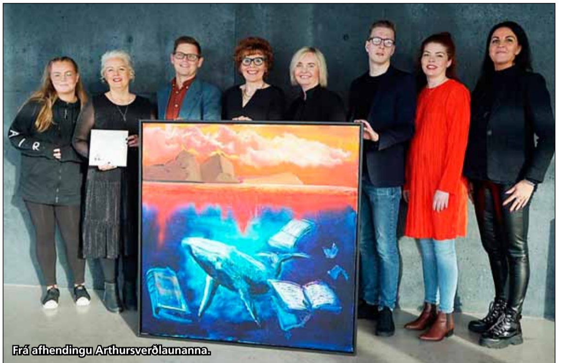
Frá afhendingu Arthursverðlaunanna.

Hólabrekkuskóli hlaut minningarverðlaun Arthurs Morthens að þessu sinni. Verðlaunin voru veitt í fjórða sinn á Öskudagsráðstefnu reykvískra grunnskólakennara. Skólinn hlaut verðlaunin fyrir heildaráætlun um stuðning við nemendur með sérþarfir.