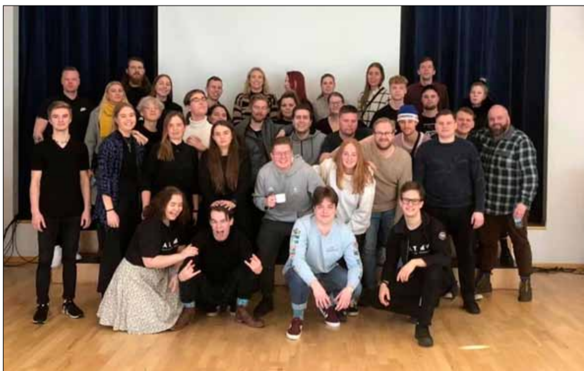
Hópurinn í Breiðholti sem fór til Tallin.

félagsmiðstöðvunum er frábær og má þar meðal annars nefna hjólabrettagarða, tónlistarstúdíó og danssali auk hefðbundinnar aðstöðu. Ferðin var áhugaverð, lærdómsrík og gott hópefli fyrir starfsmannahóp félagsmiðstöðva Breiðholts sem vinna náið saman fyrir unglinga hverfisins.