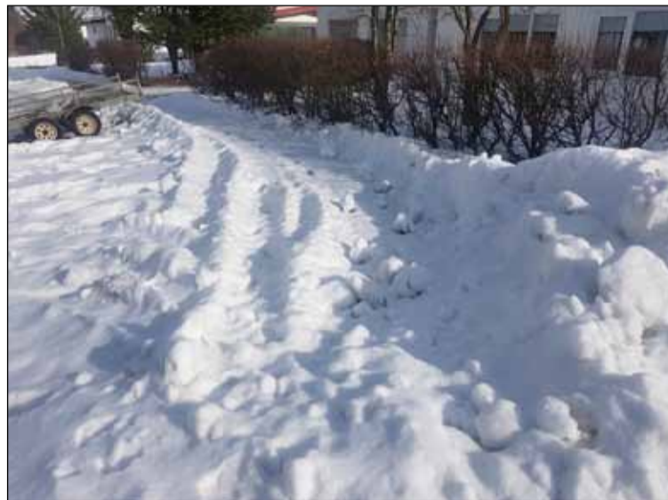
Þessi mynd var tekin í Seljahverfi um miðjan dag mánudaginn 16. mars. Snjóað hafi talsvert nóttina á undan og virtist búið að hreinsa göngustíga að einhverju leiti að minnsta kosti.

sem finna má á heimasíðu Reykjavíkurborgar segir að stofnstígar svo sem göngu- og hjólastígar milli borgarhluta fá forgang í hreinsun og síðan helstu gönguleiðir að strætóbiðstöðvum og skólum sem eiga að vera