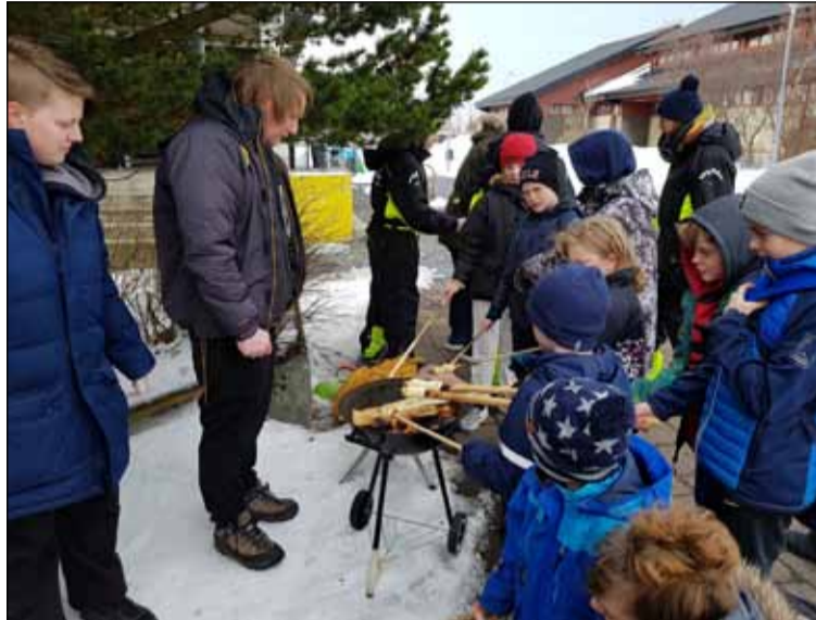
Hópur samankomin við útigrill.

Meðal þess sem boðið var upp á var Tarzanleikur í íþróttahúsinu Austurbergi, Krakkazumba, útiöldun, andlitsmálningu og grímugerð í Miðbergi. Þá var gestum og gangandi boðið upp á grillaðar pylsur.