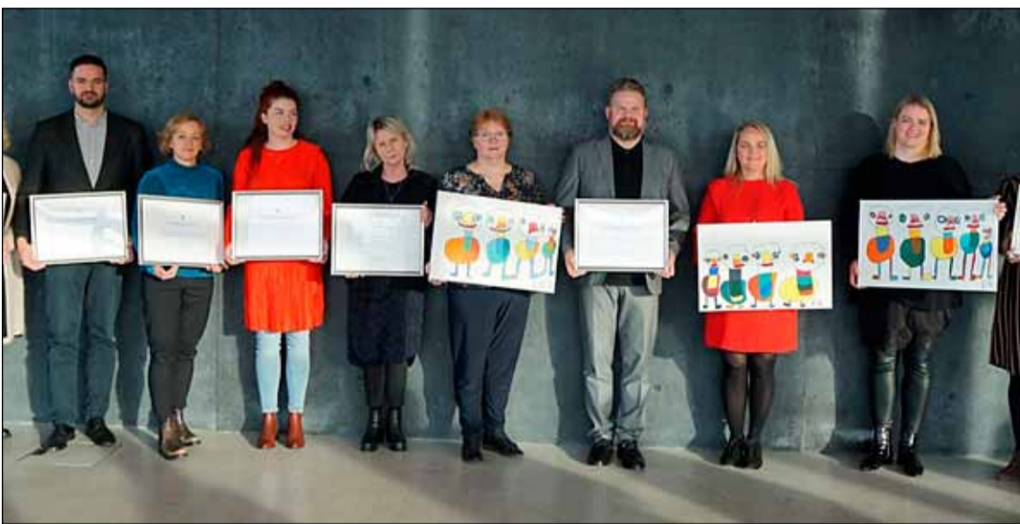
Frá afhendingu hvatningarverðlaunanna í Hörfu.

Hvatningarverðlaunin til grunnskóla voru afhent á Öskudagsráðstefnu grunnskólakennara í Hörfu á dögnum en hátt í sex hundruð kennara voru þar mættir til að fræðast um og ræða loftslagsvandann, sjálfbærni, útinám og leiðir til að vinna með loftslagskvíða.