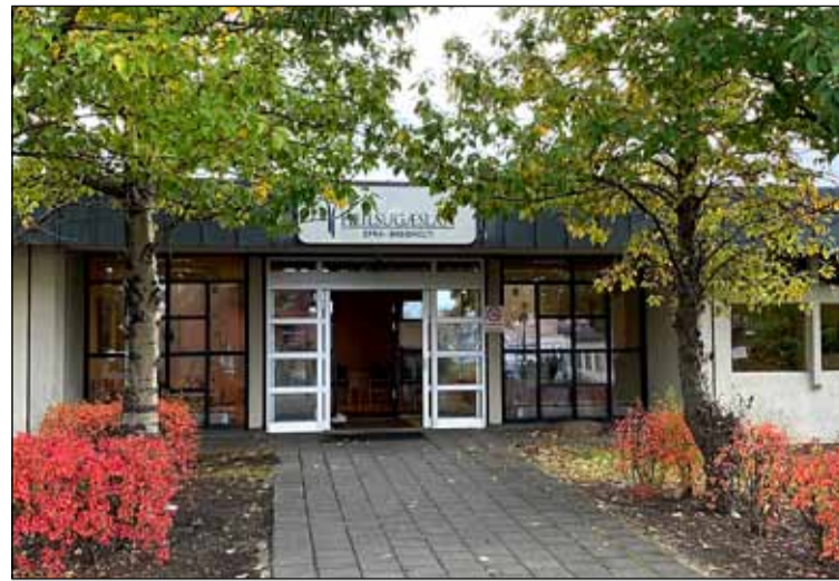
Heilsugæslan í Efra Breiðholti.

Um ármót vakti athygli mína blaðagrein þar sem þekktir Íslendingar voru spurðir um merkar stundir á árinu. Þar segir afi frá athyglisverðri samveru sinni með sex ára gömlu barnabarni. Á göngu, á heimleið úr skólanum er spáð í það sem fyrir augu ber, hvað heitir þetta og hitt eða hvernig er það stafað. Allt þetta séð með augum barnsins. Heima halda þeir samtalinu áfram nú um risaeðlurnar.