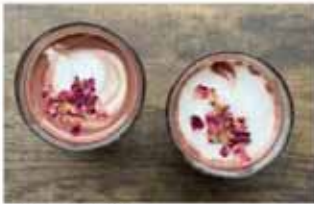
Cacao & trúnó Kíktu í cacao, kaffi, túrmeriklette og annað góðgæti á Boðefnabarnum.