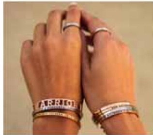
Möntruskart & kristalseyralokkar Tófrandi skart.