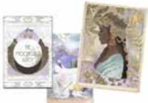
Tarotspil, kerti & reykelsi Allt sem þú þarft til galdra og gleðjast.