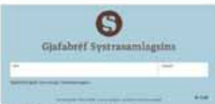
Gjafabréf er gullmoli Fyrir gjafabréf Systrasamlagsins getur fengið allt þetta og meira til.