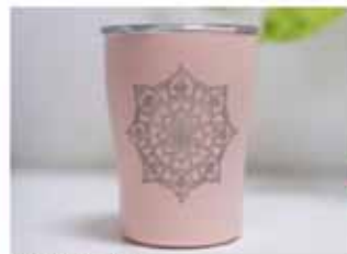
Möntrubollar Taumlaus fuguró og gæði.