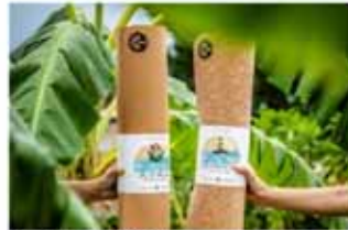
Kork jógaðýnur Sterkar, umhverfisvænar og fallegar.