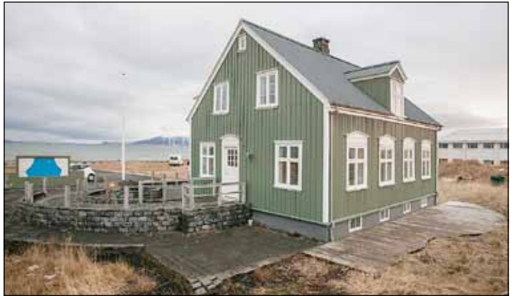
Ráðagerði er á norðvestan verðu Seltjarnarnesi.

Fyrirhugað er að heimila veitingaþjónustu í Ráðagerði. Um yrði að ræða veitingastað þar sem starfsemi verði ekki til þess fallin að valda ónæði í nágrenninu. Um áfengisveitingar yrði að ræða en ekki með háværrri tónlist eða starfsemi sem ekki myndi kalla á mikið eftirlit eða löggæslu. Vegna þess að opna fyrir veitingasölu þarf að breyta aðalskipulagi og deiliskipulagi fyrir Ráðagerði.