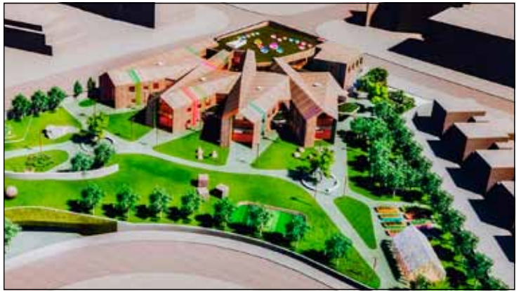
Tillaga Andrúms arkitekta að leikskóla á Seltjarnarnesi.

Bæjarstjórn hefur einnig samþykkt viðauka við fjárhagsáætlun vegna breytinga á áætlun frá Jöfnunarsjóði að upphæð kr. 42.200.000. Viðaukinn er vegna lækkunar framlaga Jöfnunarsjóðs sveitarfélaga vegna útgaldajöfnunarframlaga. Tekjuskerðingu þessari skal mæta með lækkun á handbæru fé um sömu fjárhæð.