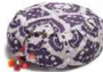
Hugleiðslupúðar Einstök gæði. Lífið er núna.