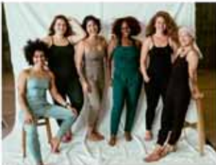
Ómótstæðileg kosýföt Vinsæli lífræni jóga/kosý samfestingurinn.