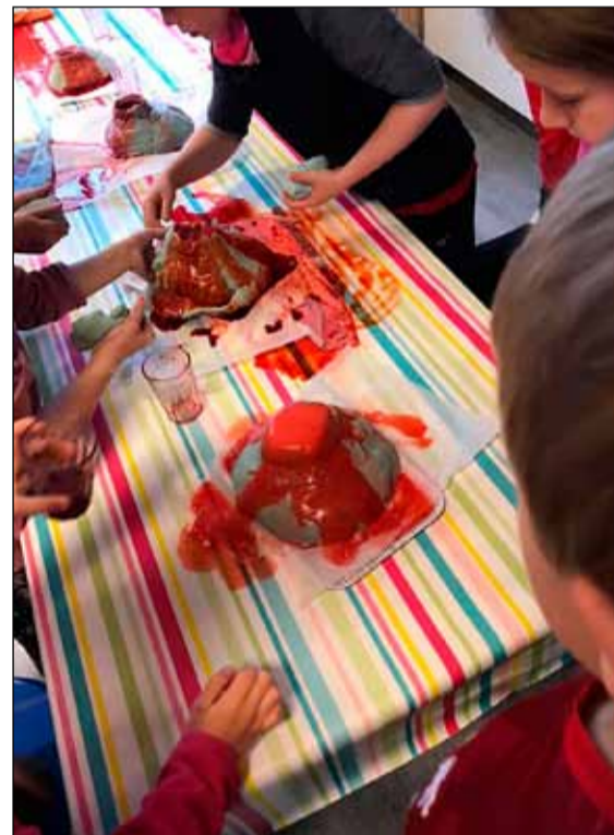
Verið að skreyta eldfjöll í Frosta.