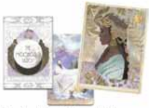
Tarotspil, kerti & reykelsi Allt sem þú þarft til galdra og gleðjast.