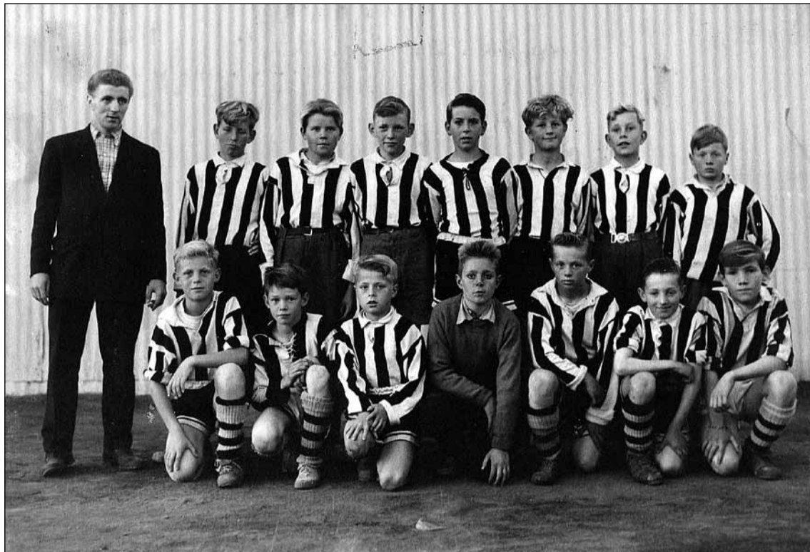
Fjórði flokkur KR í knattspyrnu árið 1950.