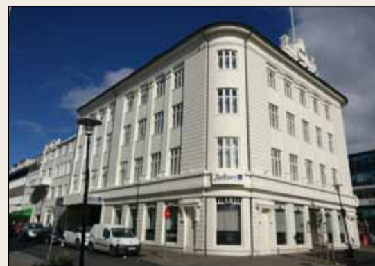
Pósthússtræti 2 oftast kennt við Eimskipafélagið.