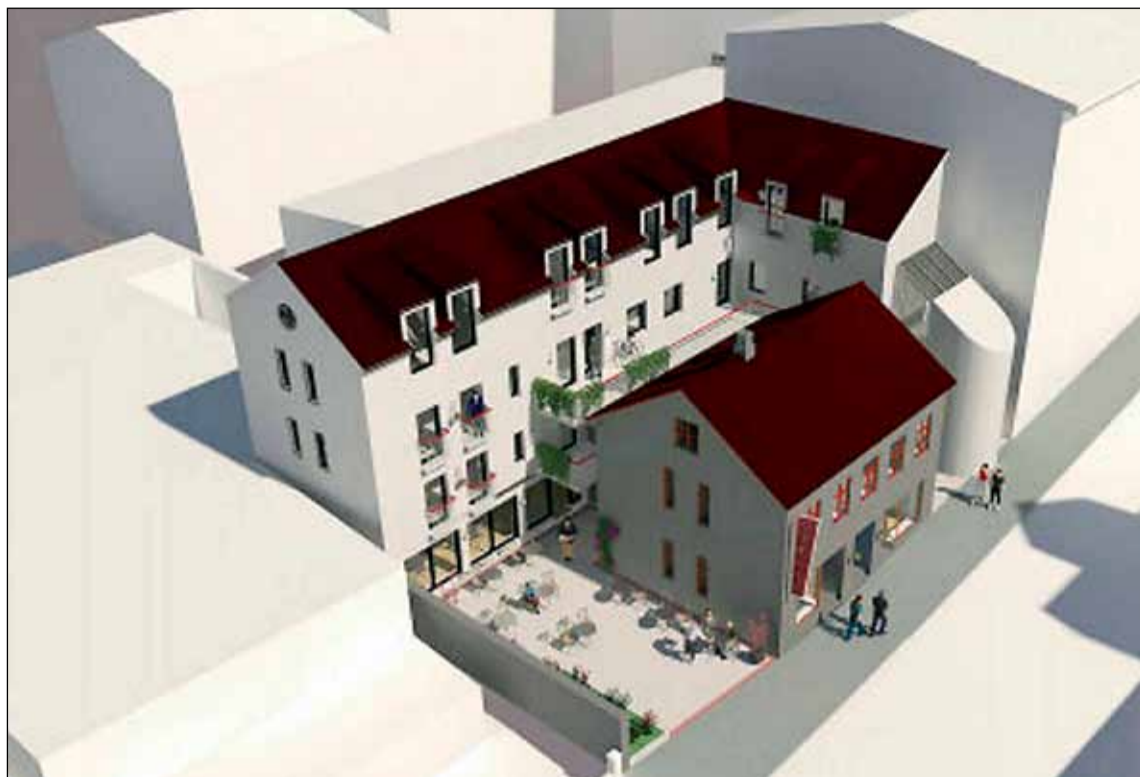
Á þessari teikningu má sjá hvernig fyrirhuguð nýbygging við Bankastræti 3 gæti litið út. “Stelluhúsið” er fremst á teikningunni.