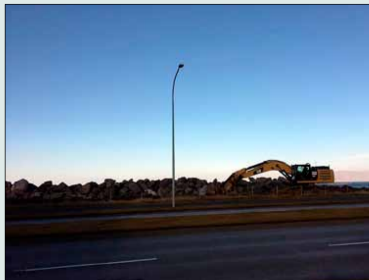
Efni í sjóvarnargarð komið á Eiðisgranda.

Hlaðið verður upp undirlagi framan við garðinn og hann svo endurhlaðinn og breikkaður. Með því er gert ráð fyrir að aldan stöðvist fyrr á garðinum og að hún nái ekki yfir hann. Hæð garðsins verður svipuð og hæð núverandi garðs en sjóvörnin felst í breiðari varnargarði. Fyrirhugað er að þessum fyrstu framkvæmdum við Eiðisgranda verði fyrir áramót.