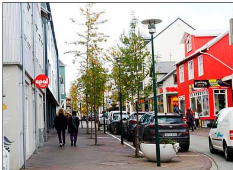
Laugavegur á meðan billinn brunaði þar um.

Gert er ráð fyrir að deiliskipulagið verði afgreitt á fyrsta ársfjórðungi ársins 2021 og að það taki gildi fyrir 1. maí nk. Af þeim sökum var ákveðið að framlengja núverandi göngugötutímabil yfir deiliskipulagsferlið eða til 1. maí 2021. Í frétt frá borginni segir að göturnar hafi vakið ánægju gesta og mikið mannlíf hafi skapaðist á svæðinu. Jólstemmingin sé um þessar mundir að taka yfir í skreytingum og svo verða einnig uppákomur þegar líður á veturinn.