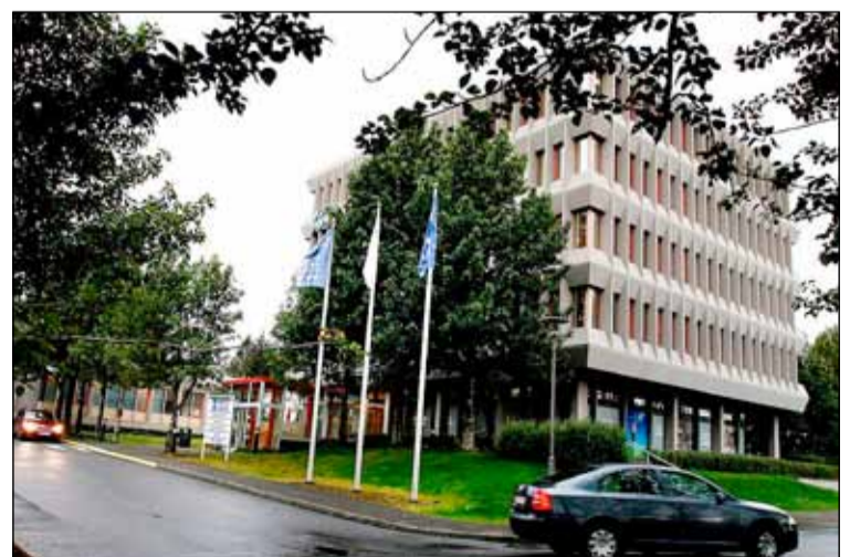
Gamla Orkuhúsið við Suðurlandsbraut 34 mun að líkindum hýsa Myndlistarskólann í Reykjavík í framtíðinni.

Um nokkurt skeið hefur verið leitað að hentugu húsnæði fyrir Myndlistarskólann sem væri meira miðsvæðis í Reykjavík en endi Hringbrautarinnar við Ánanaust er. Nú virðist vera fundinn lausn á því máli. Starfsemi Orkuhússins var flutt í Urðarhvarf í Kópavogi á liðnu hausti en á Suðurlandsbraut voru starfræktar skurðstofur, mótataka lækna, sjúkrahjálfun ásamt fleiru. Nú síðast var húsið nýtt til sýnatöku vegna Covid 19 faraldursins. Fasteignafélagið Reitar