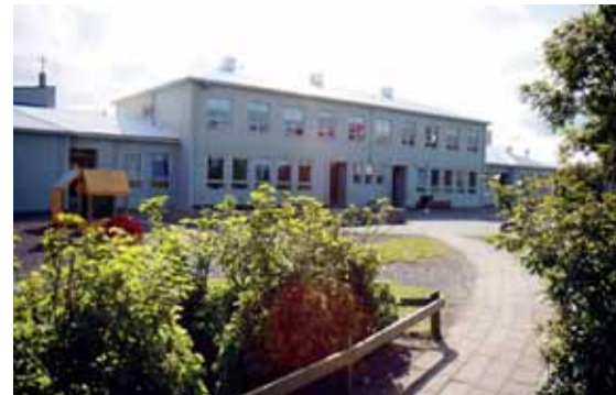
Leikskólinn Hagaborg við Fornhaga.

Í dag er Hagaborg fimm deilda leikskóli og dvelja þar að jafnaði 94 börn samtímis á aldrinum eins til sex ára. Dags daglega koma þar saman um það bil 120 einstaklingar til að læra saman í gegnum leik og góð samskipti. Ég er fullviss um að Hagaborg eigi sérstakan stað í hjörtum margra, enda er listinn langur yfir fyrrverandi og núverandi hagaborgara. Fyrir hönd starfsmanna og barna í Hagaborg, óska ég leikskólanum til hamingju með 60 árin.