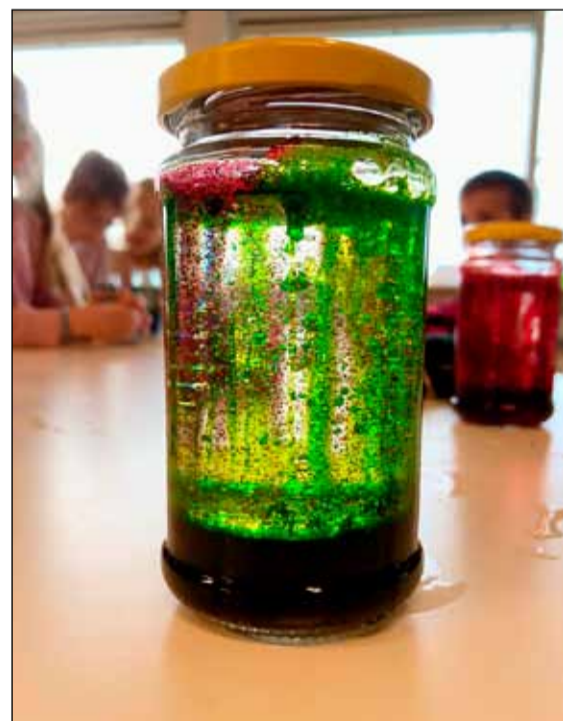
Lava lamp eða hraunlampi var eitt af því sem var búið til í hinsegin vikunni.