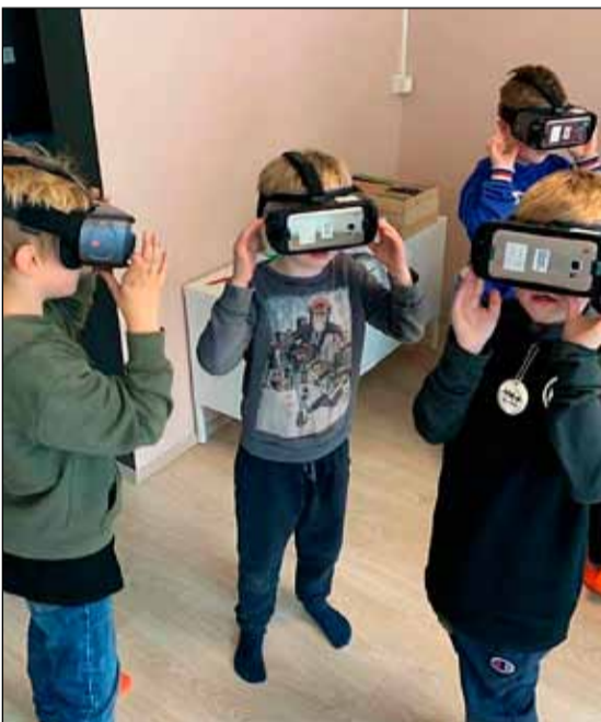
Krakkarnir brugðu sér í sýndarveruleika.

að takast á við áskoranir, hugsa út fyrir boxið og skora hefðbundnar hugmyndir á hólmi og lögðum áherslu á það að brjóta upp kynjaðar staðalmyndir um vísindamenn og gerðum þekktum vísindakönungum og framlagi þeirra því alveg sérstaklega góð skil. Hver veit nema við höfum náð að sá fræjum sem verða að einhverju stórkostlegu sem við öllum eigum eftir að hafa gagn af einhverjum daginn? Við höfum annars heyrt því fleygt að einhverjir hafi óskað þess að vísinda- og tilraunavikan myndi aldrei enda, svo skemmtileg hafi hún verið og góðu fréttirnar eru að hún þarf ekki að gera því við höfum endalaus tækifæri í frístundastarfinu til að vinna með áhugasvið barnanna og ekkert sem hindrar okkur í halda áfram að gera vísindum og tilraunum áfram góð skil í starfinu. Næsta þemavika okkar er svo barnasáttmálavikan sem er vikuna 16. til 20. nóvember, en barnasáttmálinn á einmitt afmæli 20. nóvember þannig að við ætlum að vera með eitthvað skemmtilegt afmælishúllumhæ í gangi þá, jafnvel þó svo Covid sé smá að stríða okkur. Meira um það síðar.