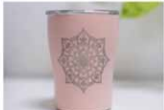
Möntrubollar Taumlaus fegurð og gæði.