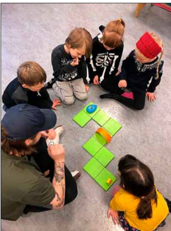
Sum brugðu sér í vísindaakademíu.