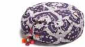
Hugleiðslupúðar Einstök gæði. Lífið er núna.