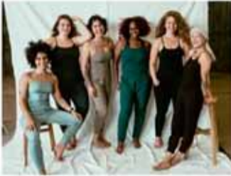
Ómótstæðileg kosýföt Vinsæli lífræni jóga/kosý samfestingurinn.