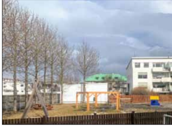
Ýmsar lagfræðingar á möguleikum til útivistar og leikja hafa orðið til vegna hugmyndasöfnunarinnar.

Einnig hefur fjármagn í framkvæmdapottinn verið nánast tvöfaldað og verður að þessu sinni 850 milljónir króna í stað 450 milljóna áður.