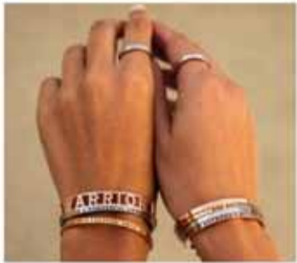
Möntruskart & kristalseyrnalokkar Töfrandi skart.