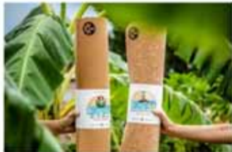
Kork jógaþýnur Sterkar, umhverfisvænar og fallegar.