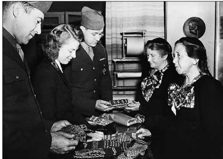
Þessi mynd er táknræn fyrir sögu Thorvaldsensfélagsins. Félagskonur að selja amerískum hermönnum vörur á stríðsárunum.

Thorvaldsensfélagið er góðgerðafélag stofnað af 24 reykvískum konum árið 1875. Félagskonur eru um 100 í dag og sinna þær ýmsum verkefnum fyrir félagið í sjálfböðavinnu. Félagið rekur verslunina Thorvaldsensbasar í Austurstræti og hefur gert samfleytt frá árinu 1901. Þær hafa gefið ýmislegt til sjúkrahúsa og fleira og halda kökubazar árlega sem vakið hefur athygli.