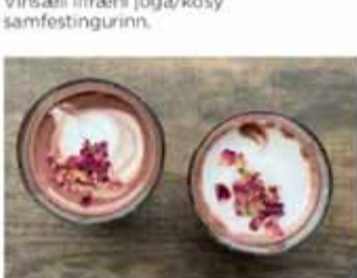
Cacao & trúno Kíktu í cacao, kaffi, túmerikklatte og annað góðgæti á Boðefnabarnum.