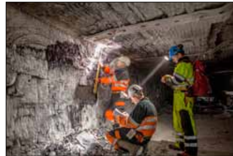
Vinna við mælingar í kolanámu á Svalbarða.

búinn svo ég greip byssu og þaut út. Félagi minn kom á eftir með myndavél og byssu. Hundarnir sátu og horfðu allir í sömu átt. Viti menn. Þarna kom stóreflis ísbjörn röltandi og stefndi í áttina til okkar. Við byrjuðum að hrópa og kalla og skutum nokkrum neyðarblysum að birninum. Hann virtist ekki taka eftir þeim. Þá skutum við nokkrum blysum í feld bjarnarins en hann lét þau engu máli skipta heldur hélt áfram í áttina að okkur. Þegar aðeins innan við tíu metrar voru eftir til hundanna skaut ég síðasta blysinu og lenti það í síðu bjarnarins án