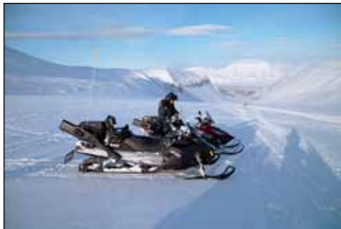
Á ferða á snjósleða á Svalbarða.