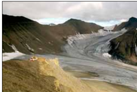
Borpallur í fjöllum á Svalbarða þar sem Bjarki starfaði meðal annars við kolaleit.