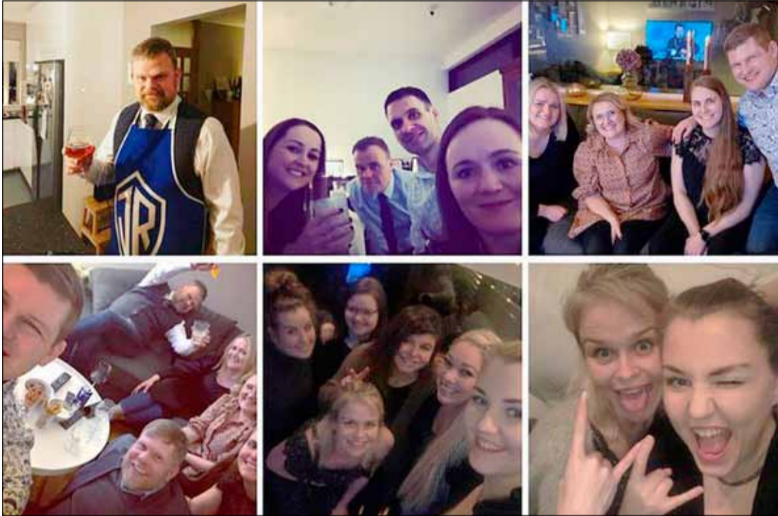
Þorrablót ÍR var haldið með óvenjulegu sniði þetta árið.

Þorrablót verða haldin með öðru sniði en venjulega nú í ár. Íþróttafélag Reykjavíkur var með þeim fyrstu á landinu til að halda stórt þorrablót en það fór fram á rafræna máta. ÍR-ingar fóru þá leið að bjóða sínum félagsmönnum að taka þátt í blótinu með því að kaupa þorrabakka og happdrættismiða. Íþróttafólk félagsins sá síðan um að keyra veisluna út til íbúa Breiðholts og nágrennis síðustu daga en blótið er ein stærsta fjáröflun félagsins.