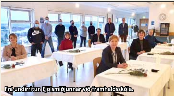
Frá undirritun Fjölsmiðjunnar við framhaldsskóla.

- nám í Fjölsmiðjunni metið til framhaldsskólalæninga