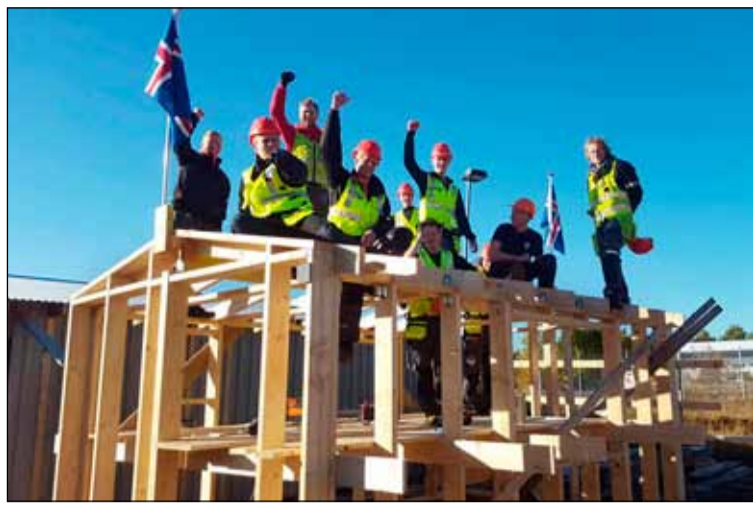
Nemendur í húsasmíði við FB.

Ég var í Hálsaborg sem heitir víst Hálsaskógur í dag og svo tók Seljaskóli við. Þannig kynntist ég íslenskunni snemma og náði tökum á henni sem barn. En ég skil alveg að fólki finnist erfitt að læra íslensku. Tungumálið er nokkuð flókið – einkum málfræðin og allar þessar beygingar.