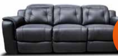
ERMES hægingdasófi. Sjá nánar á lur.is