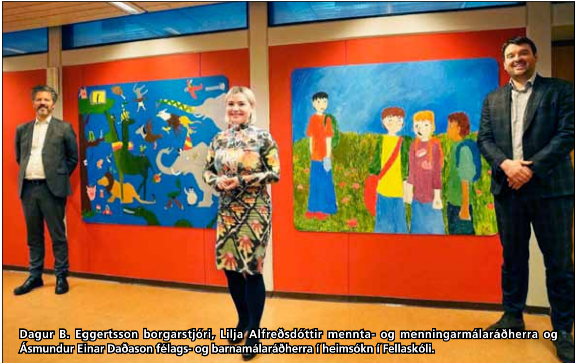
Dagur B. Eggertsson borgarstjóri, Lilja Alfreðsdóttir mennta- og menningarmálaráðherra og Ásmundur Einar Daðason félags- og barnamálaráðherra í heimsókn í Fellaskóli.

Gerður hefur verið samningur milli Reykjavíkurborgar, mennta- og menningarmálaráðuneytis og félagsmálaráðuneytis sem miðar að því að efla málproska og læsi í leik- og grunnskólum og frístundaheimili Fellahverfis. Skólafólk og nemendur í Fellahverfi í Breiðholti munu vinna saman að því að efla íslenskukunnáttu og styrkja sjálfsmynd barna í hverfinu. Um er að ræða samstarfsverkefni til þriggja ára sem miðar að því að efla málproska og læsi og breyta starfsháttum í leik- og grunnskólum og frístundaheimili hverfisins. Verkefnið er nú þegar komið á fullt skrið en að því koma félagsmálaráðuneyti, mennta- og menningarmálaráðuneyti, Reykjavíkurborg og Menntavisindasvið Háskóla Íslands.