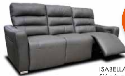
ISABELLA hægingdasófi. Sjá nánar á lur.is