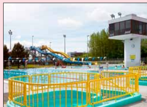
Nýtt hreysti- og klifursvæði nálægt Breiðholtslaug er á meðal hugmynda í söfnunina Hverfið mitt.

Þegar hugmyndasöfnuninni var að ljúka varð ljóst að flestar hugmyndir komu úr Breiðholti þaðan sem komnar voru 139 hugmyndir. Fast á hæla Breiðholts kemur Háaleiti-Bústaðir með 131 hugmynd og í þriðja sæti er Grafarvogur með 117 hugmyndir. Eins og sjá má á meðfylgjandi mynd koma svo Laugar-dalur og Árbær með liðlega eitthundrað hugmyndir hvort hverfi. Ein af þeim hugmyndum sem komu úr Breiðholti var sett yrði upp nýtt hreysti- og klifursvæði nálægt Breiðholtslaug.