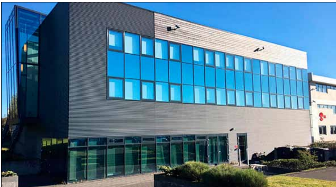
Fjölbrautaskólinn í Breiðholti.

- 53% nemenda skólans í verknámi á liðinni haustönn