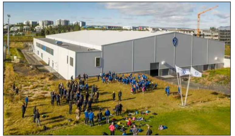
Á athafnasvæði ÍR í Breiðholti er að finna margvíslegt íþróttastarf og góða og batnandi aðstöðu.

lead the project in Breiðholt, say the promotion campaign aims to encourage all residents of Breiðholt, young and old, to adopt a healthy lifestyle by exercising regularly, eating healthy food and, last but not least, by taking care of their mental health.