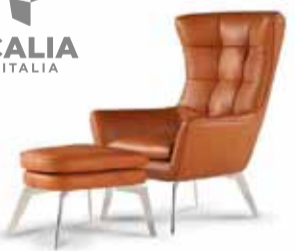
JACOB stóll frá Calia Italia

RÚM • SÓFAR • HVÍLDARSTÓLAR • HEILSUKODDAR • LJÓS • HÚSGÖGN • GJAFAVÖRUR • BORÐ • SÆNGUR