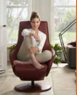
SITTING VISION hvíldarstóllar