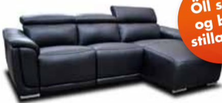
RICCARDO rafstillanlegur tungusófi