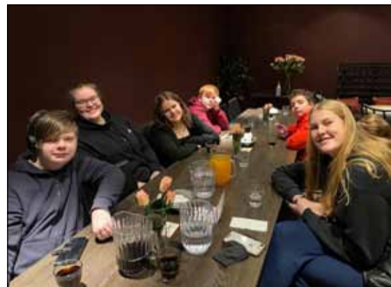
Kvöldopnanir einu sinni í mánuði.