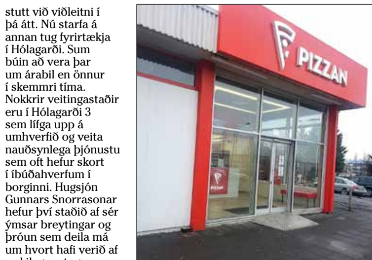
Pizzan opnaði nýlega pizzustað og heim-sendingarþjónustu í Hólagarði.