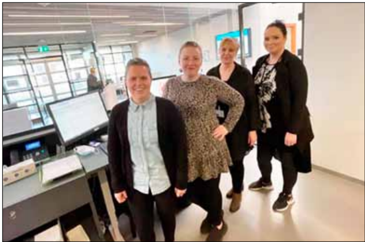
Fjórir af fimm riturum stöðvarinnar.