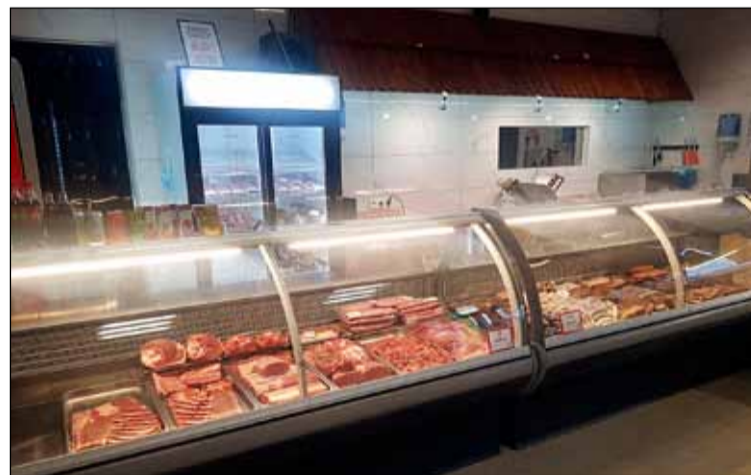
Sérverslun með kjötvörur er í Hólagarði. Þær eru ekki á hverju strái á Íslandi.