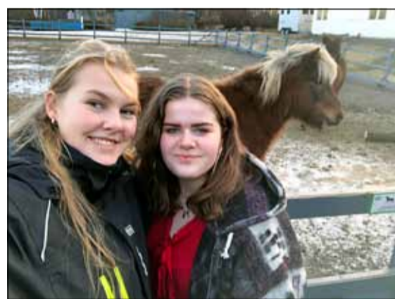
Þessar tvær una sér hjá hestunum.