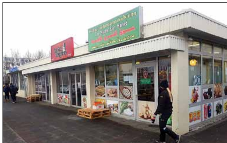
Nokkra veitingastaði er að finna í Hólagarði 3.