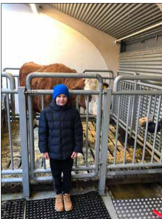
Fjölskyldu- og húsdýragarðurinn hefur verið vinsæll.

Auðbrekku 4, 200 Kópavogi, sími: 537-1029, www.bergsteinar.is