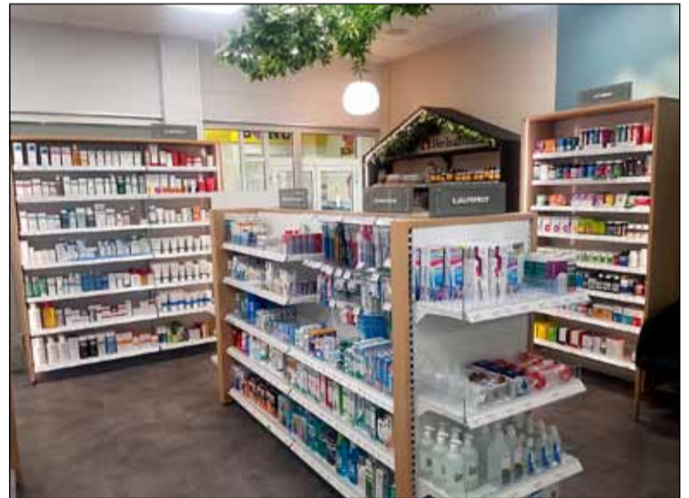
Vöruúrval í Lyfju í Hólagarði.