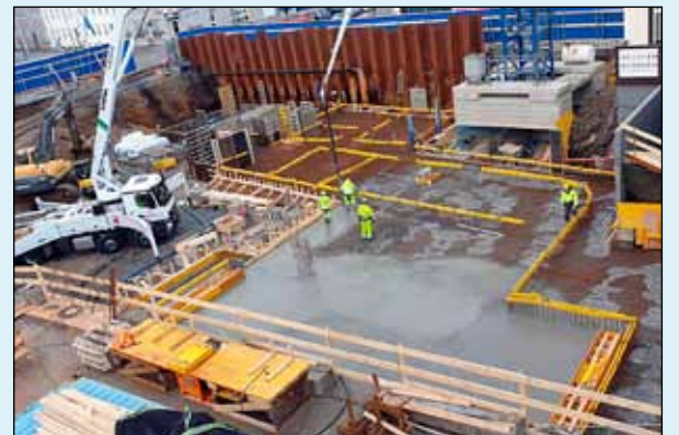
Steypuvinna við botnplötu Alþingis.

Þykkt botnplötu hússins er að meðaltali 70 sentimetrar að því er fram kemur á vef Alþingis. Ástræðar þessar þykktar er að húsið fer á flot eftir að hætt verður að dæla jarðvatni úr grunninum. Þyngd plötunnar mun halda húsinu niðri en að öðrum kosti myndi það lyftast eins og skip á floti. Þungi botnplötunnar verður því eins konar akkeri sem heldur húsinu á sínum stað. Ákveðið hefur verið að dæla ekki vatni úr grunninum fyrr en uppsteypu allra fimm hæða hússins lýkur.