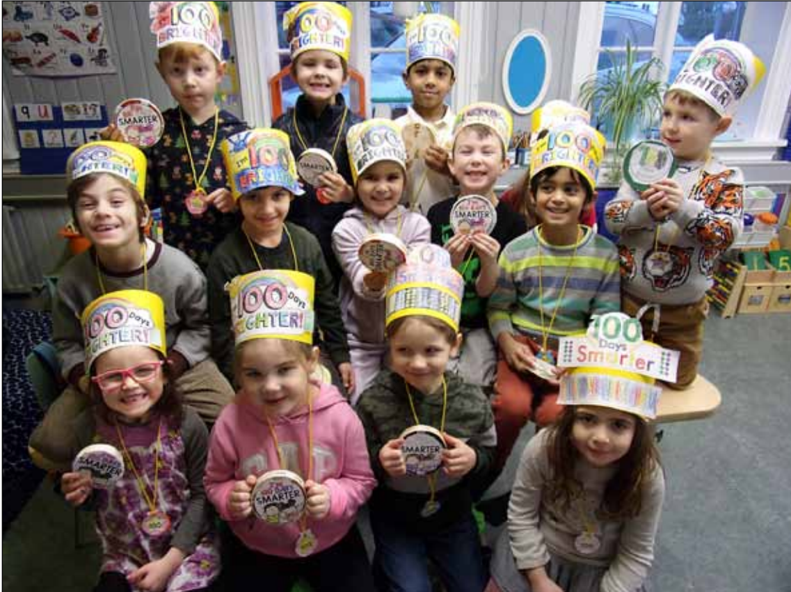
Nemendur 1. bekkjar Landakotsskóla héldu upp á að vera búin að vera 100 daga í skólanum 29. janúar sl. Börnin fögnuðu því með ýmsu skemmtilegu, meðal annars gengu þau inn í allar skólastofur með gleðilátum.