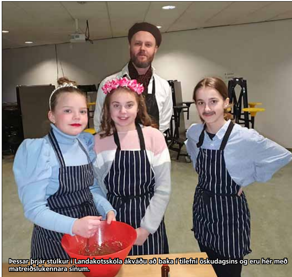
Þessar þrjár stúlkur í Landakotsskóla ákváðu að baka í tilefni öskudagsins og eru hér með matreiðslukennara sínum.