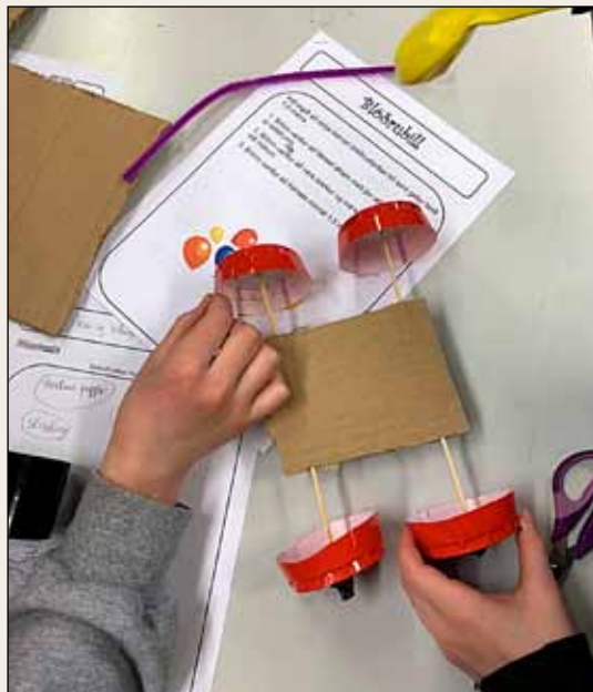
Frá sköpunar-smiðju í Vesturbæjarskóla.

Börn í sjötta bekk í Vesturbæjarskóla hafa unnið í sköpunar-smiðju að undanfögnu. Þar eru ákveðnar áherslur og aðferðir notaðar við kenningu til að auka áhuga og skilning. Unnið er eftir svonefndri „steam“ kennsluáferð sem tekur til vísinda (science), tækni (technology), verkfræði (engineering), sköpunar (art) og stærðfræði (mathematics). Nemendur læra að vinna eftir ákveðnu ferli þar sem þau þurfa að spyrja, hugsa, skipuleggja, byggja, prófa og laga. Nemendur læra forritun í Scratch, fá áskoranir í Minecraft og búa til burstavélmenni og blöðrubíl.