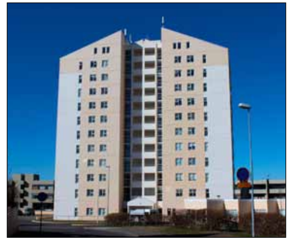
Margskonar starf fyrir alla hópa er á Aflagrand 40.

Félagsstarf Samfélagshússins er öflugt bæði á hefðbundnum opnunartíma milli kl. 9:00 og 15:45 en einnig iðar húsið af lífi eftir lokun þar