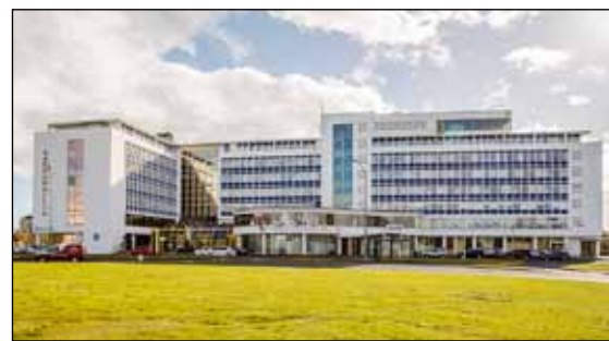
Hótel Saga við Hagatorg.

Bændahöllin, félag í eigu Bændasamtaka Íslands sem á umrædda fasteign, og Hótel Saga, félag í eigu samtakanna sem hafði með höndum rekstur hótelsins eru í greiðsluskjóli sem gildir til 7. apríl. Samtökin hafa verið í og eru í samskiptum og viðræðum við allmarga áhugasama aðila um málið.