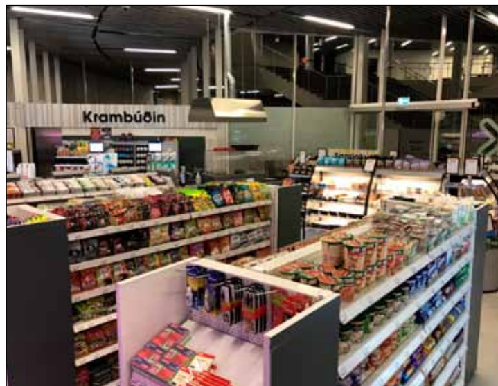
Fjölbreytt vöruúrval er að finna í Krambúðinni.