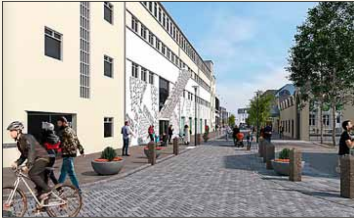
Tryggvagata framan við Hafnarhúsið.

Framkvæmdir eru hafnar á ný í Tryggvagötu. Síðastliðið sumar var unnið við fyrsta áfanga framkvæmdar Reykjavíkurborgar og Veitna við endurnýjun götunnar.