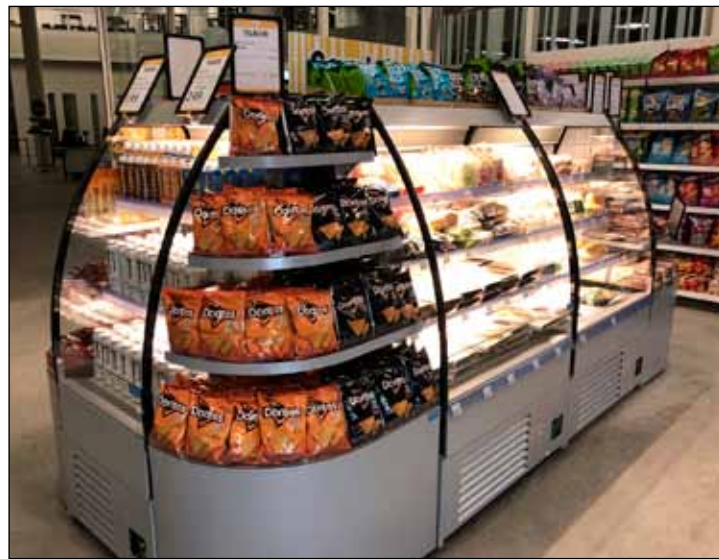
Glæsileg kælieyja er í Krambúðinni við Menntaveg.