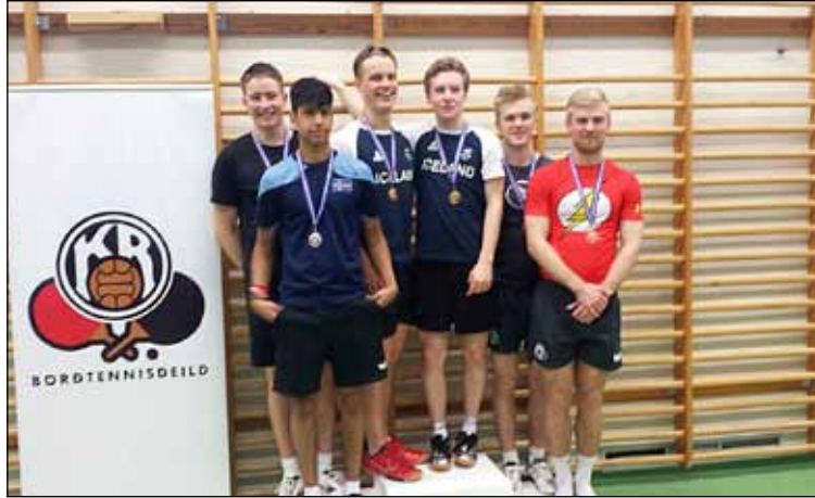
Myndirnar eru af af verðlaunahöfum í tvíliðaleik.