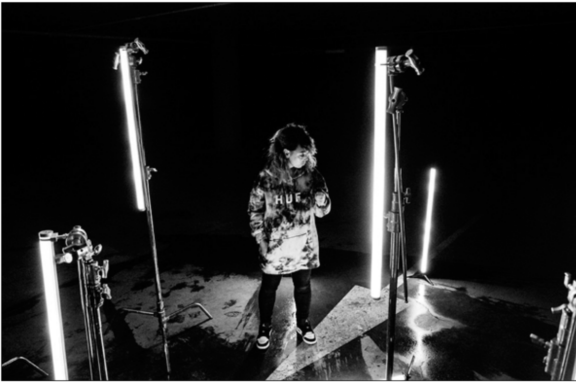
Ragna tilbúin á svið.

Ég var í vafa um að nokkur myndi vilja fjármagna plötu eftir kvenkyns rappara. Ég fór að sækja um og mér til undrunar fékk ég fjóra styrki.