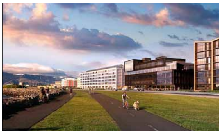
Gamla Sambandshúsið og síðar bankahús til vinstri en nýjar byggingar sem risið hafa á svæðinu til hægri.

Húsið á sér nokkuð langa sögu. Það var upphaflega reist fyrir hraðfrystistöð Júpiter og Mars. Síðar stóð það næstum autt um árabíl en var endurgert fyrir höfuðstöðvar Sambandsins þegar þær voru fluttar úr gamla Sambandshúsinu á Lindargötunni. Eftir fall Sambandsins tók Glitnir síðar Íslandsbanki við húsinu og voru höfuðstöðvar Glitnis banka fluttar þangað árið 1995. Árinu 2017 varð mikillar myglu yart í húsinu voru höfuðstöðvar Íslandsbanka þá fluttar í annan turninn í Smáranum í Kópavogi.