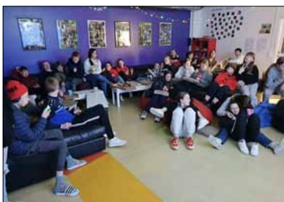
Hópur ungmenna í fræðslustund um kynheilbrigði.