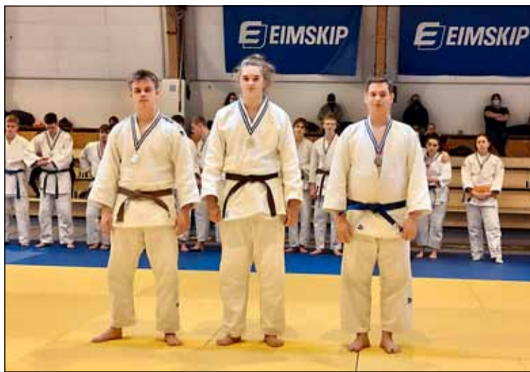
Kappar á júdmóti.