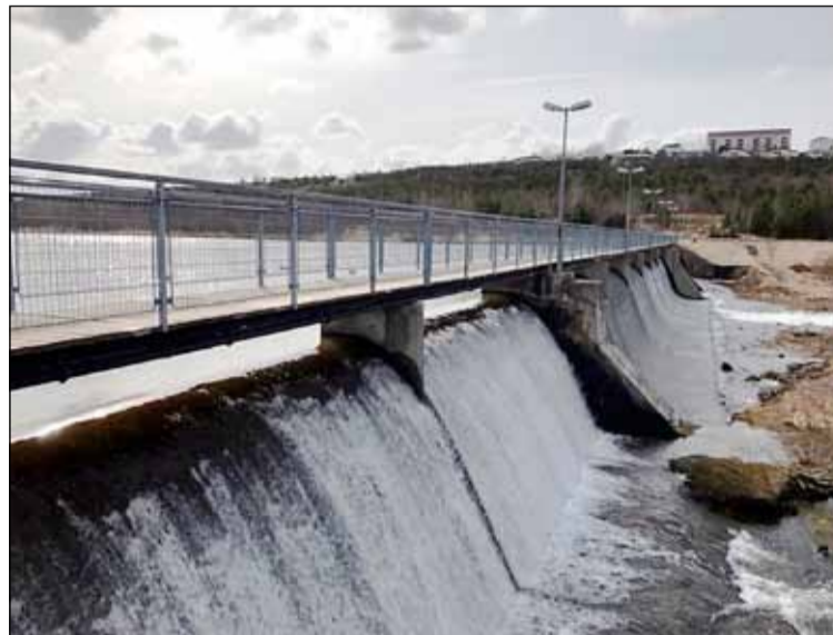
Elliðaárstífla á meðan var vatn í lóninu.

Deilur hafa staðið um þessa ákvörðun Orkuveitunnar þar sem komið hefur fram í máli þeirra sem vilja vatn í lónið að nýju að ólöglega hafi verið staðið að tæmingu þess. Þá hefur einnig verið kvartað yfir því að ekki hafi verið haft samráð við íbúa á svæðinu áður en tappinn var tekinn úr því. Málið má rekja aftur til þess að ákveðið var að hætta rekstri Elliðaárstöðvar í desember 2019. Við þá ákvörðun féllu heimildir veitunnar til að reka lón úr gildi og bar veitunni skylda til þess að tæma það. Skipulagsstofnun bendir á að standi til að gera varanlega breytingu á lóninu með varanlegri opnun fyrir rennsli í gegn um stíflu þurfi að gera grein fyrir því og umhverfisáhrifum þess í deiliskipulaginu. Sjálf stíflan er friðuð og því ekki að svo komnu unnt að fjarlægja hana. Málið er ekki einfalt. Í greinargerð Skipulagsstofnunar