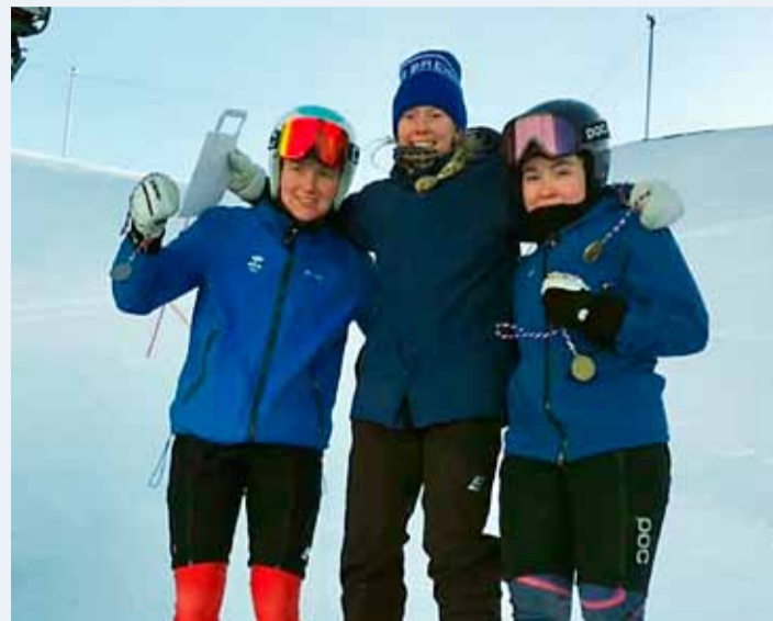
Skíðastelpur ÍR á toppnum.

Fjögur bikarmót skíðasambands Íslands fóru fram í Bláfjöllum um helgina 13. til 14. mars. Tvö svig sem einnig voru FIS og tvö ENL stórsvigsmót.