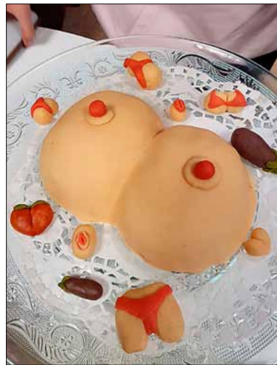
Myndarleg kaka. Engum blöðum er að fletta um hvað myndirnar í deiginu eiga að tákna.

að spreyta sig á þeim spurningum hjá okkur. Við höldum einnig kókukeppni, myndlistakeppni o.fl. allt í þema VikaSex. Starfsfólk félagsmiðstöðvanna í Breiðholti, og unglíngarnir vorum ótrúlega sátt með þessa viku.