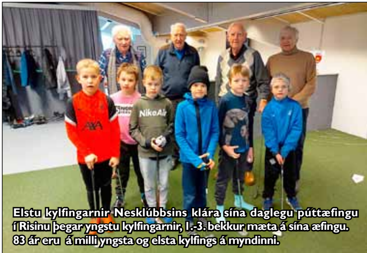
Elstu kylfingarnir Nesklúbbsins klára sína daglegu þúttæfingu í Risinu þegar yngstu kylfingarnir, 1.-3. bekkur mæta á sína æfingu. 83 ár eru á milli yngsta og elsta kylfings á myndinni.