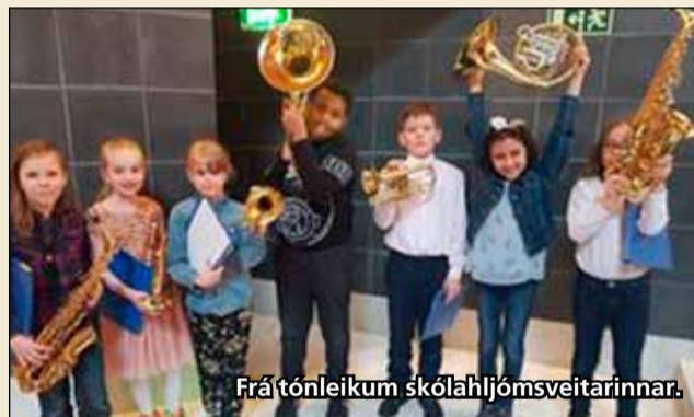
Frá tónleikum skólahljómsveitarinnar.