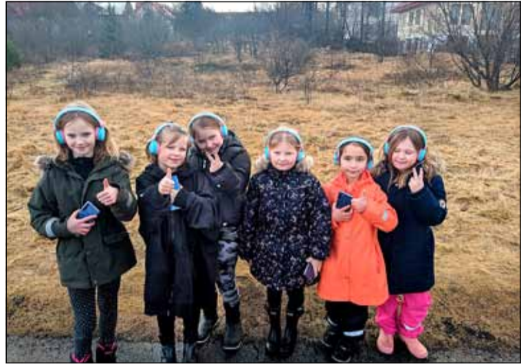
Börn úti að hreyfa sig og læra að hlusta á umhverfið.

Starfsmenn frístundaheimilina í Breiðholti eru þessa dagana að byrja að undirbúa dagskrá sumarsins en eins og undanfarin sumur ætlum við að bjóða uppá fjölbreytt sumarstarf á öllum frístundaheimilum Breiðholts þar sem allir ættu að finna eitthvað við sitt hæfi. Skráning hefst þriðjudaginn 27. apríl n.k. Hægt verður að sjá hvaða námskeið er í boði á www.fristund.is