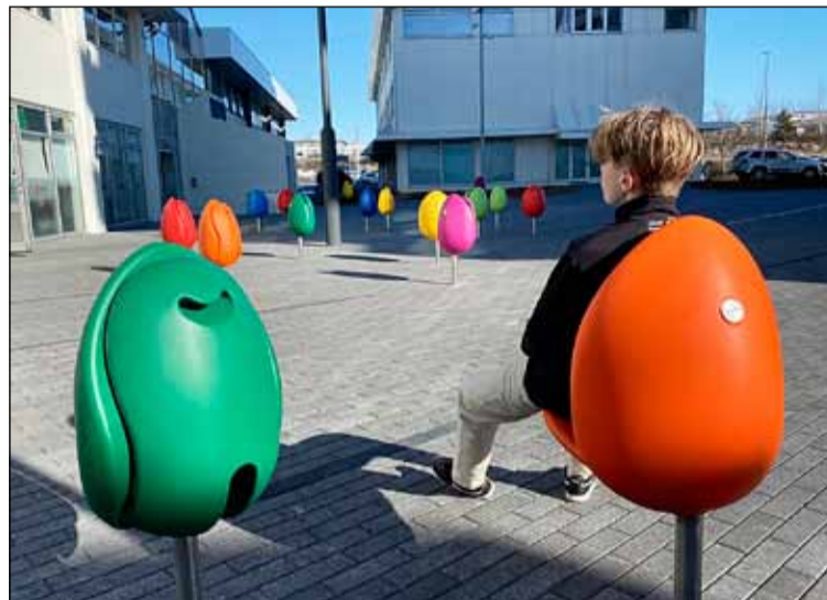
Túlípanarnir nýtast sem þægileg snúningssæti og ruslatunnur.

Lögð var áhersla á að skapa aðlaðandi rými með bekkjum, gras- og gróðursvæðum skipt með eyjum úr corten-stáli og hellulögn. Þarna eru litríkir ljósrammar sem hvetja fólk til að staldra við, leika sér og taka myndir. Rammarnir eru um það bil tveir til þrjú metrar í þvermál, auk þess er þeim snúið um miðás þannig að úr verður áhugavert form sem er breytilegt eftir sjónarhorni. Í römmunum eru einnig lampar sem endurkasta liti rammanna út í umhverfið. Rammarnir bjóða því upp á ólíka stemmingu eftir því hvort að það er dagur, ljósaskipti eða nótt.