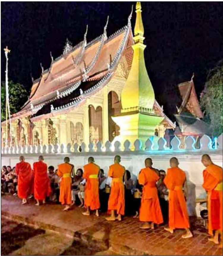
Frá Laos. Búddamunkar í Laos færa fólki mat.

inni. Ég vildi frekar fara heim þótt ég kynni að missa af einhverjum ævintýrum en þurfa að lokast í landinu í mánuði eða jafnvel ár vegna samgönguleysis.