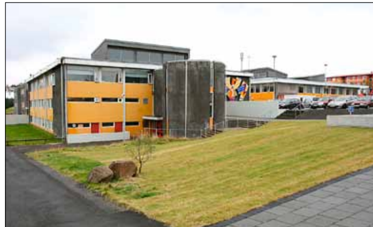
Krakkar í fimmta bekk Ölduselsskóla hafa að undanfögnu unnið verkefni við ritun texta. Kannski verður að finna rithöfunda fram-tíðarinnar í þessum hópi.