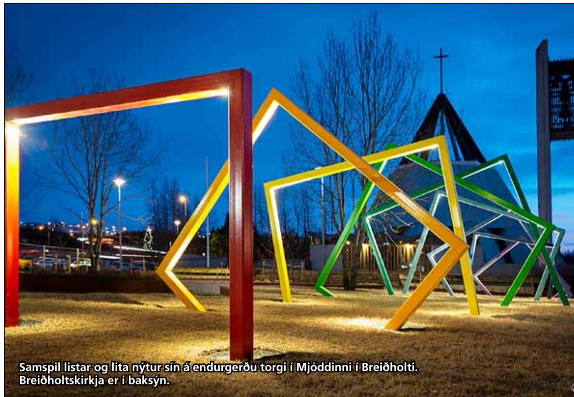
Samspil listar og lita nýtur sín á endurgerðu torgi í Mjóddinni í Breiðholti. Breiðholtskirkja er í baksýn.