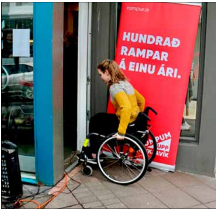
Fyrsti rampurinn komin við Kokku.