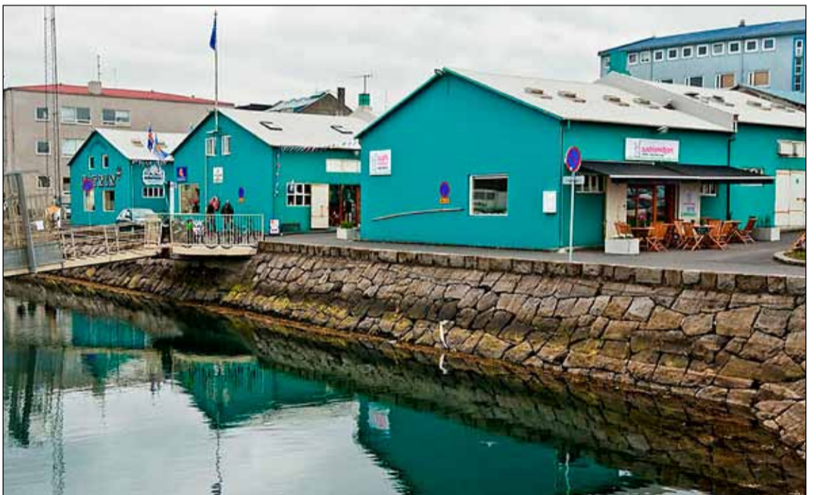
Gömlu verbúðirnar við Geirgötu hafa fengið nýtt hlutverk. Í stað beitinga og annarar útvegs- og fiskvinnustarfsemi hefur veitngarekstur haslað sér völl í þessum húsum sem setja mikinn svip á hafnarsvæðið og skapað nýtt mannlíf.

Þegar ríkiskaup auglýstu það til sölu. Geðhjálp sýndi áhuga á því en félagið var þá með aðstöðu á annarri hæð fyrir skrifstofu og félagsmiðstöð. Af því að Geðhjálp festi kaup á húsinu varð ekki.