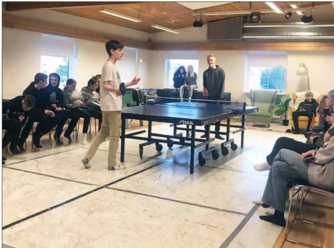
Frá félagsstarfinu í Frosta.

Mikið líf og fjör hefur verið í Frosta síðustu vikur eftir stutta skerðingu á starfsemi okkar í kringum páskafríð vegna samkomutakmarkana. Í unglingastarfinu höfum við brallað ýmislegt, hældum glæsilegt borðtennismót, buðum upp á kökur og heitt súkkulaði á kakóhúsi Frosta og áttum notalegar stundir í Trúnó.