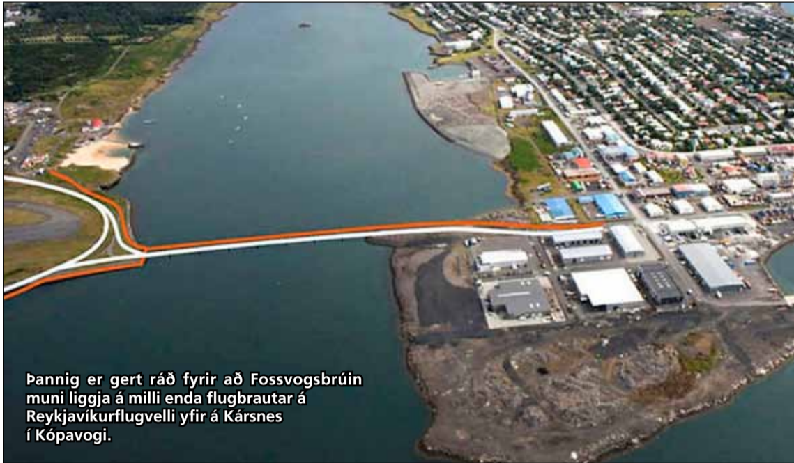
Þannig er gert ráð fyrir að Fossvogsbrúin muni liggja á milli enda flugbrautar á Reykjavíkurflugvelli yfir á Kársnes í Kópavogi.

hjólandi og umferð almenningsvagna yfir Fossvog, frá flugbrautarenda Reykjavíkurflugvallar vestan Nauthólsvíkur yfir á norðausturhluta Kársnestáar. Samkeppnissvæðið tekur til þess svæðis á landi og sjó sem mun falla undir og við fyrirhugaða brúartengingu yfir Fossvog, milli Kópavogs og Reykjavíkur og nágrenni þess. Stærð samkeppnissvæðisins er um 4,9 hektarar.