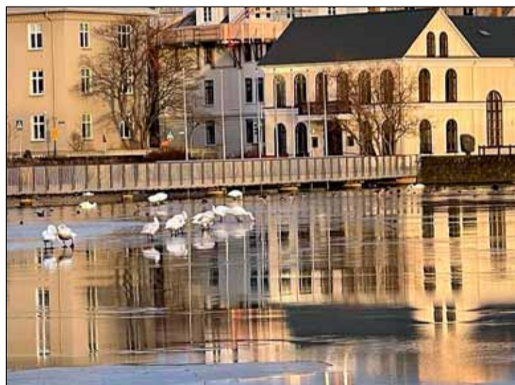
Álftir á Reykjavíkurtjörn. Iðnó í baksýn.

Auglýst var eftir verkefnum og viðburðum sem ætlað er að stuðli að auknu mannlífi, menningu, félagsauði og lífsgæðum í hverfunum árið 2021. Mikilvægt er að verkefni höfði til allra aldurshópa og skírskoti til breiðs hóps fólks sem vill sækja sér afþreyingu og upplifun í eigin hverfi. Sjóðurinn sem ætlaður er til þessa verkefnis nemur alls kr. 30.000.000 Miðað er við að íbúaráð sem eru níu talsins, fái milljón hvert en afgangurinn deilist til íbúaráða eftir íbúafjölda hverfanna. Einstaklingar, félagsamtök eða aðrir hópar sem vinna saman að einstöku verkefni gátu sótt um styrk í sjóðinn. Styrkir geta til dæmis fallið til: Viðburða í hverfum borgarinnar sem höfða til allra aldurshópa, markaða