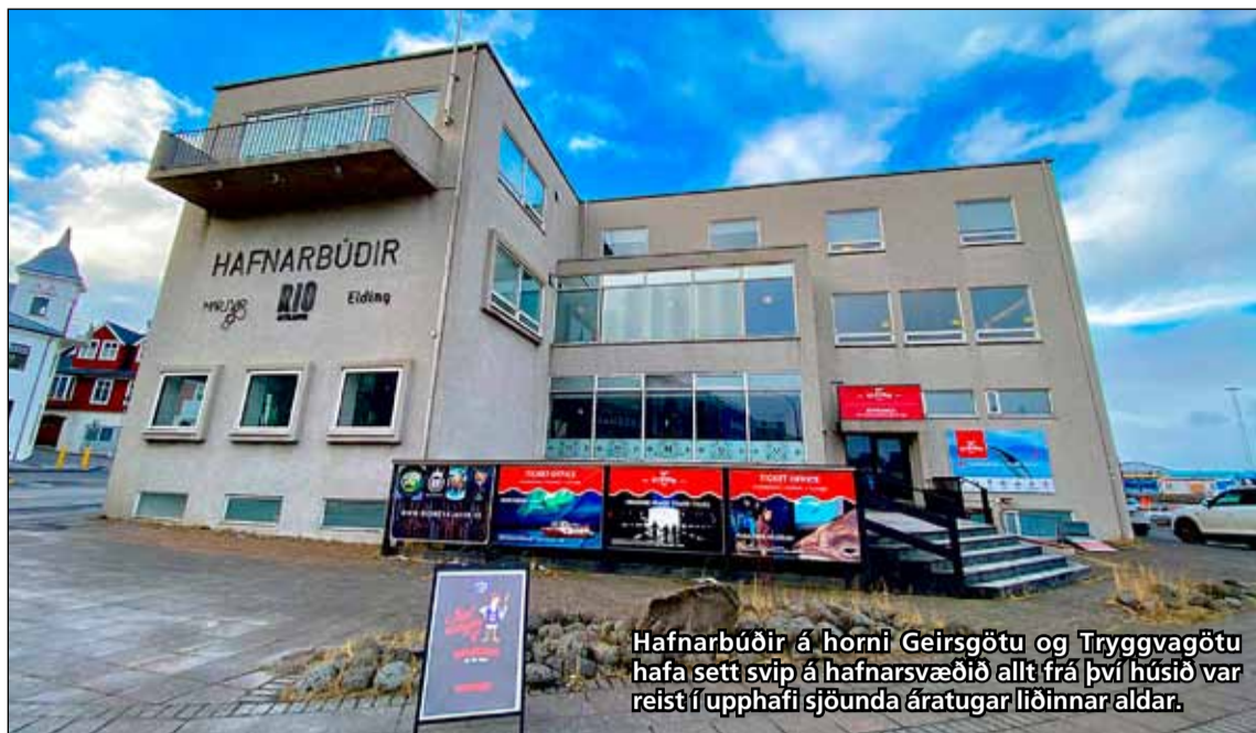
Hafnarbúðir á horni Geirsgötu og Tryggvagötu hafa sett svip á hafnarsvæðið allt frá því húsið var reist í upphafi sjöunda áratugar liðinnar aldar.