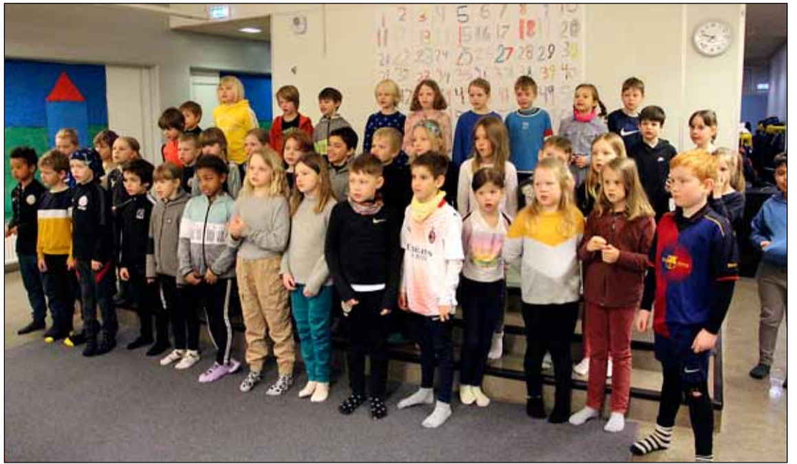
Þessar myndir voru teknar á þemadögum í Grandaskóla.

Íslenskan var í fyrirrúmi í sinni fjölbreyttu mynd á þemadögum sem haldnir voru í Grandaskóla 17. til - 19. mars og voru þeir tileinkaðir íslensku.