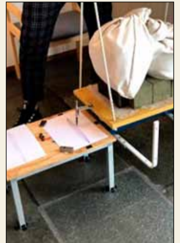
Þessar myndir voru teknar í vísindasmiðjunni.