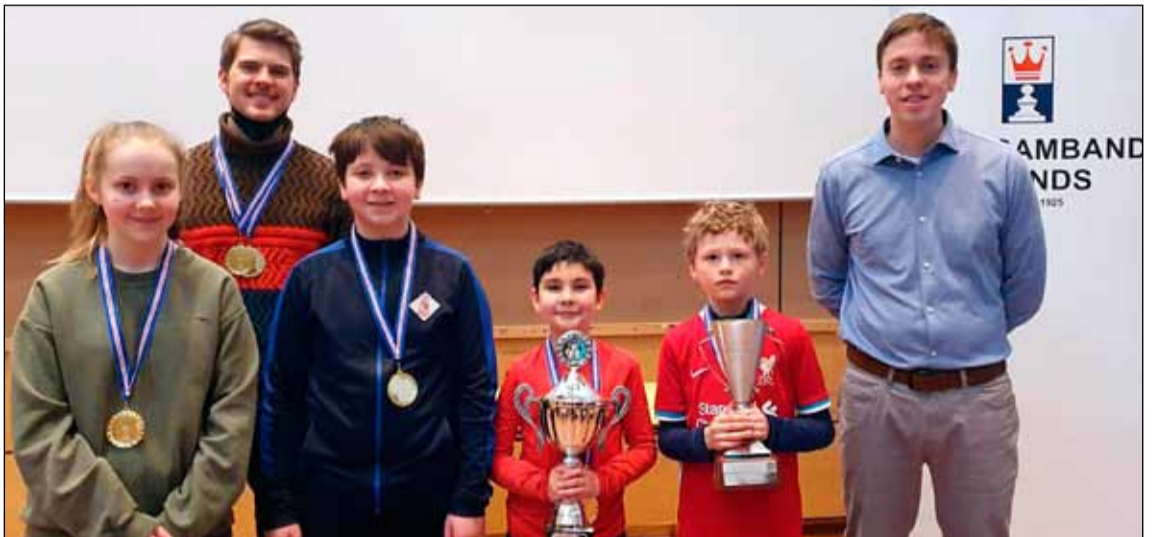
Skáksveit Landkotsskóla ásamt liðsstjórum.

Landkotsskóli var Íslandsmeistari grunnskólasveita á Íslandsmeistaramóti grunnskólasveitanna sem haldið var nýlega. Íslandsmeistaratitillinn vannst eftir mjög spennandi keppni við Vatnsendaskóla, Hörðuvallaskóla og Lindaskóla. Sveitin 2,5 vinninga á þá næstu á eftir.