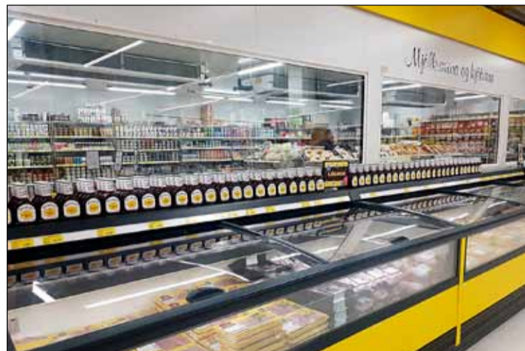
Nýjar kistur, nýjar hillur og bjart yfirbragð einkenna verslun Bónus í Hólagarði.

Fleira hefur verið lagfært og endurbætt í verslun Bónus í Hólagarði. Búið er að endurnýja aðgang að versluninni. Setja upp nýjar hurðir og aðskilja inn- og útgang. Einnig er búið að skipta um frystikistur og hurðir á kælum. Er það gert til þess að spara raforku og í því sambandi hefur líka verið sett upp ný lýsing. Lýsingu sem tekur minni orku og lýsir betur upp en