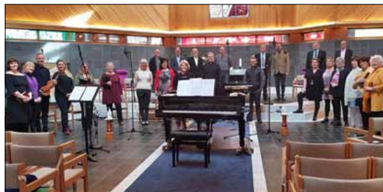
Kór Fella- og Hólakirkju.