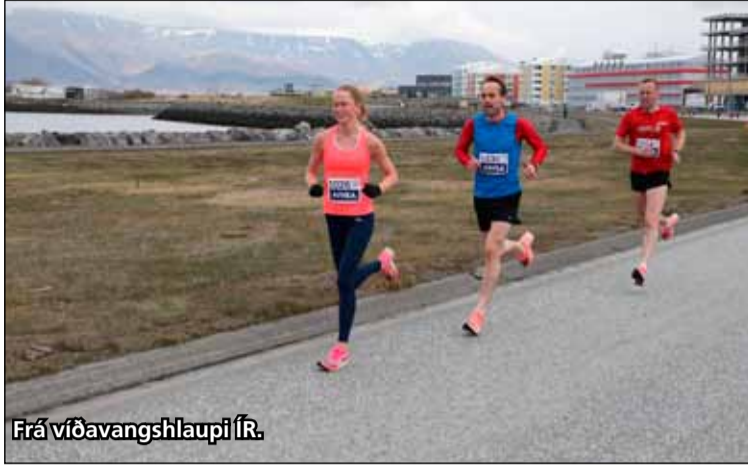
Frá víðavangshlaupi ÍR.

Hlaupið var eftir syðri akreinn austur að gatnamótum við Kringlumýrarbraut, beygt inn á Kringlumýrarbraut og tekinn snúningur til baka í átt að Sæbraut á gatnamótum Kringlumýrarbrautar og Borgartúns. Þá var Sæbrautin hlaupin áfram til austur að Kirkjusandi þar sem tekinn er snúningur inn á nyrðri akreinnina og hún hlaupin til baka áfram í mark við Hörpu. Víðavangshlaup ÍR hefur farið fram á sumardaginn fyrsta í rúma öld en það var fyrst haldið árið 1916 og hefur síðan þá verið