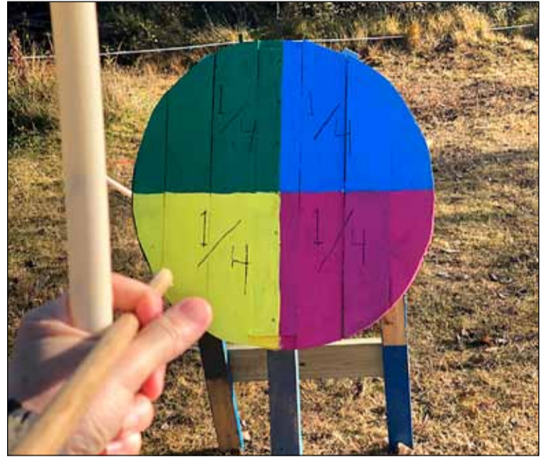
Neysluveislan er umhverfismiðaður og skemmtilegur snjall-rattleikur.

Vordagskrá þeirra er tileinkuð unglíngastígi og ber heitið, Neysluveislan. Neysluveislan er umhverfismiðaður og skemmtilegur snjall-rattleikur sem tekur fyrir málefni ábyrgar neyslu og framleiðslu. Efni dagskrárinnar er tileinkað umhverfismálum með sérstakan fókus á tólfta heimsmarkmið Sameinuðu þjóðanna um sjálfbæra þróun. Verkefnið tekur á vistfræðilegum fótsporun helstu neysluflokka einstaklinga og veltir upp hvað við getum gert til að gera lífnaðarhætti okkar sem sjálfbærasta.