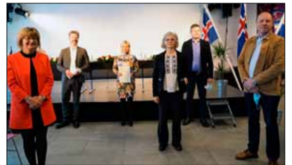
Samningurinn var undirritaður við hátíðlega athöfn í FB.