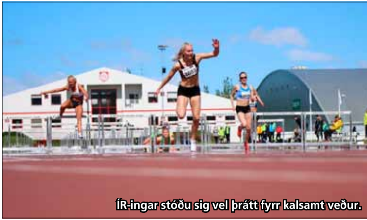
ÍR-ingar stóðu sig vel þrátt fyrir kalsamt veður.