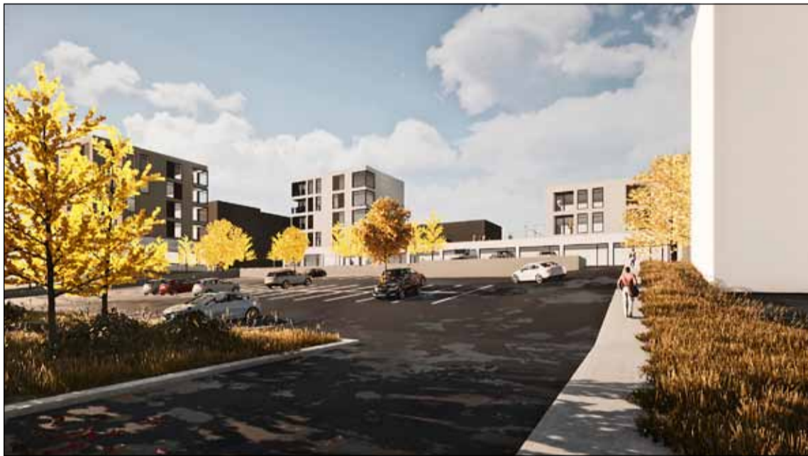
Hugmynd að endurbyggingu við Drafnarfell.