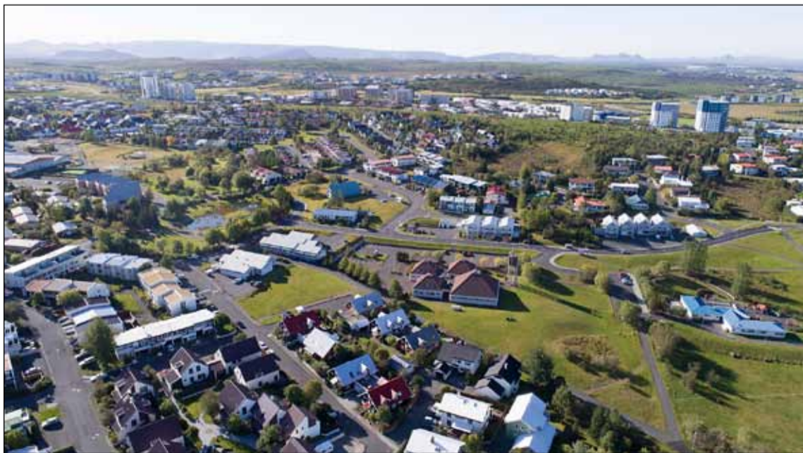
Séð yfir Seljahverfi. Þar meðal annars stefnt að endurbyggingu við Rangársel og að koma svonefndum Vetrargarði fyrir.

viðbyggingar og fjölga íbúðum í þegar byggðum húsum.