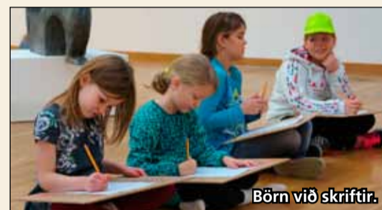
Börn við skriftil.