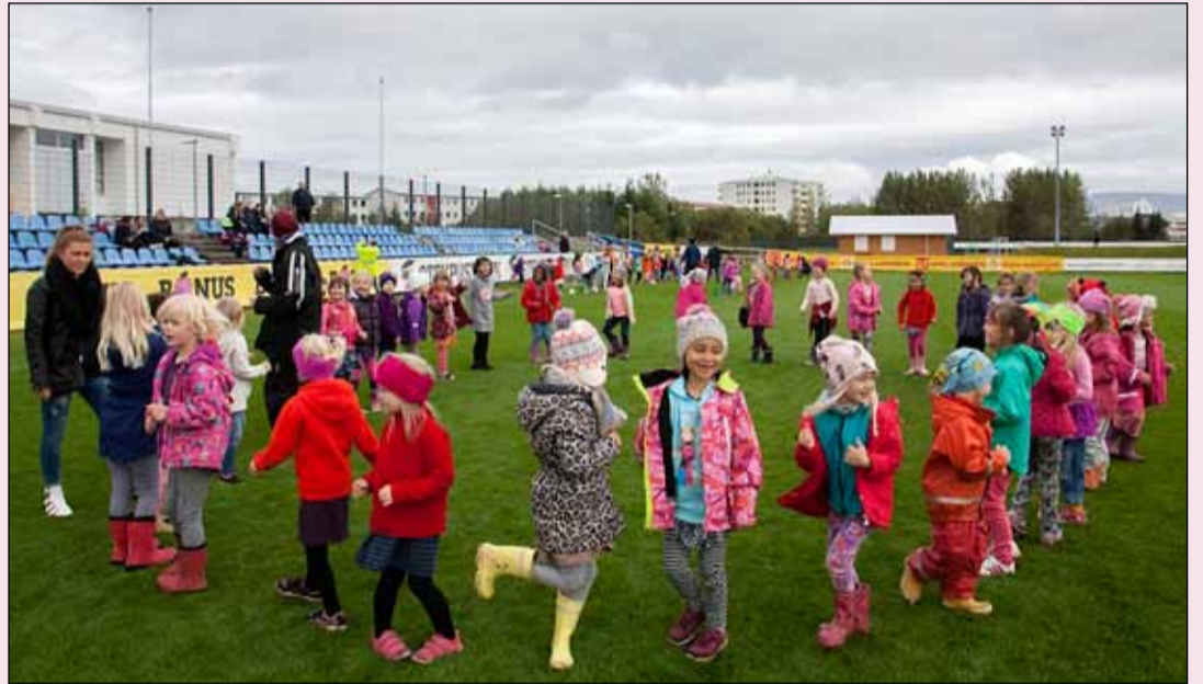
Hressir krakkar mætir á Leiknisvöllinn.

Athugið að námskeiðin eru í tvær vikur og er verðlagning mjög hófstíll í samanburði við mörg sambærileg námskeið sem eru í boði. Við hvetjum iðkendur af báðum kynjum til að skrá sig. Það er hægt að skrá iðkendur á vikunámskeið með því að hafa samband við skrifstofu Leiknis.