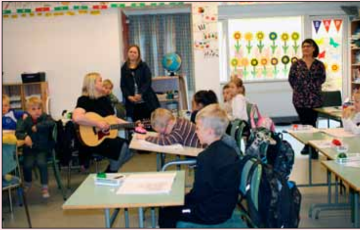
Stelpur í sjöunda bekk syngja við undirleik Elinrósar skólustjóra.

Leikskólakrakkar og verðandi 1. bekkingar komu á dögnum í heimsókn í fyrsta bekk Ölduselsskóla.