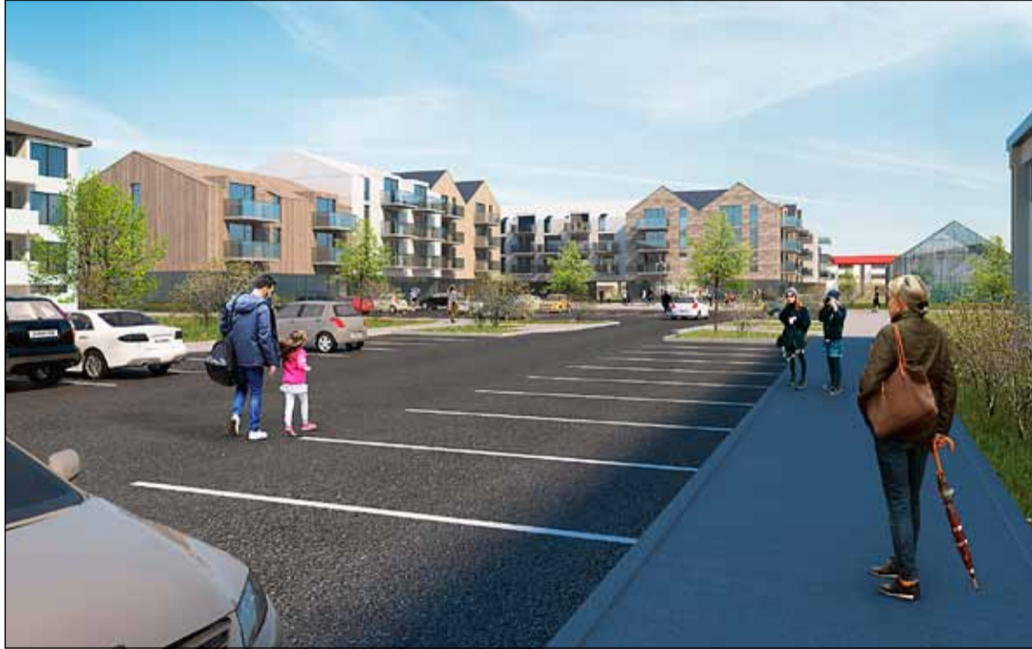
Hugmynd að nýju umhverfi við Arnarbakka í Bakkahverfi í neðra Breiðholti.

Uppbygging á atvinnuhúsnæði og námsmannaíbúðum við Arnarbakka styrkir grundvöll fjölbreyttrar verslunar í hverfinu. Ýmiss konar önnur atvinnustarfsemi er einnig heimiluð innan íbúðahverfa í Reykjavík til að styrkja nýsköpun og fjölga atvinnutækifærum innan hverfa. Samgöngur og þjónusta Neðra-Breiðholts er vel sett með verslun og þjónustu vegna nálægðar við Mjóddina. Þar er stefnt að uppbyggingu með atvinnuhúsnæði og nýjum íbúðum. Um er að ræða mjög umfangsmiklar breytingar sem ekki verða útfærðar í hverfisskipulagi heldur er Norður-Mjódd skilgreind sem þróunarsvæði og verður gert sérstakt deiliskipulag fyrir svæðið. Nærþjónusta fyrir hverfið er í kjarnanum við Arnarbakka en aðkoma, aðstaða og umhverfi verslunar- og þjónustukjarnans er bágborið. Fjarlægja á gömlu húsin og reisa nýjar byggingar með verslun og þjónustu. Með hverfisskipulaginu getur íbúðum í Neðra Breiðholti fjölgað um u.þ.b. 250. Einn af þeim ávinningnum sem felast í skipulaginu er að með tilkomu hverfisskipulags verður mun einfaldara fyrir íbúa að gera breytingar á fasteignum sínum. Til að mynda að byggja kvisti, svalir,