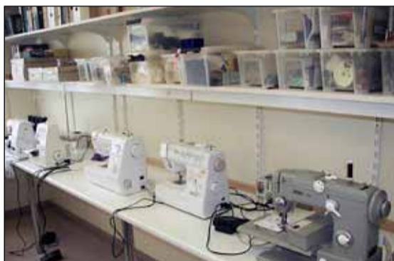
Saumavélar fyrir fólk sem langar að grípa í saumaskap eða bara að gera við buxurnar sínar.