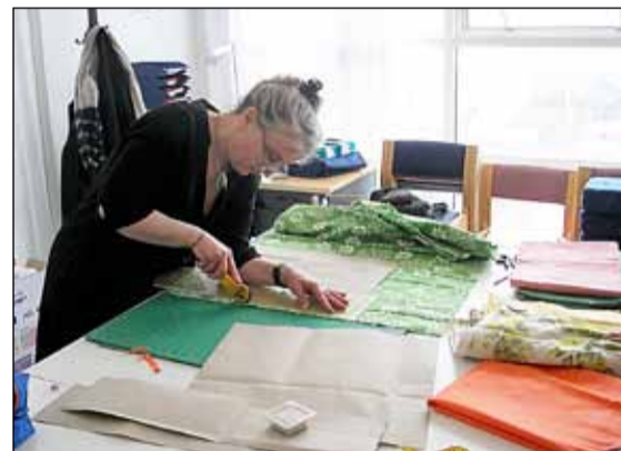
Boðið er upp á tie dye (batik) smiðju á Aflagrandu.