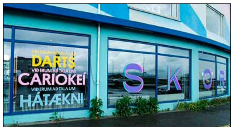
Pílubarinn Skor í JL-Húsinu við Hringbraut.