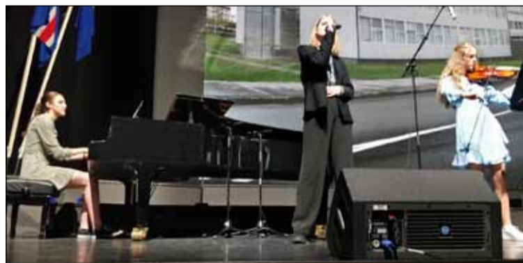
Nemendur flytja tónlist við skólaslit Hagaskóla.