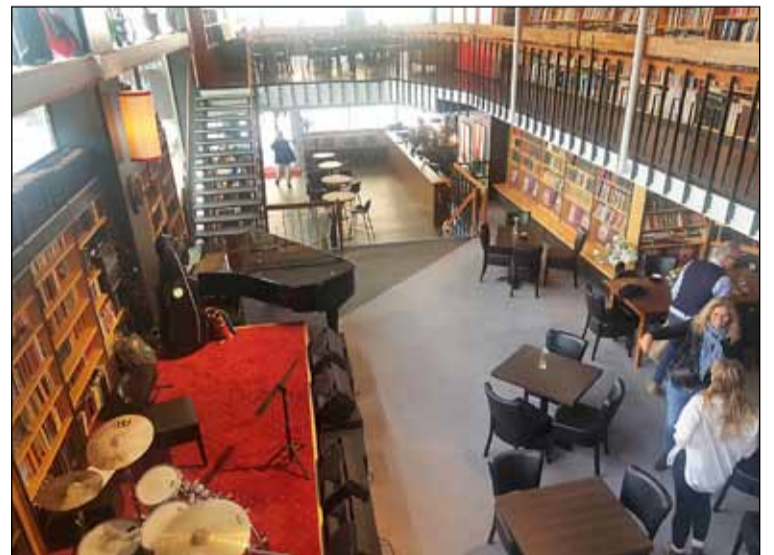
Séð af efri hæðinni yfir tónlistapallinn og veitingabær sem er í anddyri hússins.