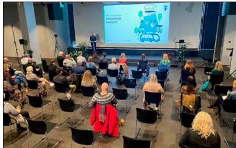
Frá fundi borgarstjóra um lýðheilsu.