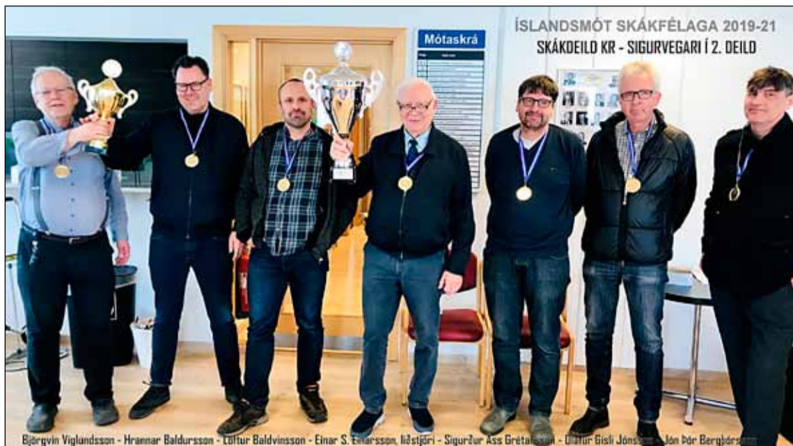
Skáksveit KR með verðlaunabikarinn.

Sveit Skákdeildar KR var sigursæl á nýafstöðnu Íslandsmóti skákfélaga. Deildakeppninni í skák, sem hófst haustið 2019 en lauk nýlega. Fresta varð síðustu þremur umferðum mótsins í á annað ár vegna kóvíð farsóttarinnar.