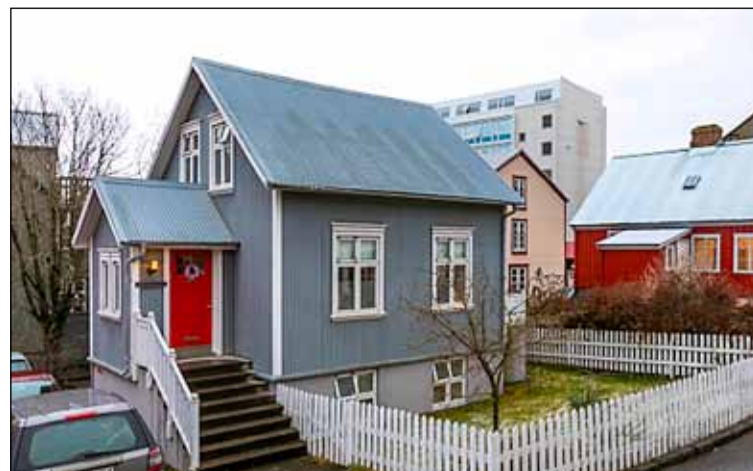
Yfir 100 ára gamalt og endurbyggt húsið í Grjótáporpinu.

Af fleiri húsum í Grjótáporpi er að taka sem eiga sér sögu en að þessu sinni verður látið nægja að nefna Gröndalshúsið. Sigurður