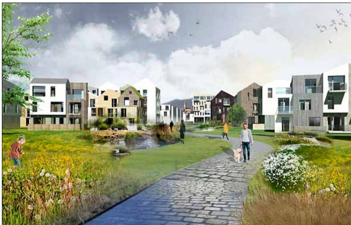
Þannig mun verða umhorfs í „nýja Skerjó“.

Nýtt skólahverfi verður sett upp í Skerjafirði fyrir nemendur í fyrsta til sjöunda bekk grunnskóla. Hverfið mun ná yfir stóra og litla Skerjafjörð suður og nýja íbúabyggð eða „nýja Skerjó“ í Skerjafirði.