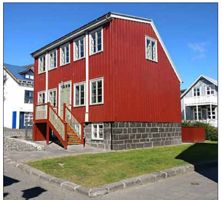
Gröndalshús nýuppgergt og komið á góðan stað í Grjótaþorpi.