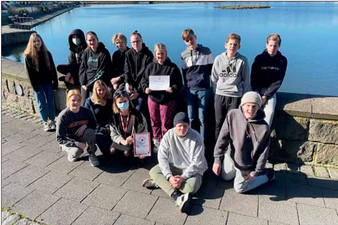
Tíundi bekkur Tjarnarskóla á tjarnarbakkanum þar sem afhendingin fór fram.

Tíundi bekkur Tjarnarskóla varð í þriðja sæti í Fjármálaleikunum á liðnum vetri. Krakkarnir unnu 100.000 krónur og ákváðu að styrkja Rauða Kross Íslands um 75.000 krónur til starfs með flóttafólki, sem Rauði krossinn á höfuðborgarsvæðinu stendur fyrir.