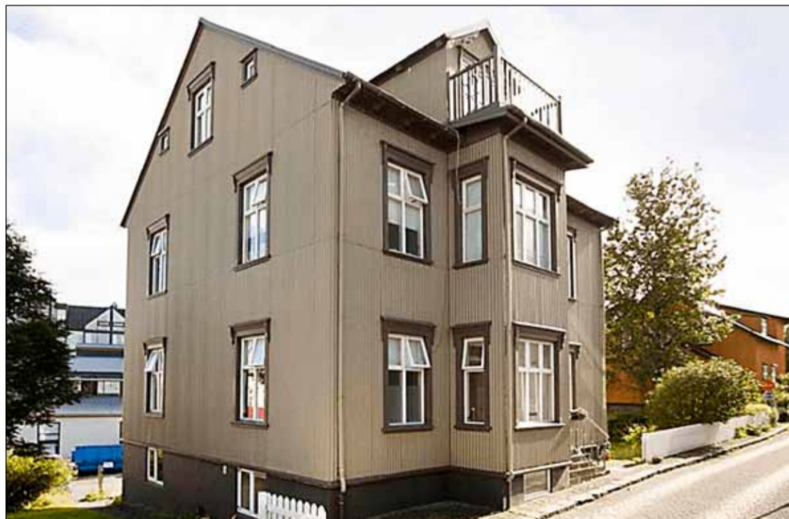
Vinaminni er reisulegt hús og þótti tilvalið til að hýsa starfsemi stórmenna og einnig skemmtanalíf.