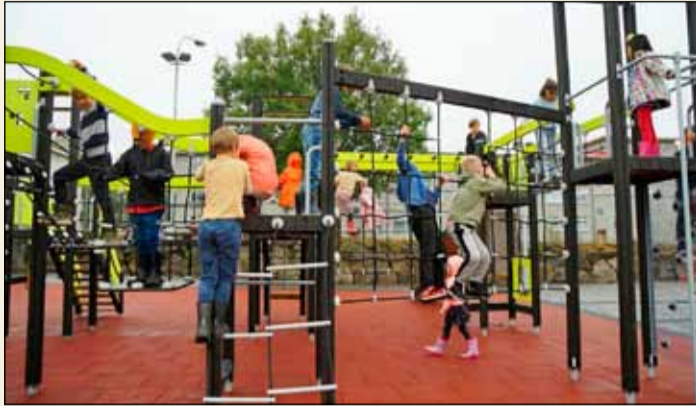
Leikið á lóð Vesturbæjarskóla.

Leggja á fótbolta- og körfuboltavöll á lóð Vesturbæjarskóla í sumar. Þegar vellirnir verða tilbúnir lýkur framkvæmdaferli sem hefur staðið yfir hjá skólanum um margra ára skeið og verður skólinn, með nýrri viðbyggingu, á með öðrum orðum að vera kominn í sína endanlegu mynd í bili.