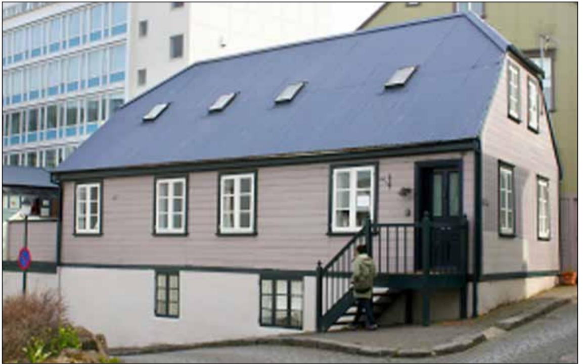
Norska bakarið er eitt myndarlegasta húsið í Grjótaþorpinu. Það hefur þó ekki alltaf lítið svona myndarlega út.

Íbúasamtök Grjótaþorps voru stofnum haustið 1975. Markmið þeirra var að vinna að viðhaldi og endurbótum á húsum í Grjótaþorpinu. Önnur markmið þeirra voru að standa vörð um gróður og umhverfi, og stuðla að manneskjulegri og lífvænlegri byggð fyrir fólk á öllum aldri. Einnig