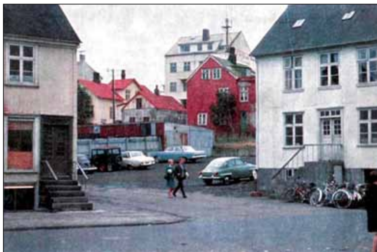
Sé inn í Grjótáporpið á sjöunda áratugnum.