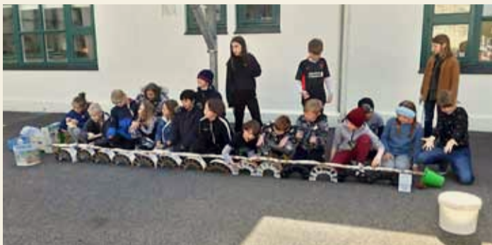
Fjóru bekkjar í Landakotsskóla.

Nemendur í 4. bekk í Landakotsskóla notuðu STEAM (vísindi, tækni, verkfræði, list og stærðfræði) við að læra mannkynssögu og að tengja sögu við byggingarlist og verkfræði undir leiðsögn Sinead.