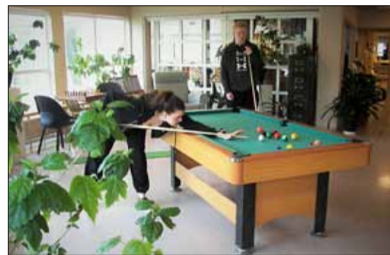
Allt af er eitthvað um að vera á Billanum fyrir unga sem eldri.