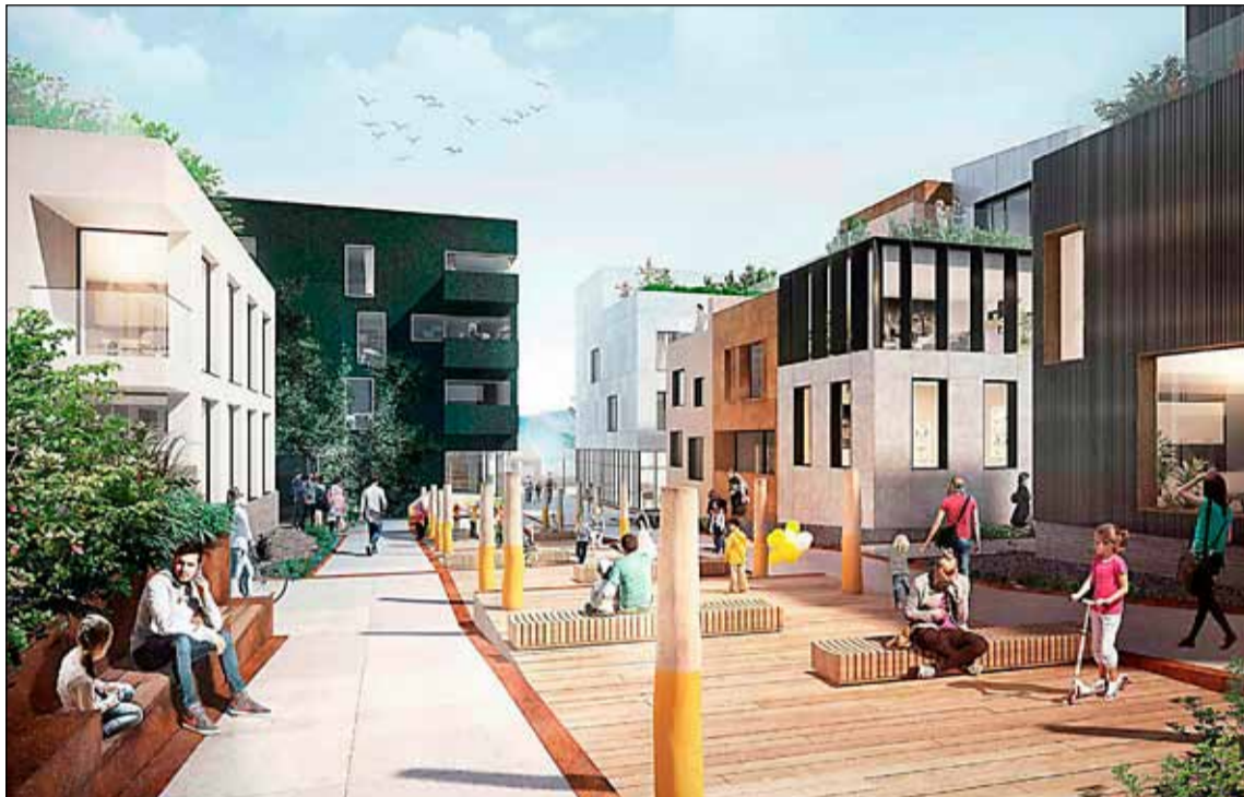
Hugmynd að nýju íbúðahverfi við Vesturbugt.

Fasteignapróunarfélagið Kaldalón hyggst hefja uppbyggingu í Vesturbugt í Reykjavík fljótlega eða um næstu áramót. Gert er ráð fyrir að byggja 192 íbúðir og atvinnuhúsnaði. Tillaga að breyttu deiliskipulagi svæðisins hefur verið samþykkt til auglýsingar en með því fjölga áformuðum íbúðum um 15 til 20.