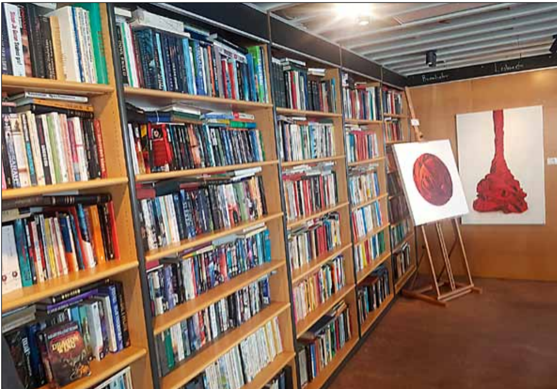
Bækur og listaverk prýða bekkni menningarhússins.