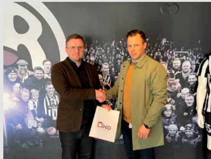
Forráðamenn KR og Fasteignasölnunnar Lindar handsala samstarfssamninginn.

Fasteignasalan Lind hefur gert samstarfssamning við KR um styrk. Styrkveitingin virkar þannig fólk getur skráð sig á www.fastlind.is/KR og þá fer 100.000 krónur til KR þegar eignin selst. Félögin Breiðablik og HK hafa þegar gert sambærilega samninga við Lind.