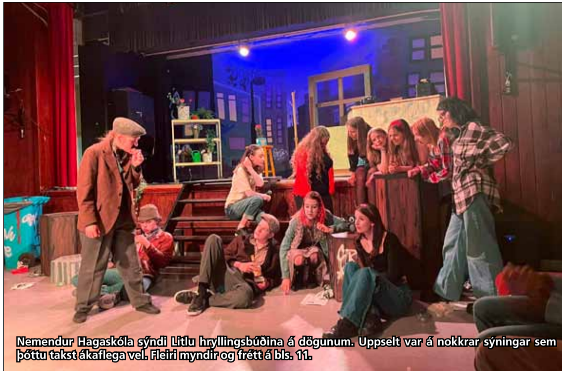
Nemendur Hagaskóla sýndi Litlu hryllingsbúðina á dögnum. Uppselt var á nokkrar sýningar sem þóttu takst ákaflega vel. Fleiri myndir og frétt á bls. 11.

- bls. 4-5 Menningarhús opnað á Laugavegi 18