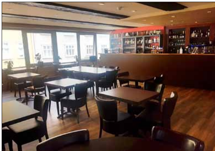
Gamla kaffihúsið á efri hæð í norður hluta hússins hefur gengið í endurnýjum lífdaga. Þar hafa margir drukkið kaffisopann sinn og átt samræður af ýmsu tagi.