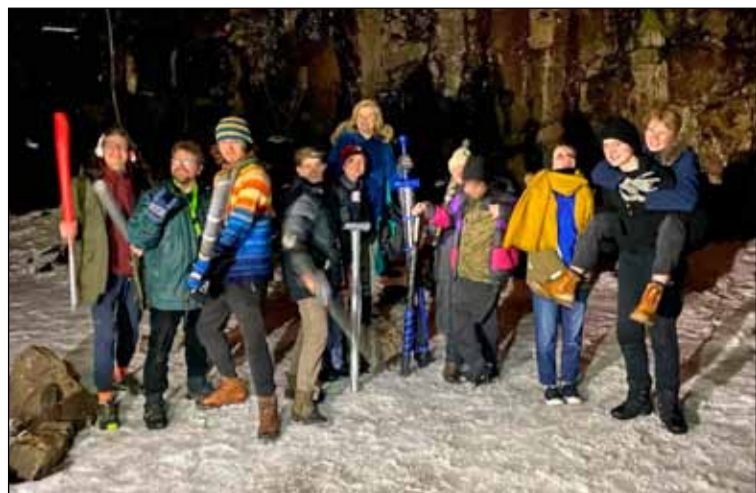
Larp-bardagahópurinn í Öskjuhlíðinni á dögnum.