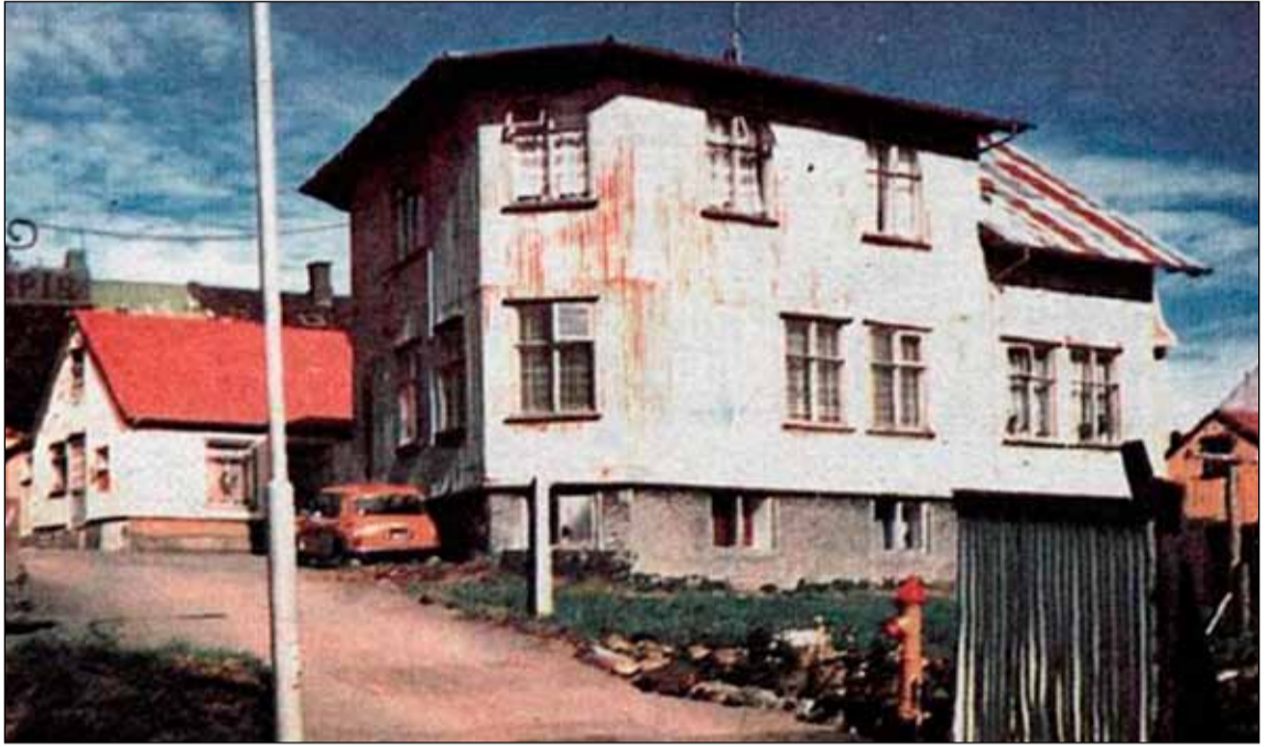
Brattagata í Grjótaþorpi um 1978 í Grjótaþorpinu rúnum einum og hálfum áratug eftir að danska skipulagið kom fram. Hvort áhrifa þess gætir þarna enn skal látið ósagt en myndin sýnir glögg hversu ótrúlega hrörleg gamla byggðin í Reykjavík var á þessum tíma. Svo virðist sem talið væri víst að gömul hús grotnuðu endanlega niður eða yrðu eldi að bráð. Spyrja má um afstöðu borgaryfirvalda til þessarar þróunar.

Dæmi um þá hugmyndafræði sem ríkti við gerða þessa skipulags má nefna hugmynd um braut sem átti að liggja um miðbæinn. Þetta átti samkvæmt skipulaginu að vera ein samfelld braut frá Túngötu yfir á Grettisgötu. Breikka átti Túngötuna út á Landakotstúnið og einnig þegar hún nálgast miðbæinn í gegnum Grjótaþorp. Þá átti að breikka þessa braut þar sem hún átti að liggja um Kirkjustræti fyrir framan Alþingishúsið. Fara átti í gegnum reitinn fram hjá Hótel Borg, breikka Amtmannsstíginn og