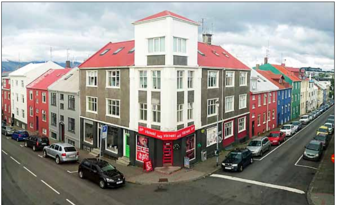
Þetta hús stendur á horni Grettisgötu og Barónsstígs. Danska skipulagið gerði ráð fyrir breikkun Grettisgötu og að öll hús öðru megin hennar yrðu rífin.

framlengja götuna til austurs. Þaðan átti þessi leið að liggja þvert yfir Skólavörðuholtið þar sem Hegningarhúsið er og átti að rífa það. Breikka átti Grettisgötuna og til þess að það væri hægt átti að rífa öll hús öðru megin við götuna.