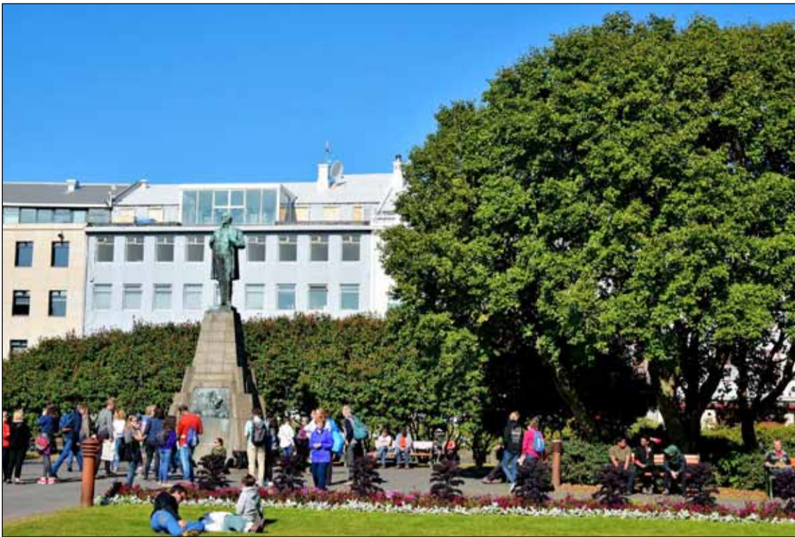
Ekkert átti að vera ósnortið. Breikka götuna um Kirkjustræti fyrir framan Alþingishúsið, fara í gegnum reitinn fram hjá Hótel Borg, breikka Amtmannsstíginn og framlengja götuna til austurs.

miðbæjarsvæðinu í Kvosinni í Reykjavík. Hefði danska skipulagið orðið að veruleika væri miðbærinn og jafnvel mun stærri svæði orðið allt önnur en sjá má í dag. Stórar umferðargötur og lítið pláss fyrir gangandi vegfarendur væri raunin og stemningin í kringum miðbæinn allt önnur en eins og við þekkjum hana. Vissulega heyrast ýmsar raddir í samfélaginu um að gatnakerfið sem höfuðborgin státar af í dag sé hvergi nærri nógu stórt, en þrátt fyrir gríðarlega fjölgun bíla