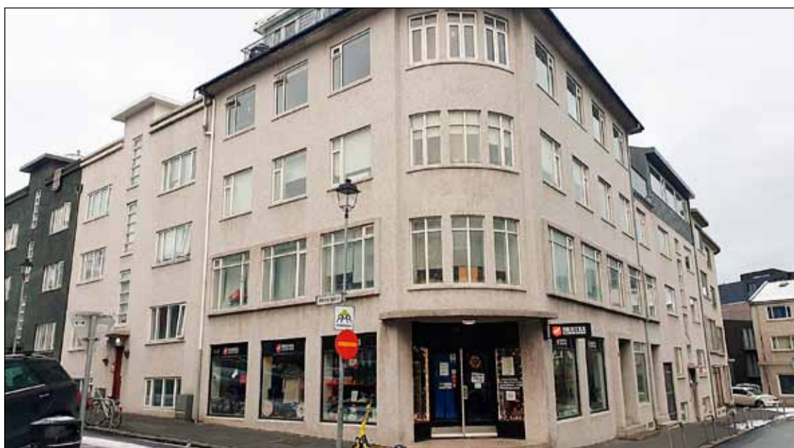
Garðastræti 6 þar sem gengið var inn í nytjamaðinn. Þar má búast við veitingum og listmunum í framtíðinni.