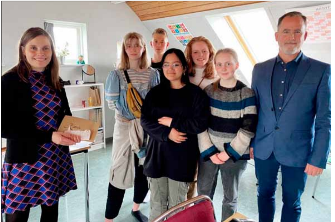
Katrín Jakobsdóttir með nemendum Landakotsskóla.

Katrín Jakobsdóttir forsætisráðherra heimsótti Landakotsskóla á vordögum þar sem unnið er með einbeitingu og handverk. Forsætisráðherra hefur tæplega leiðst í heimsókninni ef marka má frásögn hennar sem skráð hefur verið á heimasíðu skólans.