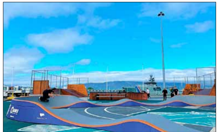
Nýja hjólabrautin á Miðbakka.

ekki er beint treyst á pedalana eða sparkhreyfingar á svona braut heldur er ekki síður treyst á