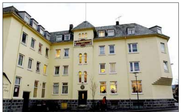
Gamli Herkastalinn við Kirkjustræti.