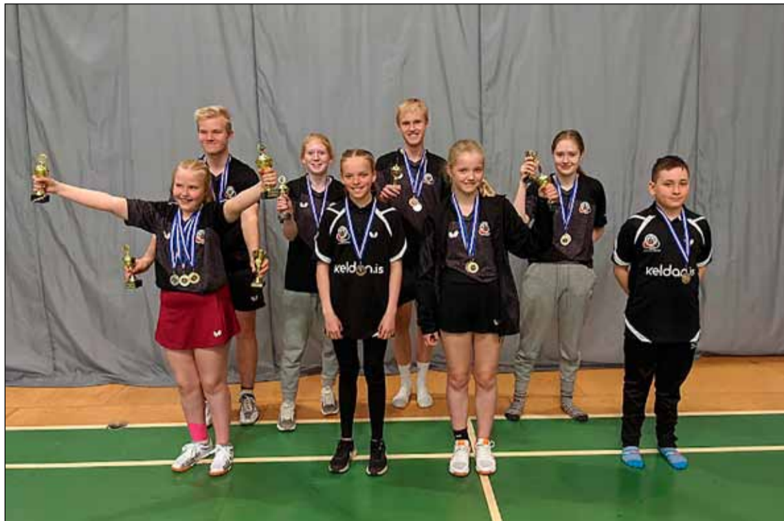
Ánægðir verðlaunahafar frá Borðtennisdeild KR.

KR vann flesta Íslandsmeistararitla og flest verðlaun allra félaga á Íslandsmótum í borðtenniskeppnistímabilið 2020 til 2021 eða 11 talsins.