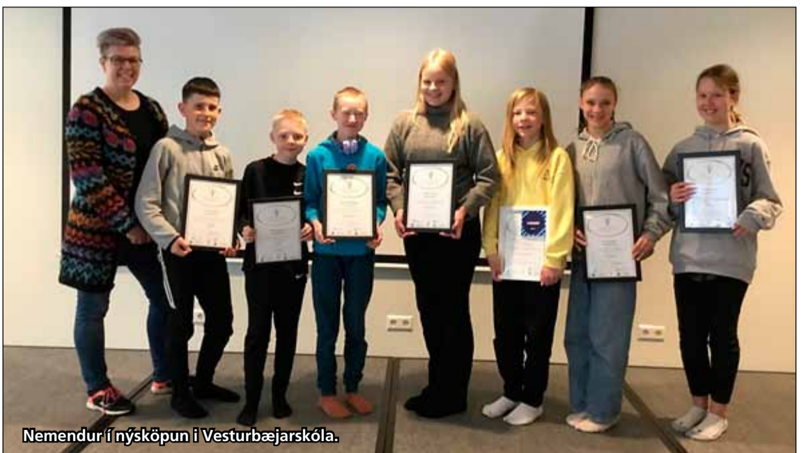
Nemendur í nýsköpun í Vesturbæjarskóla.

Fjórar hugmyndir úr Vesturbæjarskóla voru valdar í nýsköpunarkeppni Grunnskólanna. Á liðnum vetri undirbjuggu nemendur í fimmta og sjötta bekk í Vesturbæjarskóla sig fyrir þátttöku í Nýsköpunarkeppni grunnskólanna eða NKG. Nemendur sóttu tíma í Nýsköpun og undir leiðsögn fengið að spreyta sig í að hanna hluti, nýja ferla og hugmyndir. Hugmyndir nemenda eru sendar í Nýsköpunarkeppni grunnskólanna.