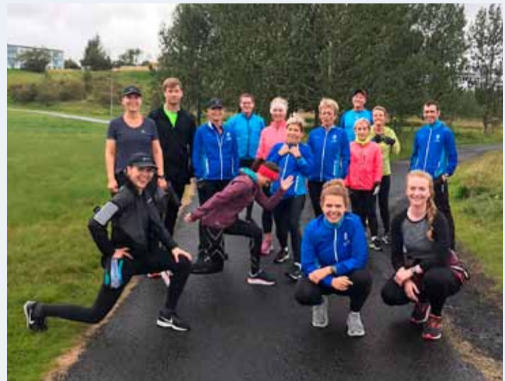
Skokkhópurinn ÍR Skokk.