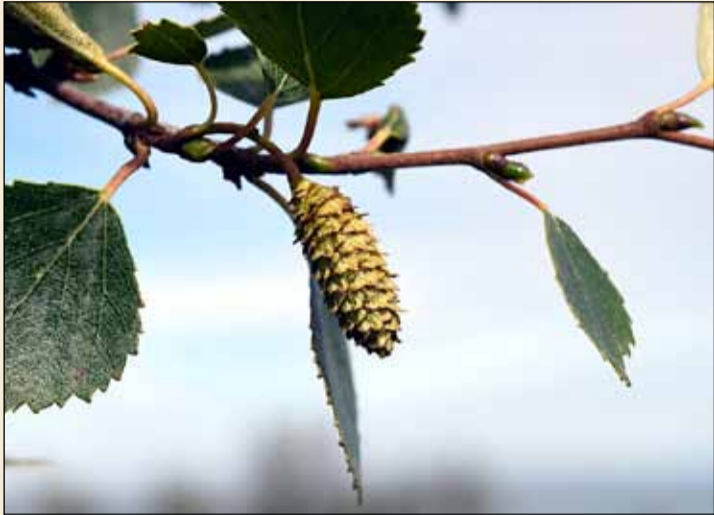
Fullproskað birkifræ á grein.

Nú stendur yfir átaki í því að útbreiða á ný birkiskóglendi hér á landi. Á rýru landi er gjarnan kolefnislosun því þar er gamall jarðvegur enn að rotna. Ef landið klæðist birkiskógi stöðvast þessi losun og binding hefst í staðinn. Svona verkefni eru því líka loftslagsverkefni. Birkið er frumherjategund sem sáir sér mikið út á eigin spýtur ef hún fær til þess frið. Birkið heldur því starfinu áfram ef vel tekst til að koma því af stað á nýjum svæðum.