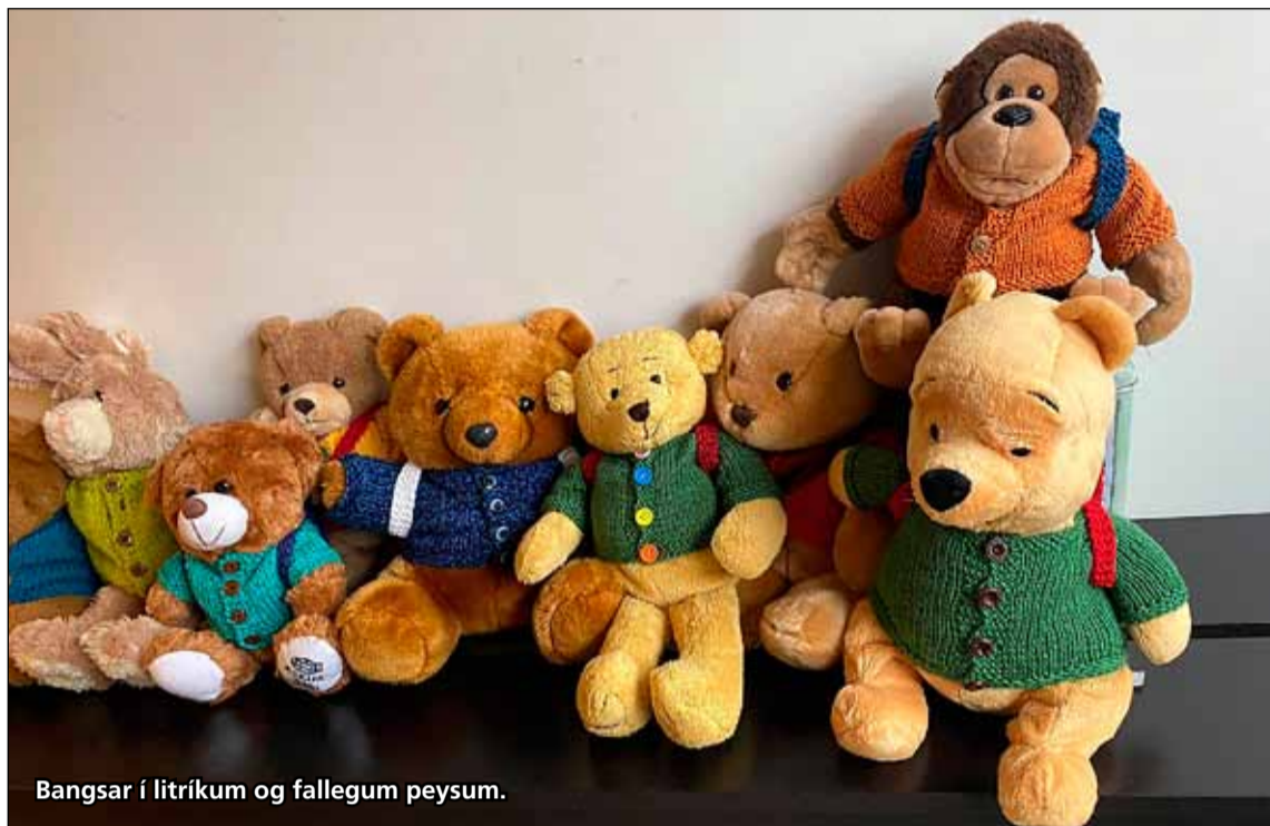
Bangsar í litríkum og fallegum peysum.

Nú þegar september er genginn í garð og skólastarfi hefst að nýju eru grunnskólanemendur fullir eftirvæntingar að mæta í skólann sinn eftir sumarfrí. Það þýðir að einnig er að færast líf í starfið á frístundaheimilum í Breiðholti eftir gott sumar og líf okkar allra að færast í fastar skorður.