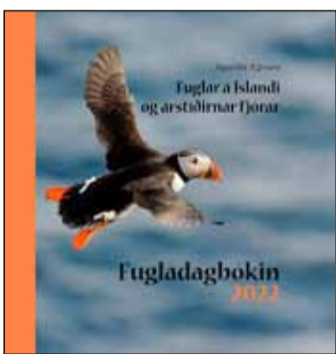
Fótoltaspurningar og Fugladagbókin eru athyglisverðar bækur frá Hólum.