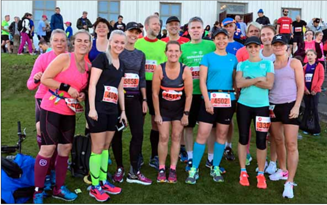
Þetta er skokkhópurinn og hugmyndin er að hinn nýi hlaupahópur fari í samvinnu við hann.