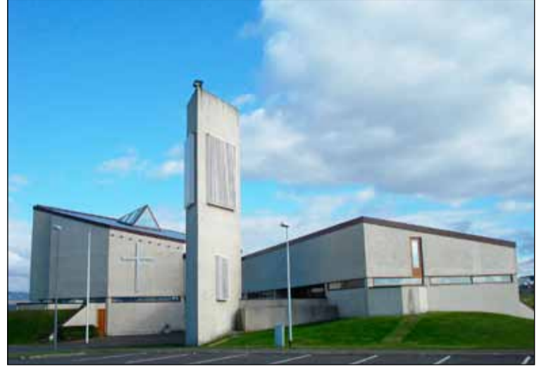
Fjölbreytt dagskrá er í Fella- og Hólakirkju í vetur.

Listasmiðjan Litróf hefur göngu sína á nýjan leik eftir nokkra ára hlé. Um er að ræða starf fyrir börn í 4. til 7. bekk þar sem áherslan er fyrst og fremst á listrænar greinar líkt og dans, leiklist, söng, myndbandsgerð og fleira. Ásamt því verður farið í fullt af skemmtilegum leikjum. Sem dæmi um dagskrárefni má nefna TikTok danssýningu,