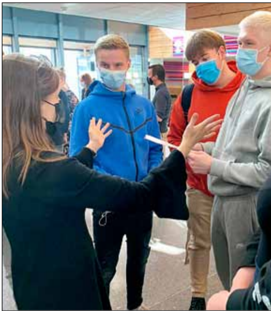
Katrín Jakobsdóttir forsætisráðherra ræðir við nemendur.