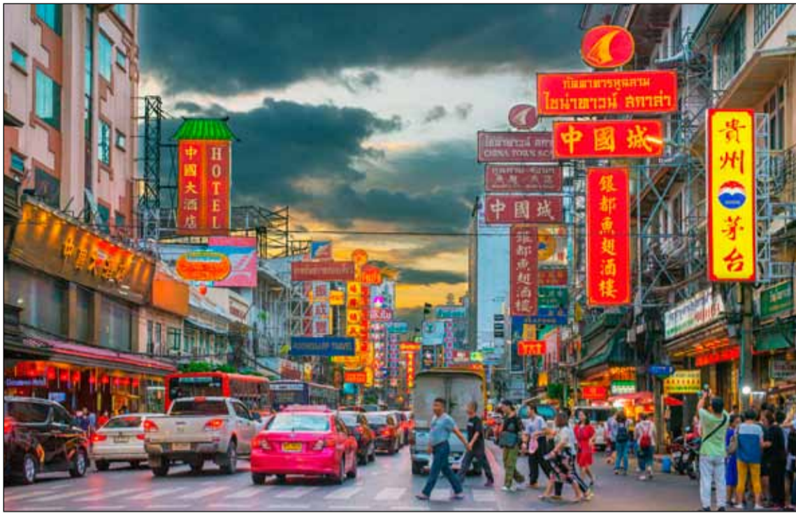
Frá Bangkok í Taílandi

en ekki fréttirnar sínar í gegnum samfélagsmiðla, og þá sérstaklega Facebook. Þannig vita þau hvað er í gangi á Íslandi. „Þess vegna nota ég Facebook mjög mikið til að ná til fólks og einnig til að fá þau til að taka kannanir.“