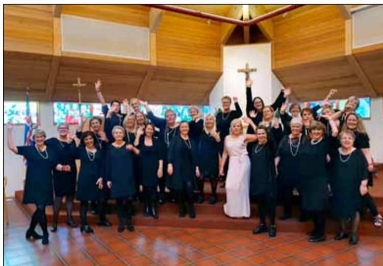
Kvennakórinn Seljurnar að loknum tónleikum í Seljakirkju.