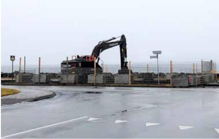
Stórvirk vinnuvél að störfum við fráveituna.

Eins og áður hefur verið kynnt standa yfir umfangsmiklar framkvæmdir og endurbætur á fráveitu Seltjarnarnesbæjar. Endurbæturnar í heild sinni hafa staðið yfir í nokkur ár og er gert ráð fyrir því að þeim muni ljúka um áramótin.