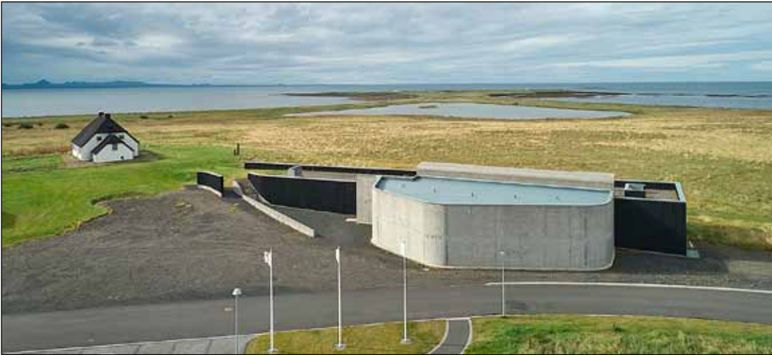
Hús Náttúruminjasafnsins. Til vinstri sést Nesstofa sem er í næsta nágrenni.

í kjallara og á jarðhæð og færslu votrýma auk betri loftræstingar þar. „Hönnun hússins er frá árinu 2007 og hana þarf að endurskoða með tilliti til þarfa. Náttúruminjasafnsins. Við það tækifæri verða þeir verkþættir rýndir sem á eftir að framkvæmda og teikningar af innra skipulagi endurskoðaðar frá grunni.