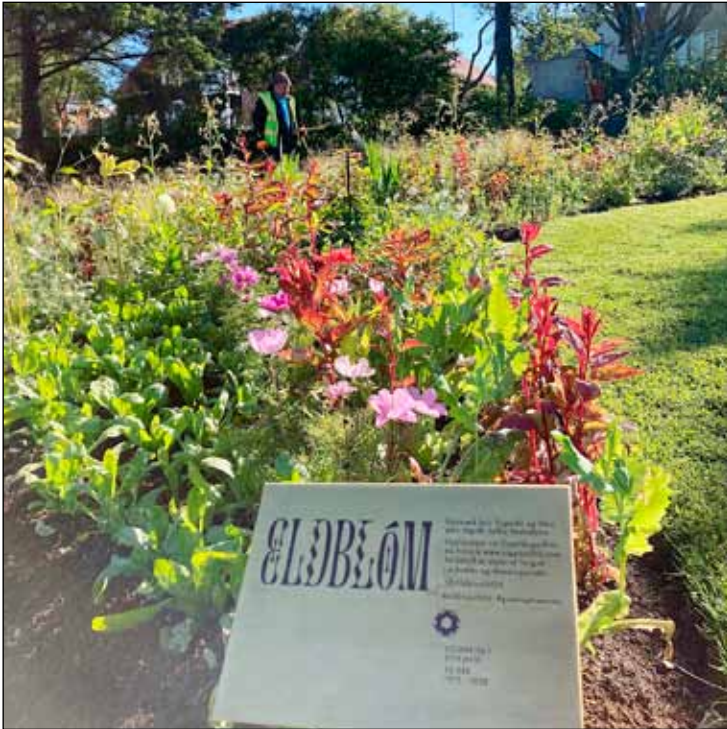
Frá sýningunni eldblóm.

Algengustu flugelda-effectar í dag eru blóm og tré af asískum uppruna, blóm sem margir hafa ræktað í mörg