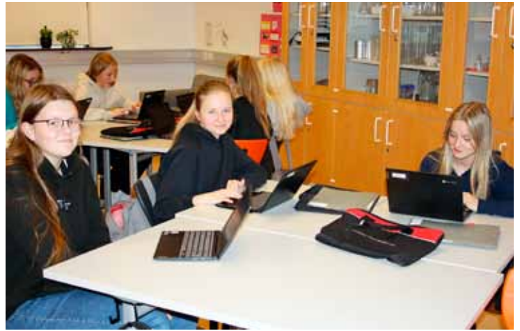
Þessar stúlkur eru greinileg ánægðar með nýju tölvurnar sínar.

Norðurströndinni og mun hún ná alla leið að dælustöð Veitna við Seilugranda. Þessa dagana er unnið að endurnýjun dælustöðvarinnar fyrir fráveitu við Norðurströnd og Lindarbraut en dælustöðin mun sjá um að skila skólpinu til hreinsistöðvanna við Ánanaust. Beðist er velvirðingar á þeim óþægindum sem þetta kann að valda.