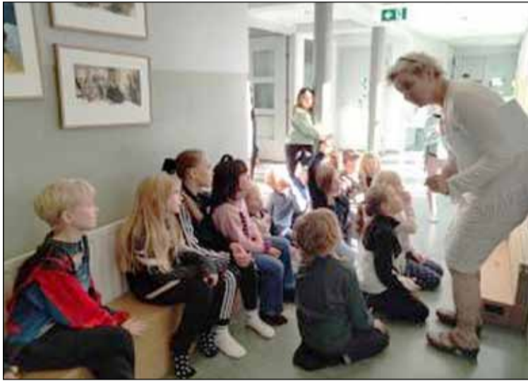
Myndir og börn í Landakotsskóla.

Í stað þess að fara á safn og skoða sýningu í eitt skipti, dvelja nemendur með listaverkunum um lengra skeið og fá tækifæri til að skoða og skynja verkin bæði beint og óbeint. Leiðsögn og samræða um sýningarnar er hluti af náminu en líka persónuleg tenging hvers og eins við ólík verk, ólík tjáningarform. Á sýningartímanum munu listamennirnir heimsækja skólann og vinna með ákveðnum nemendahópum. Í gegnum samræðu útskýra þeir vinnubrögð sín og aðferðir, segja frá því hvernig þeir búa til persónur,