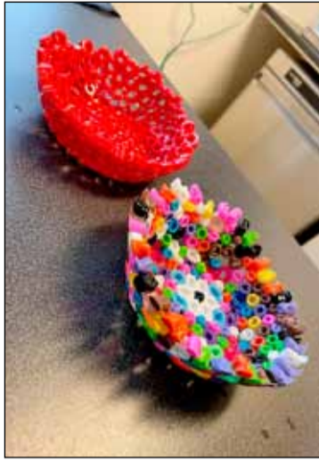
Hlutir byggðir á hugmyndum krakka í Frostheimum.