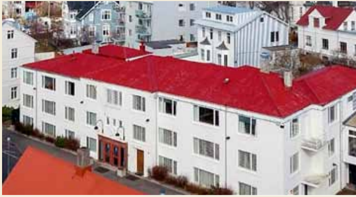
Fyrrum húsnæði sendiráðs Bandaríkjanna við Laufásveg.