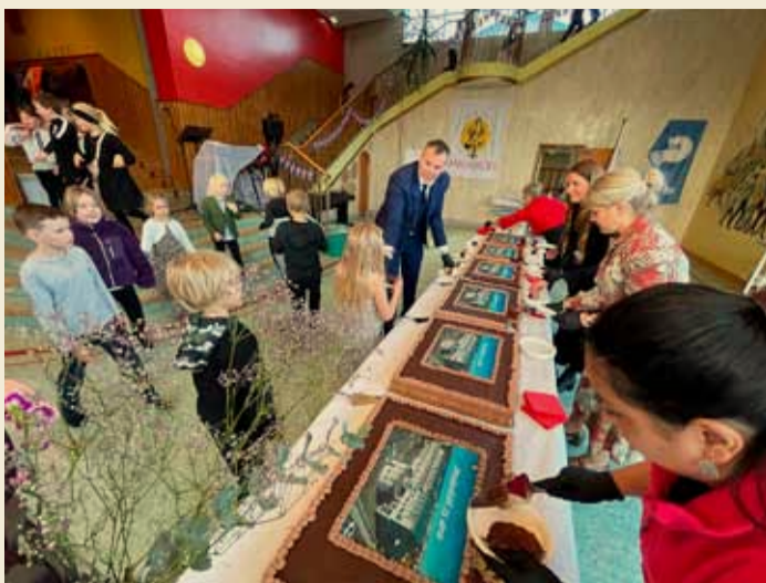
Frá 75 ára afmæli Melaskóla.