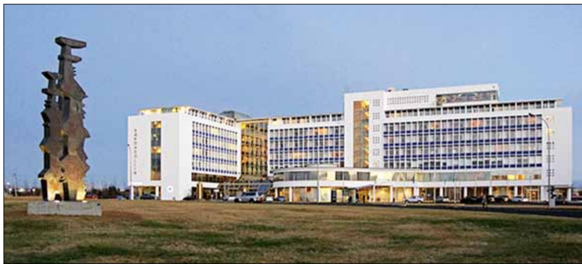
Bændahöllin við Hagatorg er með glæsilegri húseignum í Reykjavík.

1982 og lauk 1985. Bændahöllin er um 20.000 fermetrar að stærð og þar voru 236 hótelherbergi á vegum Hótel Sögu.