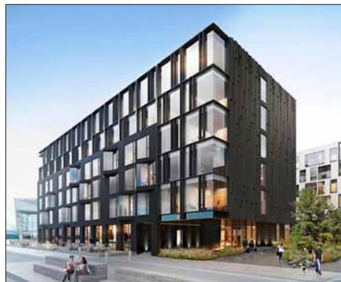
Reykjavík Edition hótelið við Austurhöfn.

Hótelið er hluti af nýrri lúxuskeðju á vegum Marriott International og er hugsað sem ráðstefnuhótél fyrir Hörpu. Það er um 17.000 fermetrar að stærð á sex hæðum og kjallara og má þar meðal annars finna veitingastað, þakbar, fundarherbergi, veislusal, heilsulind og önnur þægindi. Upphaflega var gert ráð fyrir að kostnaður við bygginguna næmi um 16 milljörðum króna en hann hefur aukist umtalsvert á verktímabilinu. Á meðal stærstu fjárfesta í verkefninu eru íslenskir lífeyrissjóðir, auk nokkurra einstaklinga og fasteignapróunarfélagsins Carpenter & Company.