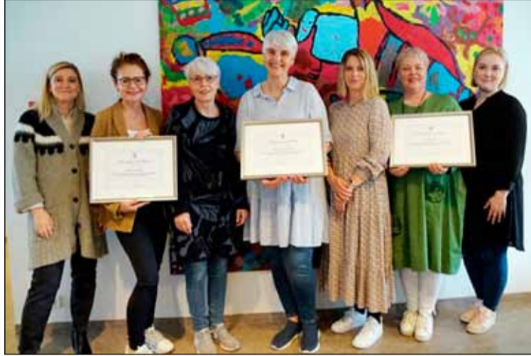
Fimm tilnefningar til Íslensku menntaverðlaunanna komu í hlut reykvískra kennara og skóla- og frístundastarfs.