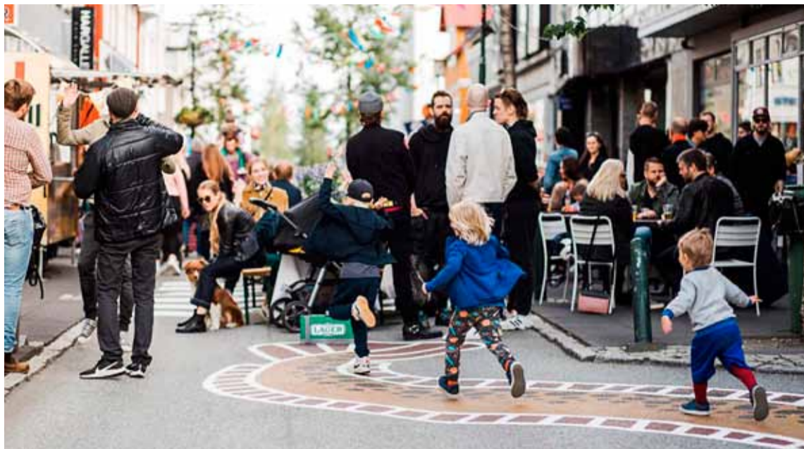
Frá Laugavegi göngugötu í Miðborg Reykjavíkur.

Ánægja með göngugötur í Miðborginni hefur aukist á milli ára. Nú er svo komið að mikill meirihluti Reykvíkinga er jákvæður í garð göngugatna. Jákvæðir eru fleiri en neikvæðir í öllum hverfum borgarinnar. Hátt í þriðjungur telur að göngugötusvæðið sé of lítið. Þetta kemur fram í nýlegri könnun Maskínu fyrir Reykjavíkurborg.