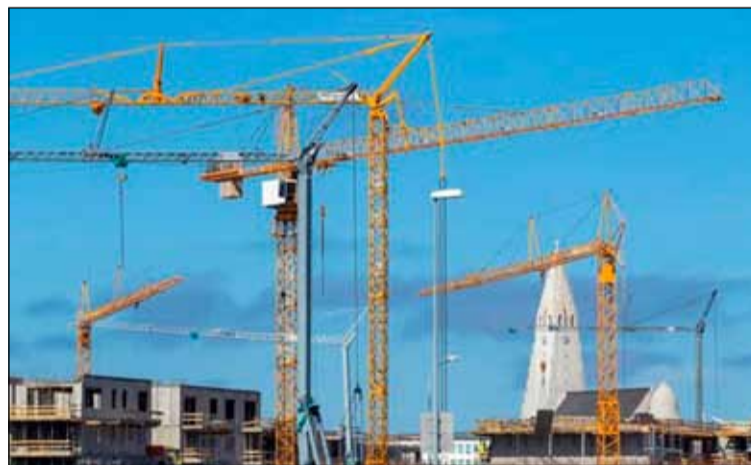
Byggingakranar hafa einkennt Hlíðarendasvæðið. Gangi hugmyndir um breytt skipulag eftir munu þeir ekki hverfa á næstunni.

Tveir reitanna sem um ræðir voru áður ætlaðir undir atvinnuhúsnæði, þar á meðal hótél, og sá þriðji var skilgreindur sem opið svæði, til bráðabirgða. Fulltrúar Viðreisnar, Samfylkingarinnar og Pírata lögðu fram bókun þar sem fram kom að gert sé ráð fyrir að 20% íbúðanna verði leigu- eða búseturéttaríbúðir. Þá skulu Félagsbústaðir eiga forkaupsrétt á 5% íbúðanna. Deiliskipulagið er lagað að bíla- og hjólastæðastefnu borgarinnar þar sem öll