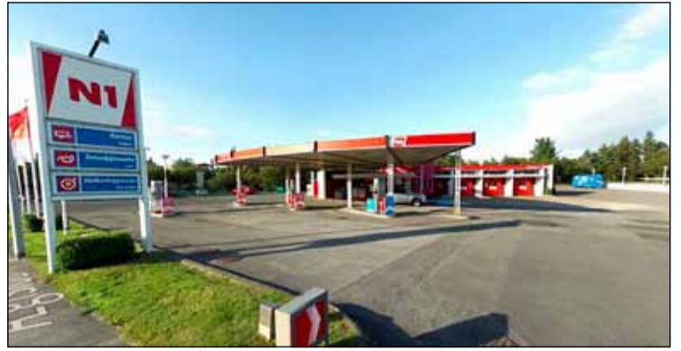
Þjónustustöð N1 við Ægisíðu sem á að víkja fyrir íbúðabyggð.

Í breytingum á aðalskipulagi Reykjavíkurborgar fram til ársins 2040 er verið að gera ýmsar breytingar á stefnu borgarinnar um íbúðabyggð og skilgreina nýja reiti, marga hverja inni í grónum hverfum, sem uppbyggingarreiti. Nágrönnum við Ægisíðu 102 list illa á áformin sem borgin hefur sett fram um viðmið uppbyggingar á reitnum. Þeir óttast að lóðarhafinn Festi hf. muni láta skipuleggja þar íbúðabyggð sem rími illa við umhverfi reitsins, til að ná fram hámarki arðsemi byggingarreitsins. Einkum eru það hugmyndir um allt að fimm hæða