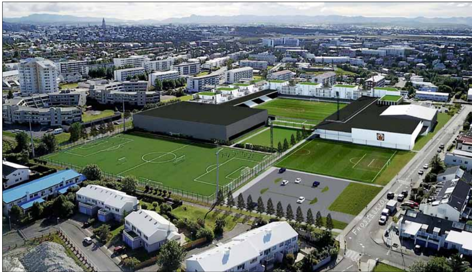
KR svæði framtíðarinnar séð frá Keilugranda.