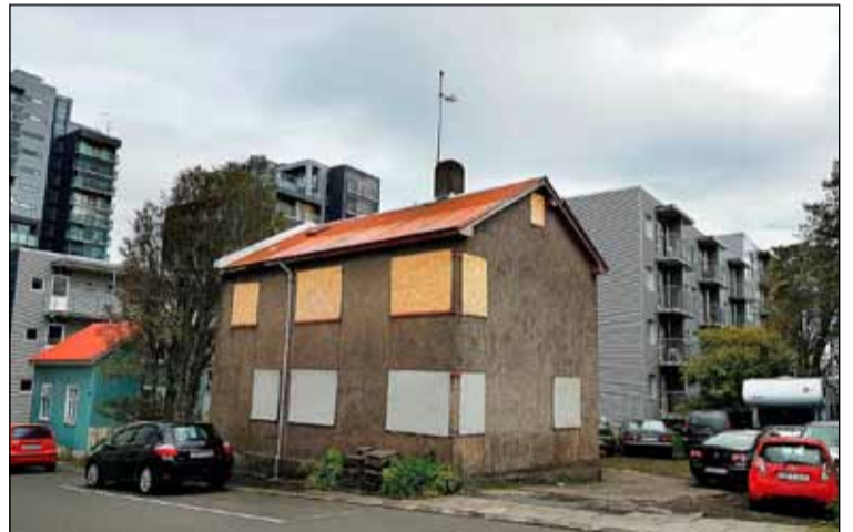
Áformað er að rífa húsið við Vatnsstíg 10 en það er talið ónytt.

Í breytingunni felst að heimilt verði að fjarlægja hús á lóð nr. 10 við Vatnsstíg og 44 við Lindargötu, breyta lóðamörkum lóðanna nr. 12 og 12A við Vatnsstíg, sameina lóðina nr. 44 við Lindargötu við lóðirnar nr. 40, 42 og 46 við Lindargötu. Ennfremur að byggja nýtt þriggja hæða hús á lóð nr. 44 við Lindargötu, reisa tveggja hæða hús ásamt risi á lóðunum nr. 12 og 12A við Vatnsstíg. Á fundi skipulags- og samgönguráðs borgarinnar 29. september sl. var lögð fram umsókn Félagstofnunar stúdenta varðandi þessar framkvæmdir. Samþykkt var að auglýsa framlagða tillögu með fjórum atkvæðum fulltrúa Viðreisnar, Samfylkingarinnar og Pírata. Fulltrúar Sjálfstæðisflokksins sátu hjá við afgreiðslu málsins. Þeir