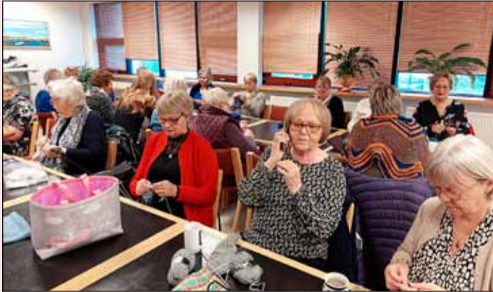
Prjónadót og glaðværar konur í Gerðubergi.