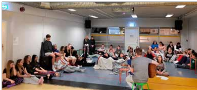
Náttfatapartý í einni af félagsmiðstöðvum Breiðholts.

Helgina 12. til 14. nóvember er Landsmót Samfés sem unglingar á landsvísi fá tækifæri til að skiptast á hugmyndum, taka þátt í allskonar smíðjum og kynna mismunandi kúltúr. Við í félagsmiðstöðvunum Breiðholti erum að fylgja um fjórtán