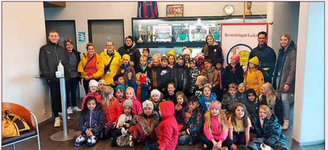
Skólabörn úr Fellaskóla og Hólabrekkuskóla í heimsókn hjá Leikni.

af hressum og frambærilegum krökkum og þakkar Leiknir fyrir þessa skemmtilegu heimsókn.