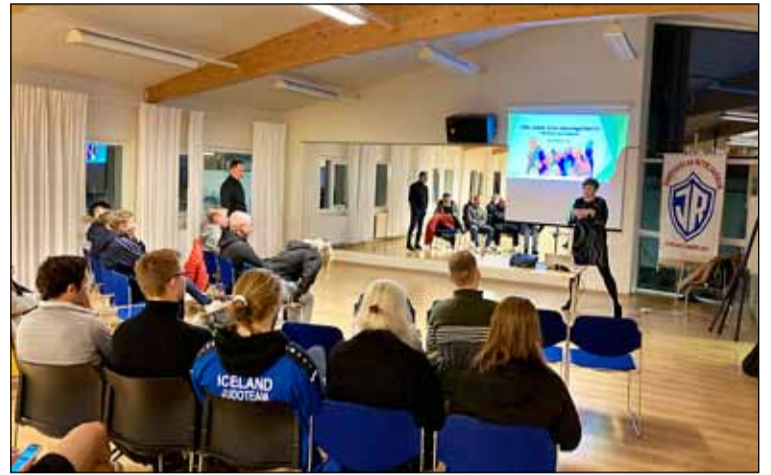
Frá kynningu á lýðheilsustefnu Reykjavíkur.

Samhliða samþykkt lýðheilsustefnunnar var samþykkt aðgerðaráætlun fyrir stefnuna til næstu þriggja ára. Meðal þess sem þar kemur fram er stofnsetning