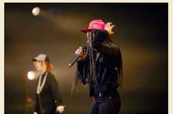
Úr atriði Fellaskóla Hvað er að gerast.

Í ár tóku 23 skólar þátt í undanúrslitum og átta komust áfram í úrslit. Atriðin að þessu sinni fjölluðu m.a. um líkamsmynd, mikilvægi tónlistar fyrir lífsgleðina, kynferðisofbeldi, Covid ástandið, svefnleysi, ólíka tjáningarmáta og staðalmyndir kynjanna. Unglingarnir nýta allar sviðslistir í atriðin; söng, dans, leiklist og gjörninga. Þau sjá um að semja atriðin, leik, dans, sögu, söng og sumir eru með frumsamin lög. Krakkarnir sjá líka um tæknihljóða, búninga og smink.