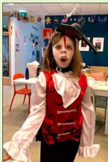
Þessar skemmtilegu myndir voru teknar á hrekkjavöku í Hellinum.