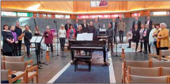
Kór Fella- og Hólakirkju að hefja tónleika.

Í desember-kófinu fyrir tæpu ári, ákvað Kór Fella- og hólakirkju að sitja eigi með hendur í skauti heldur gleðja vini á Facebook með margskonar jólatónlist. Hvern dag frá 1. desember til jóla gaf kórinn út nýtt tónlistaratriði á Facebook-síðu Kórs Fella- og hólakirkju.