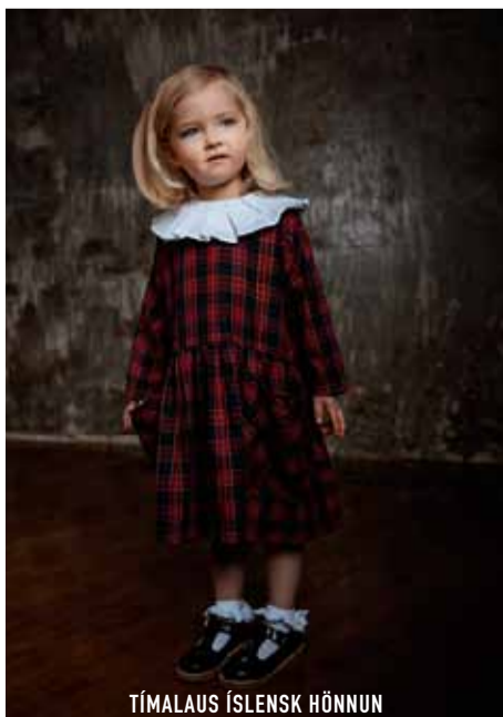
TÍMALAUS ÍSLENSK HÖNNUN