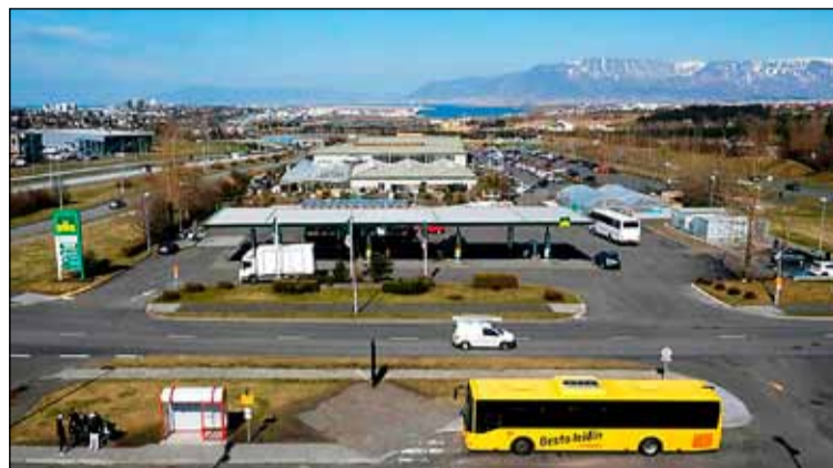
Garðheimareitir í Norður Mjódd. Þar er áætlað að byggja íbúðahverfi í framtíðinni.

Í fyrsta skipulagi af Norður Mjódd frá 1962 til 1983 var gert ráð fyrir að þar yrði óbyggð útivistarsvæði hugsað til þess að tryggja íbúum í Neðsta hluta elsta Breiðholtshverfisins útsýni. Í grenndarkynningu fyrir Norður Mjódd frá 1974 má finna fyrstu teikningar um nýtingu þessa svæðis undir byggingar. Þar kom meðal annars fram að í Norður Mjóddinni yrði komið fyrir lágum byggingum, sem myndu ekki trufla útsýni úr neðstu húsum Stekkjarhverfis. Um svipað leyti hafði Olís fengið vilýrði hjá Reykjavíkurborg til að flytja bensínstöð sína sem þá stóð sunnan Álfabakka yfir götuna og verða syðst í Norður Mjódd þar sem hún er nú. Þá voru komnar fram hugmyndir um að reisa