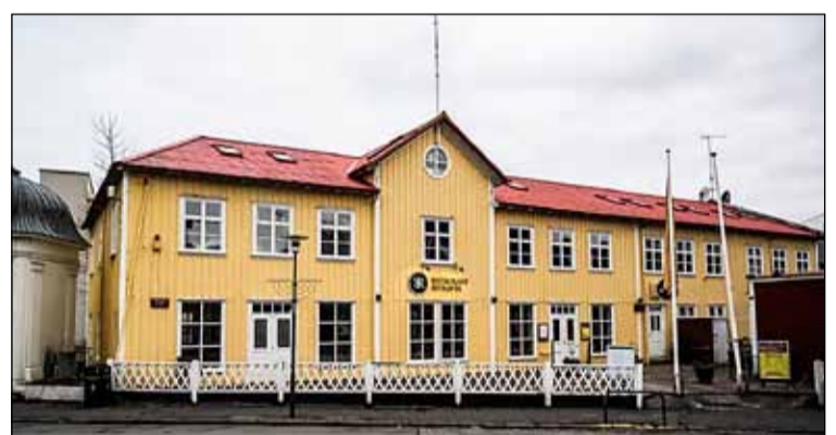
Bryggjuhúsið við Vesturgötu 2.

Saga Bryggjuhússins er fjölbreytt. Árið 1917 keypti bærinn eða tók Vesturgötu eignarnámi. Þá var ætlunin að framlengja