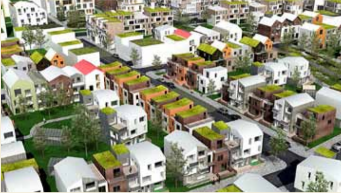
Ný byggð í Skerjafirði.

Andvaranes, Otursnes og Reginsnes eru ný gatnaheiti í Skerjafirði. Þá fær nýtt torg nafnið Iðutorg. Innblásturinn að nýju götunöfnunum er fenginn frá Sigurði Fáfnisbana og sagnaheimi í kringum hann en Otur og Reginn eru bræður Fáfnis en fyrir eru í Skerjafirði til dæmis Fáfnisnes og Gnitanes.