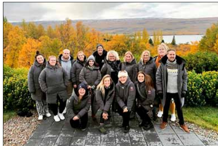
Nokkur þeirra um 200 manna og kvenna sem starfa í Tjörninni.

Hinsegin félagsmiðstöð Samtakanna 78 og frístundamiðstöðvarinnar Tjarnarinnar er dæmi um metnaðarfullt verkefni en hún er fyrir börn og unglinga á aldrinum 12 til 18 ára. Réttindaganga frístundaheimila Tjarnarinnar er farin ár hvert en þá minna börn á Barnasáttmála Sameinuðu þjóðanna og réttindi