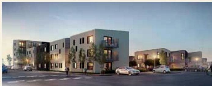
Húsnæði Búseta við Keilugranda í Vesturbæ Reykjavíkur.

Óhagnaðardrifin íbúðafélög geta byggt um tvö þúsund íbúðir. Um er að ræða Bjarg, Búseta, Félagshúsið og Félagshúsið stúdenta. Lóðaúthlutunaráætlun Reykjavíkurborgar til óhagnaðardrifinna íbúðafélaga á næstu tíu árum þýðir áframhaldandi stórfellda uppbyggingu félagslegs húsnæðis í borginni.