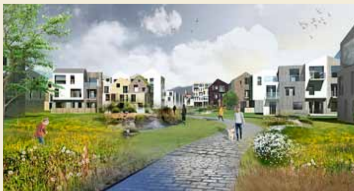
Fyrirhuguð byggð í Skerjafirði.

Borgarráð hefur samþykkt að úthluta lóð og byggingarrétti til Félagsstofnunar stúdenta fyrir 110 námsmannabúðir í nýja Skerjafirði fyrir 95 nýjum íbúðum til Bjargs íbúðafélags í sama hverfi.