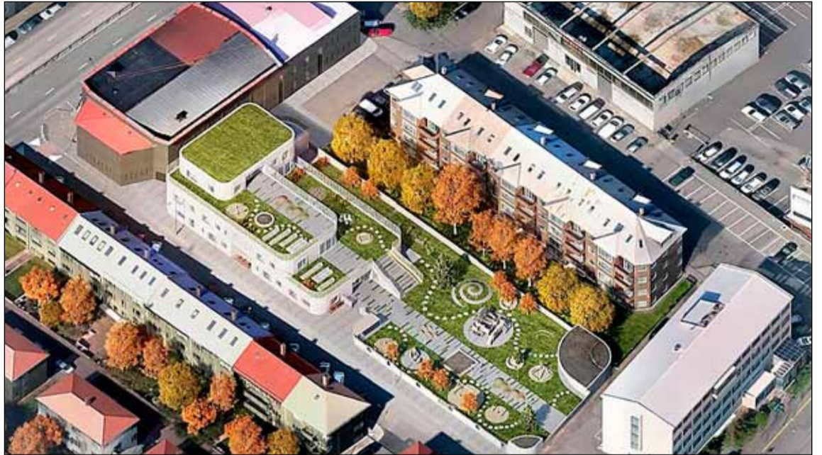
Þannig mun leikskólasvæðið lita út að framkvæmdum loknum. Mynd Bsalt aritektar.

Borgarráð hefur samþykkt að nýr Miðborgarleiksskóli og fjölskyldumiðstöð fari í útboð og að framkvæmdir geti hafist í júní. Svæðið er á Njálsgöturóló eða Njálsgötu 89 og stefnt er að því að byggingin og leiksvæðið verði fullbúið í lok árs 2023.