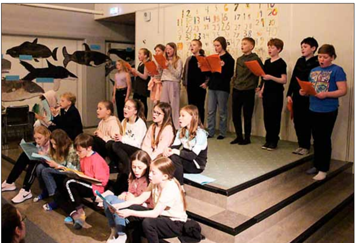
Frá vortónleikunum í Grandaskóla.