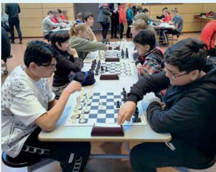
Setið að tafla á Íslandsmóti barnaskóla og grunnskólasveita.

Landakotsskóli sendi þrjár sveitir til leiks á Íslandsmót barnaskóla- og grunnskólasveita helgina 12. til 13. mars síðastliðinn. Skólinn sendi eina sveit til leiks í flokki 4. til 7. bekkjar og tvær sveitir í flokki 8. til 10. bekkjar. Yngri nemendum bauðst að tefla einnig í eldri flokkunum. A-sveit Landakotsskóla í 8. til 10. bekk hafði titil að verja en hafði ekki erindi sem erfiði þetta skiptið og lenti í 3. sæti eftir frækna baráttu.