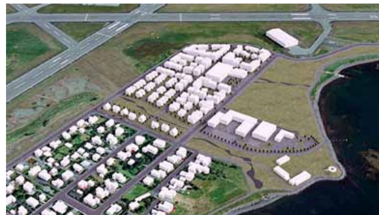
Fyrirhuguð Skerjafjarðarbyggð og Reykjavíkurflugvöllur.

tryggja að framkvæmdir á svæðinu hafi hvorki áhrif á flugöryggi né rekstraröryggi vallarins. Þá stöðvi borgin allar slíkar framkvæmdir þar til staðfest sé að öryggi vallarins sé tryggt. Óskaði ráðuneytið eftir svári fyrir 25. mars sem