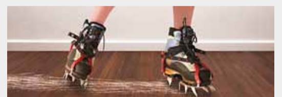
Burt með naglana

Nagladekk eru ráðandi þáttur í svifryksmengun á höfuðborgarsvæðinu. „Bíll á nöglum mengar allt að 40 sinnum meira en bíll sem ekki er á nöglum," sagði Þorsteinn Jóhannsson sérfræðingur hjá Umhverfisstofnun í fyrirlestri í mars og: „Það er sinnum, ekki 40 prósent meira heldur 2000 prósent meira."