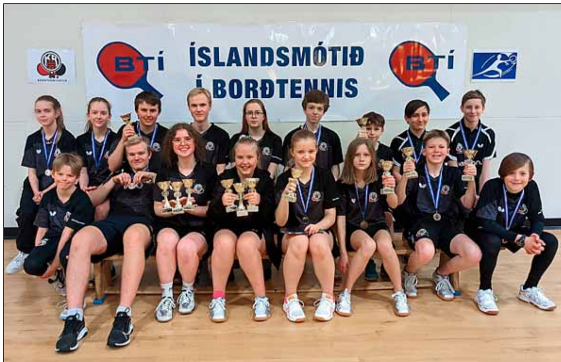
Stoltir verðlaunahafar frá Borðtennisdeild KR.

KR vann níu titla af 17 á Íslandsmóti unglunga í borðtennis, sem fram fór í KR-heimilinu við Frostaskjól 19.-20. mars. Borðtennisdeildir BH og KR héldu mótið í sameiningu.