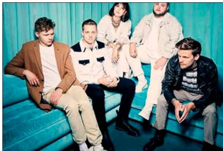
Of Monsters and Men.