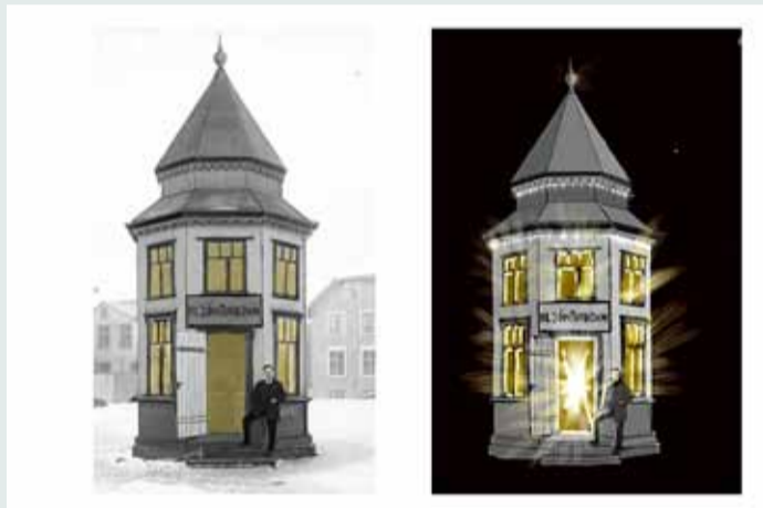
Turninn á Lækjartorgi óupplýstur og lýstur.

- þar verða seldar plötur og hann verður líka upplýsinga- og kynningarmiðstöð á íslenskri tónlist