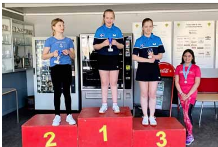
KR-stelpur á verðlaunapalli í Osló.