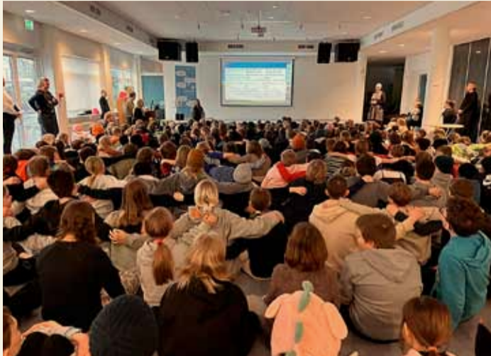
Sungið saman í Vesturbæjarskóla.

Nemendur í fyrsta til sjöunda bekk Vesturbæjarskóla mættu í samsöng í fyrsta skipti frá því að heimsfaraldurinn vegna korónaveirunnar byrjaði.