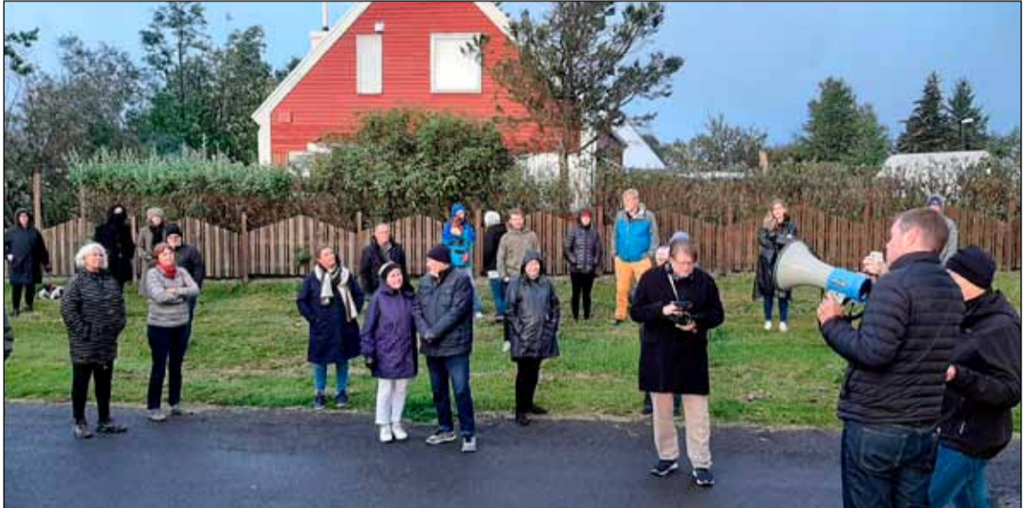
Frá einum af mörgum kynningarfundum sem efnt var til vegna hverfisskipulagsins.

- nýjungar og uppbygging einkenna skipulagið