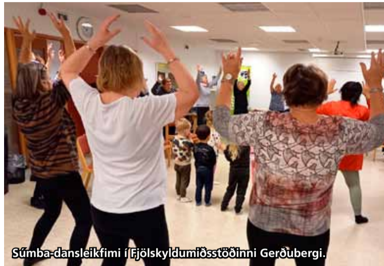
Súmba-dansleikfimi í Fjölskyldumiðstöðinni Gerðubergi.