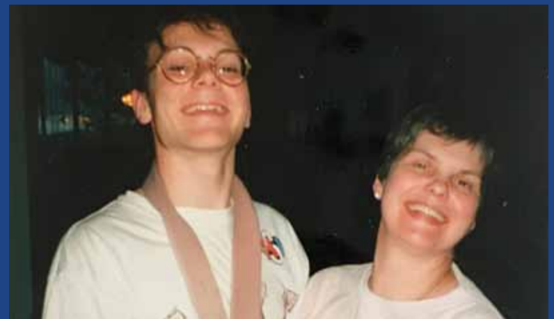
Landsliðsmarkmaðurinn í U-16 ásamt móður sinni í Brúnastekk 11 í júlí 1993.