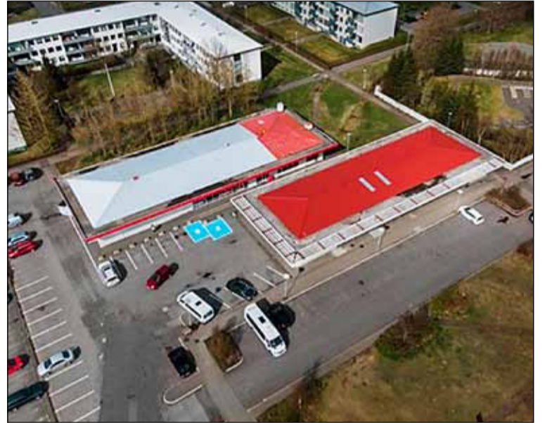
Arnarbakkasvæðið eins og það lítur út í dag. Þessi hús munu víkja fyrir nýbyggingum fyrir íbúa og þjónustustarfsemi.

Við Arnarbakka gert ráð fyrir allt að 150 íbúðum og er sérstaklega tekið fram að þar á meðal verði nemendaíbúðir. Einnig er gert ráð fyrir að þjónusturými verði aukið sem er liður í að endurheimta sem fjölbreyttasta þjónustu í hverfiskjarnana sem hafa látið verulega á sjá á undanförunum árum. Við Eddufell og Völvufell er einnig ætlunin að byggja um 150 íbúðir sem er mikil fjölgun frá fyrri hugmyndum sem gerðu ráð fyrir að 50 íbúðir yrðu byggðar. Þá er einnig ætlunin að efla þjónustu í hverfiskjarnanum á ný. Með þessu er fyrirhugað að