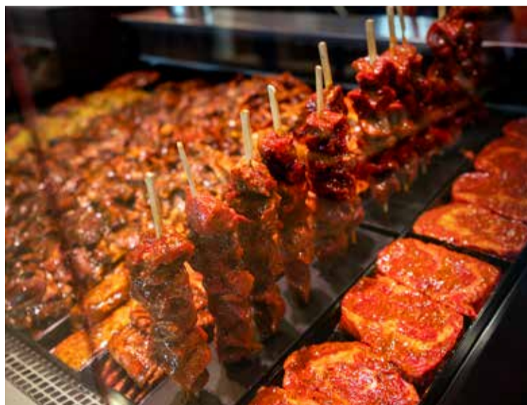
Alltaf fullt í nýja átta metra löngu kjörborðinu.

sem eru fyllilega á pari við það sem gerist á veitingahúsum út í bæ. Fólk kemur með óskir og við vinnum úr þeim. Við meðhöndlum kjötið, meðlætið, kartöflurétti, sósur og annað sem til þarf ásamt forréttum