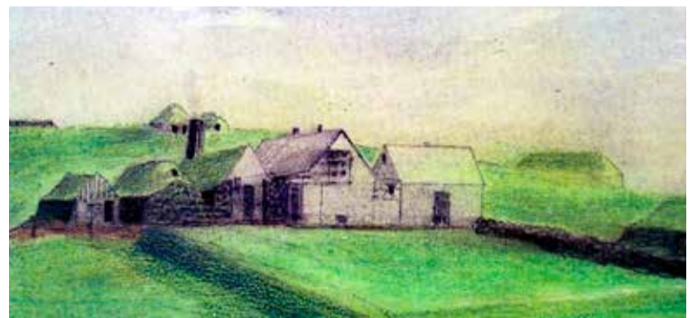
Málverk af Breiðholtsbænum eins og hann hefur verið talinn líta út á einhverjum tímamarki sögunnar.

Á fimmta og sjötta áratugnum varð mikill húsnæðisvandi í Reykjavík í kjölfar fólksfjölgunar. Fjöldi fólks bjó í heilsuspillandi og óviðunandi húsnæði. Kaupmáttur launa var of lítill, verðbólgan há og erfitt að fá