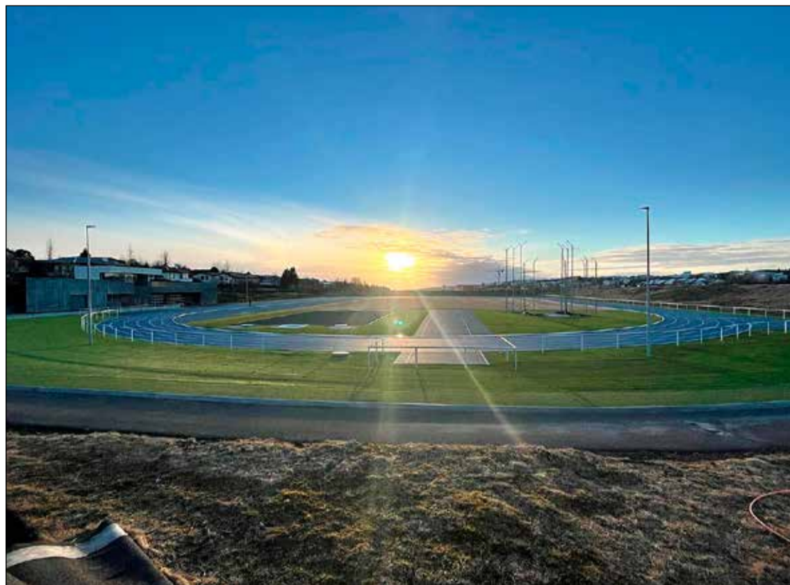
Sé yfir hinn nýja frjálsíþróttavöll ÍR í skini kvöldsólar.

Vigfús segir að nú sé hugað að því að geta gert meira fyrir Efra Breiðholti. "Við erum að vinna með Þjónustumiðstöðinni. Eigum mjög gott samstarf við hana. Hluti vandans þar er hversu samfélagið er fjölbreytt. Fjölmenningsamfélag þar sem ýmis menningarleg atriði geta