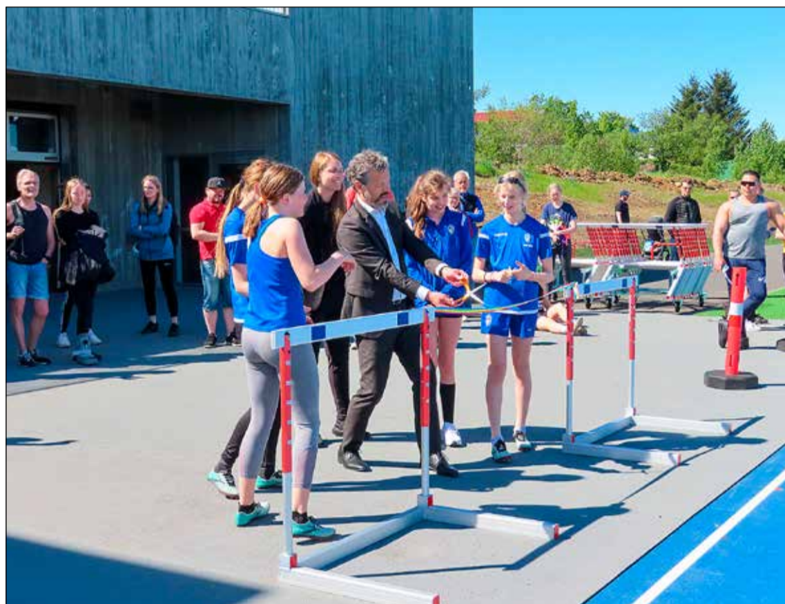
Dagur B. Eggertsson borgarstjóri klippti á borða ásamt stúlkum úr ÍR við opnun vallarins.

Nýr frjálsíþróttavöllur ÍR var opnaður 10. maí. Vormót ÍR sem jafnframt var vígslumót vallarins var haldið 29. maí. Nýi völlurinn er bylting fyrir ÍR-inga og Breiðholtsbúa og einnig alla frjálsíþróttahreyfingu landsins.