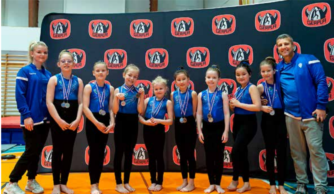
Ungar og efnilegar fimleikastúlkur úr ÍR.

ÍR fimleikar hafa starfað frá árinu 2015 og síðan þá byggt upp öflugan hóp stúlkna sem keppa stoltar, þrátt fyrir aðstöðuleysið í Breiðholti, undir merkjum ÍR í stökkfimi og hópfimleikum; en báðar greinar byggjast á gólfæfingum (dans), stökki og dýnu.