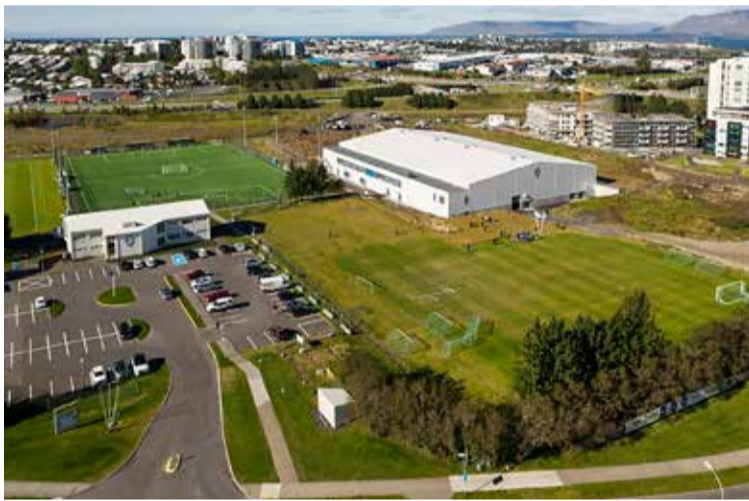
ÍR svæðið í Suður Mjódd. Það tók hálfa öld að koma upp flottri íþróttastöðu í Mjóddinni.