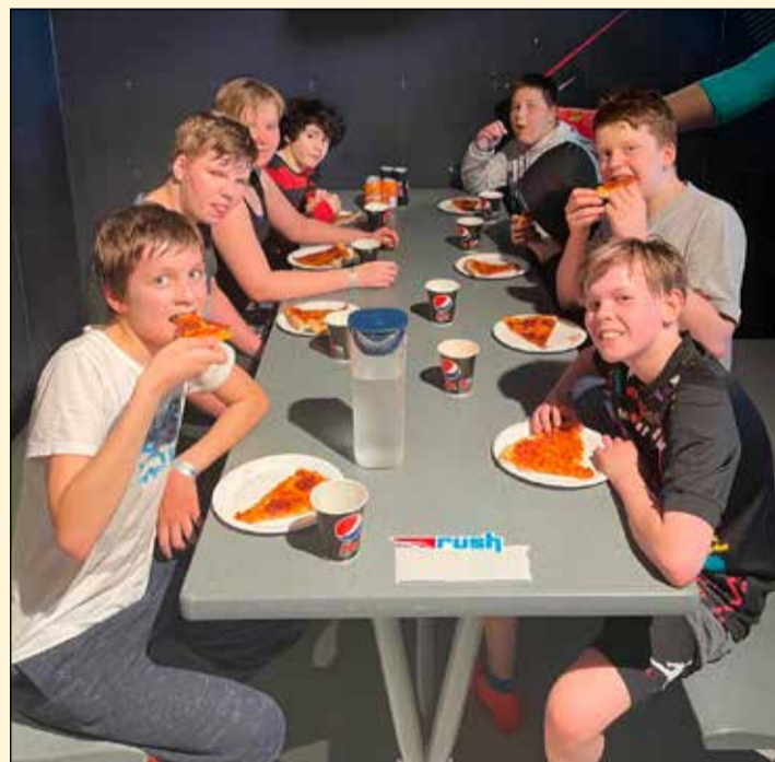
Allir fengu pizzu í Rush.