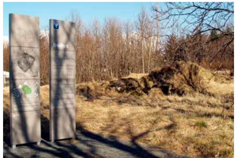
Myndin er af húsatóftunum og upplýsingaskiltunum sem standa við lóðina þar sem Breiðholtsbærinn stóð áður.

lóðir og einnig lán til nýbygginga. Almennig er áttítt með eða ómögulegt að eignast húsnæði. Skipulagsleysi í byggingarmálum var viðvarandi vandamál sem nauðsynlegt þótti að bregðast við. Verkalýðshreyfingin þrýsti á yfirvöld um að bæta úr stöðunni.