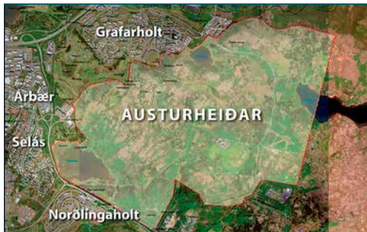
Kortid sýnir legu Austurheiða og afstöðu til byggðar í Reykjavík.

Verkefnið er byggt á samþykktu rammaskipulagi fyrir Austurheiðar sem samþykkt var af skipulags- og samgönguráði 10. mars 2021. Þá eru Austurheiðar hluti af Græna treflinum sem er samheiti yfir skógræktar- og útivistarsvæði á útmörkum sveitarfélaganna sjö á höfuðborgarsvæðinu. Markmiðin með gerð rammaskipulags fyrir Austurheiðar eru margþætt og eiga að tryggja samræmingu landnotkunar innan svæðisins