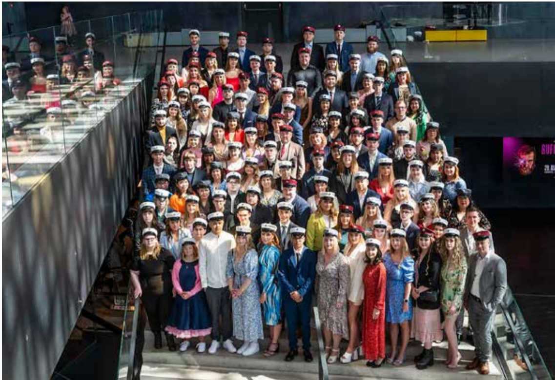
Útskriftarhópur Fjölbrautaskólans í Breiðholti á þessu vori.

Brautskráningin úr Fjölbrautaskólanum í Breiðholti fór fram við hátíðlega athöfn í Hörpunni laugardaginn 27. maí. Alls voru 138 brautskráðir á þessu vori. Þar af útskrifuðust 62 með stúdentspróf, 17 af húsasmíðabraut, 22 af rafvirkjabraut, 12 af snyrtibraut, 31 af sjúkrálfabraut og 9 af starfsbraut.