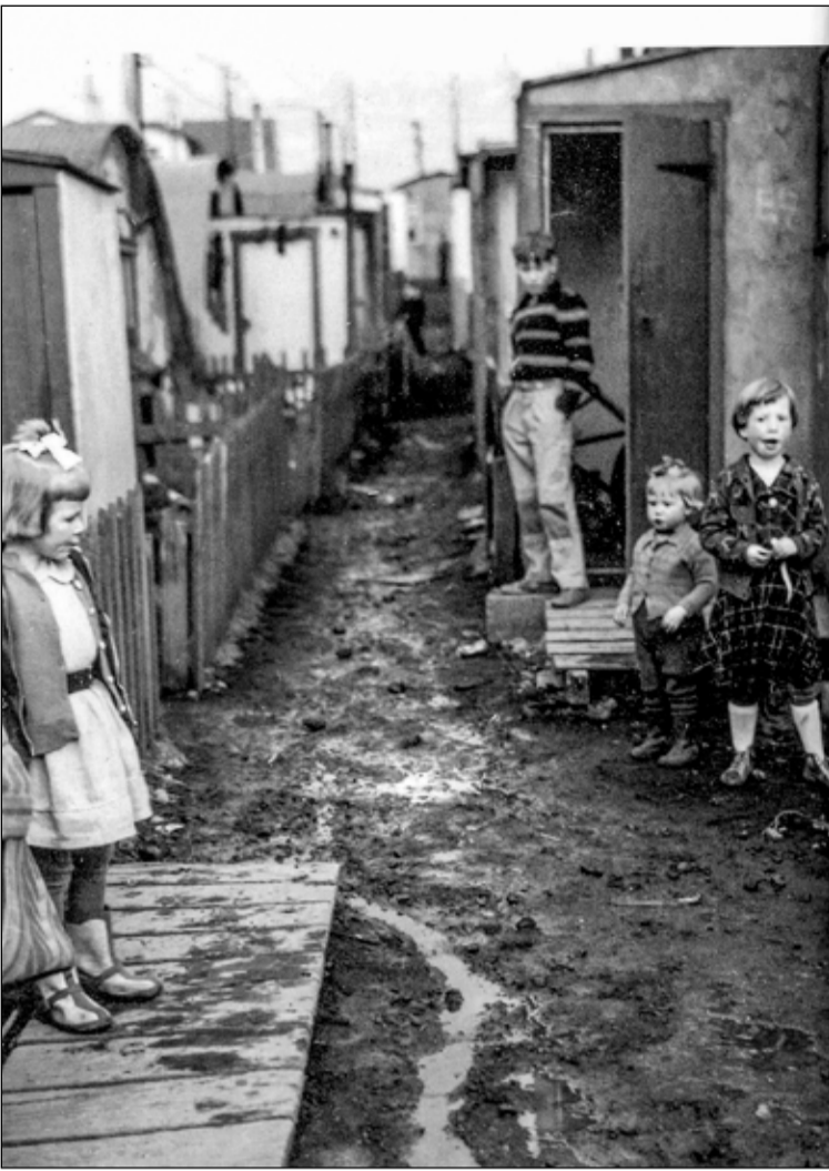
Frárennismálin voru í miklum ólestri í Kamp Knox.