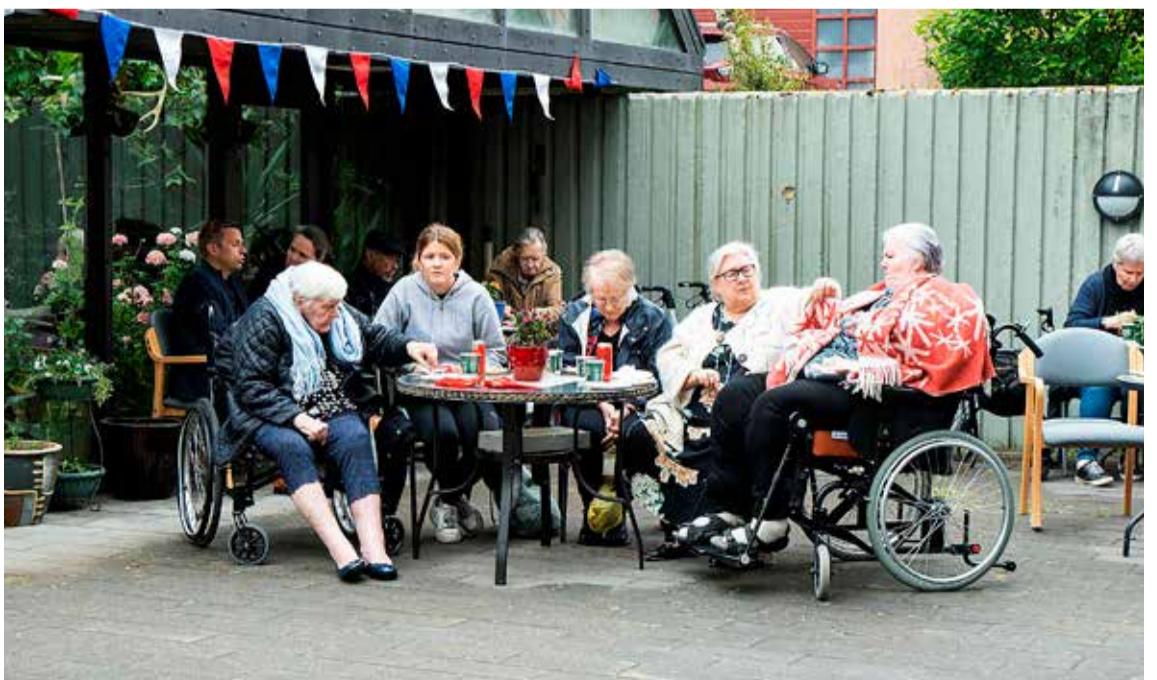
Heimilisfólk og starfsfólk þáðu veitingar í tilefni dagsins.