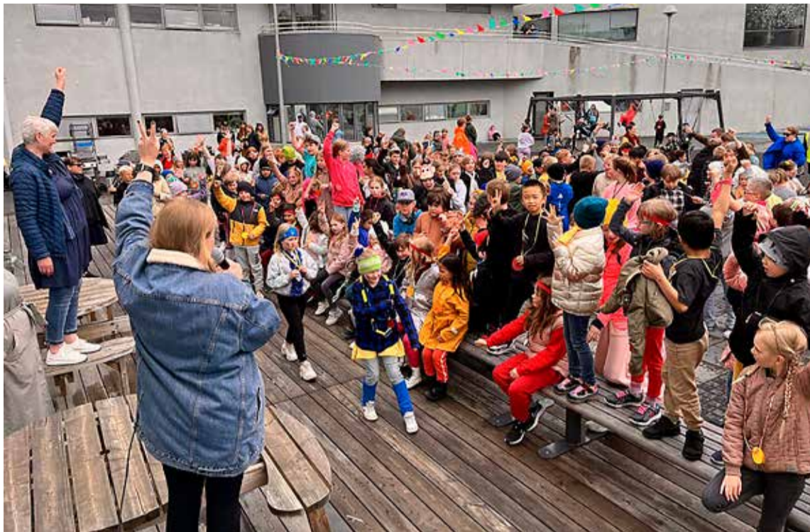
Frá vinaleikum í Vesturbæjarskóla.

Vinaleikar Vesturbæjarskóla voru haldnir að venju undir lok vorannar. Liðin hittust fyrst í peppinu þar sem þau fengu tækifæri til að velja nafn á liðið, búa til liðssönginn og ákveða búninga. Daginn eftir mættu liðin síðan hress og kát til leiks og tóku þátt í 24 leikjum sem kennarar voru búnir að undirbúa.