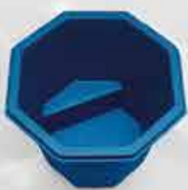
Sigurslaug (kaldi potturinn) 135.000 kr.