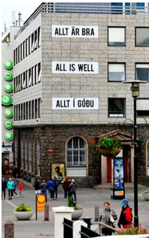
Allt í góðu á vegg dómhússins við Lækjartorg.