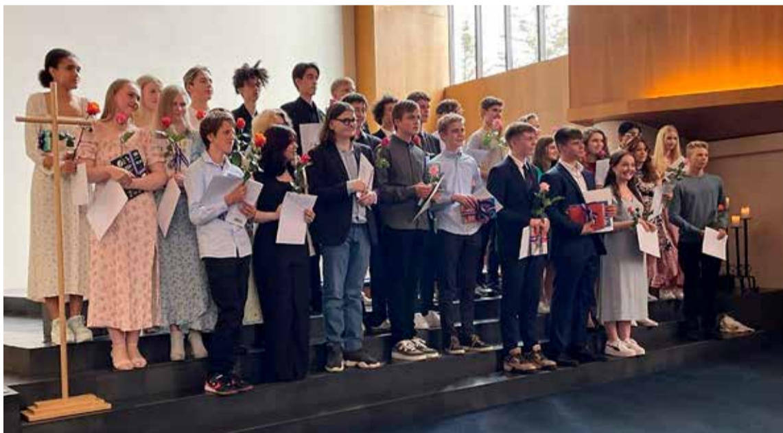
Tíundu bekkingar með útskriftarskríteinu sín.

Þessir myndarlegu krakkar stunduðu nám í tíunda bekk í Landakotsskóla á liðnum vetri. Þau útskrifuðust á dögum og hafa nú lokið námi í grunnskóla.