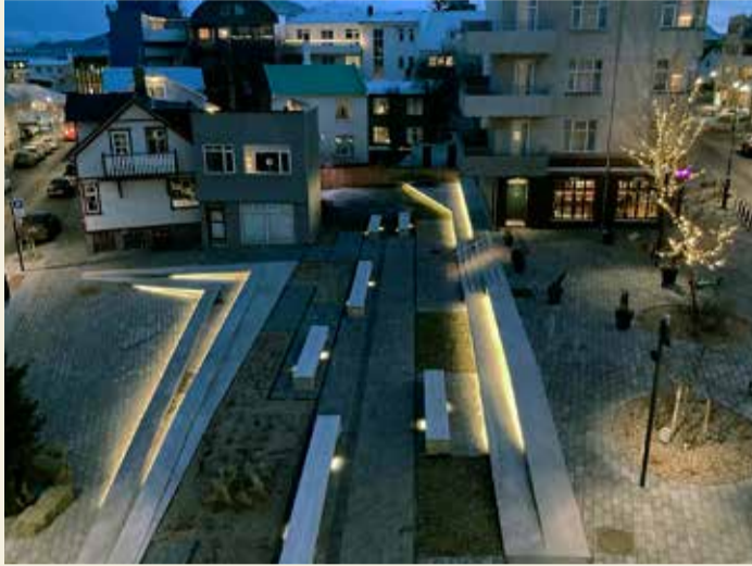
Ljósum prýtt Óðinstorg.