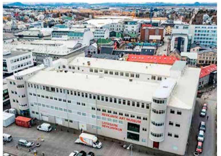
Hafnarhúsið – hús lista og skapandi greina.