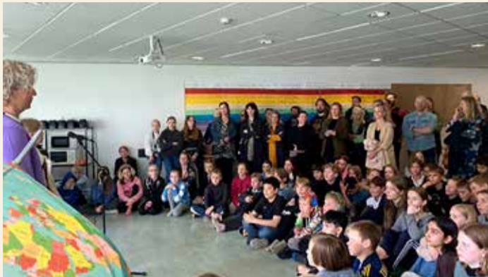
Fjöldi barna var á menningarmóti í Landakotsskóla.

Í tilefni af alþjóðadegi menningalegrar fjölbreytni UNESCO var fjölbreytileikanum fagnað í Landakotsskóla á dögum með verkefni „Menningarmót - fljúgandi teppi“.