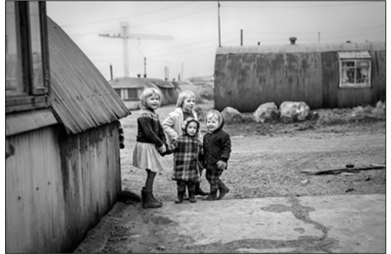
Börn að leik í Kamp Knox á sjöunda áratugnum skömmu áður en að kampurinn var rifinn.

Barnavinafélagið Sumargjöf sem rak barnaheimilið Grund sendi bæjarverkefndingunni harðort bréf yfir ástandinu. Í lok árs 1947 var samþykkt í bæjarstjórn Reykjavíkur að fela borgarstjóra að hlutast til um að braggahverfunum væri séð fyrir nauðsynlegum tækjum til þrifnaðar, meðal annars að skolpræsi væru þar í lagi. Borgarstjóri vísaði málinu áfram til heilbrigðisnefndar sem ákvað að rannsaka ástandið