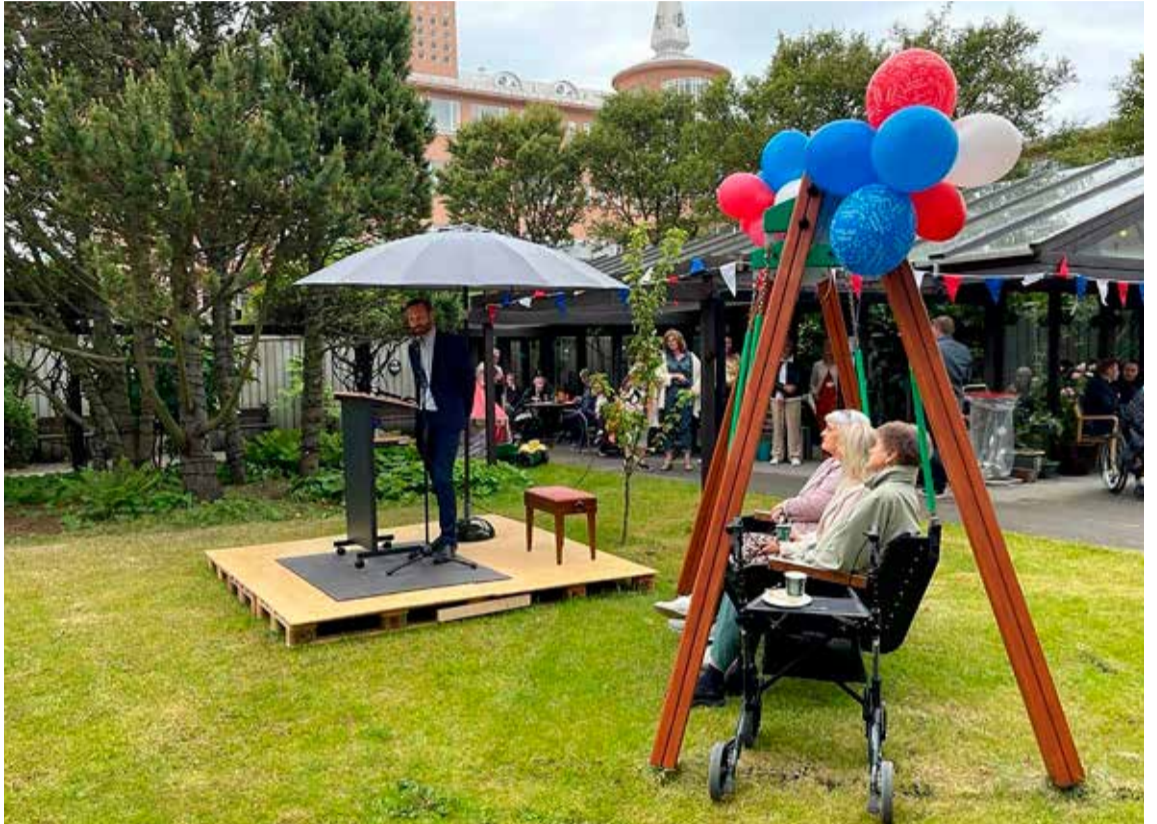
Margt var til gaman gert á afmælisdegi Droplaugarstaða.

Hjúkrunarheimilið Droplaugarstaðir er 40 ára. Heimilið tók til starfa 30. júní 1982. Íbúar, aðstandendur, starfsfólk og aðrir velunnarar Droplaugarstaða fögnuðu tímamótunum með litríkri garðveislu á afmælisdaginn.