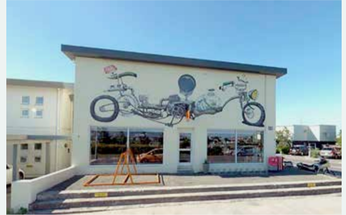
Einarsnes 36 þar sem Bike Cave var til húsa.