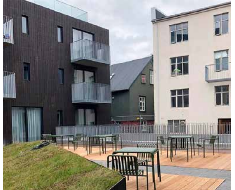
Náttúra útivist og mannvirki eldri sem yngri eiga að verða einkenni framtíðarborgarinnar.

Byggja borg sem fólk tengir við, vill búa í og þykir vænt um. Borg sem er nútímaleg og er byggð til langs tíma. Borg sem er byggð með tilliti til loftslags og náttúru. Borg sem á sögu og segir sögu.