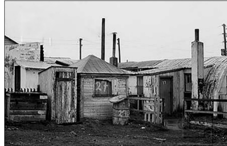
Ýmis kofaskrifli voru á milli sumra bragganna í Kamp Knox.