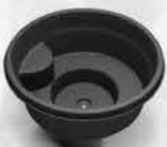
Geirslaug 279.000 kr.

Nú eigum við okkar vinsælustu potta til á lager!