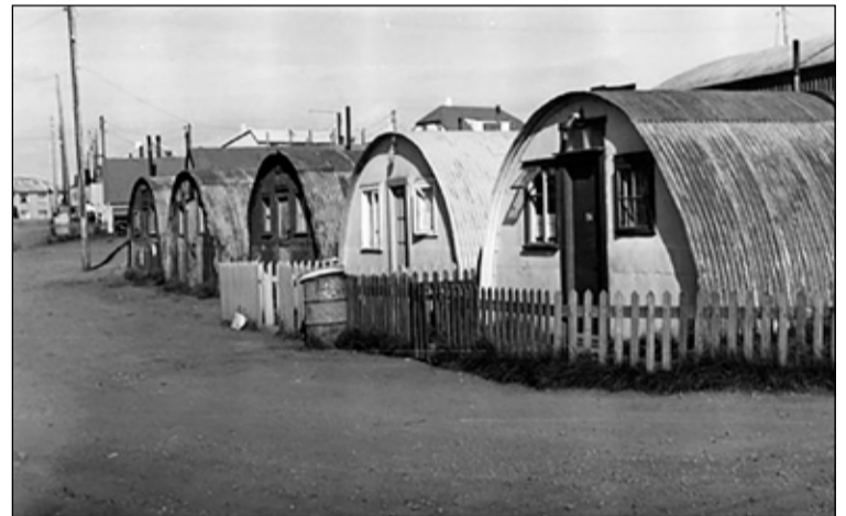
Á góðviðrisdegi í Vesturbænum.

í herskálaverfunum á grundvelli fyrrgreindrar tillögu. Ágúst Jósefsson heilbrigðisfulltrúi framkvæmdi rannsóknina á útmánuðum 1948 með því að heimsækja allar íbúðir í bröggum, samtals 380 að tölu. Af þeim höfðu 189 vatnsleiðslu inn í íbúðina, 207 höfðu skólpleiðslu en vatnssalemi voru í 117 bragga íbúðum. Við útikamra við braggana voru aðstæður mjög óþrifalegar. Ágúst sagði eftir þessa yfirferð að vatns- og skólpleiðslukerfum í herskálaverfum væri svo ábótavant að brýn nauðsyn bæri til útbóta.