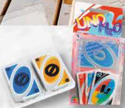
UNO vatnsheld spil 3.490 kr.