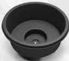
Gvendarslaug 189.000 kr.