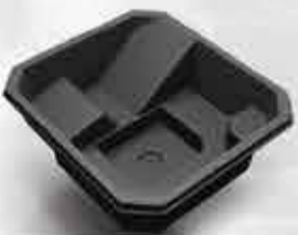
Unnarslaug 310.000 kr.