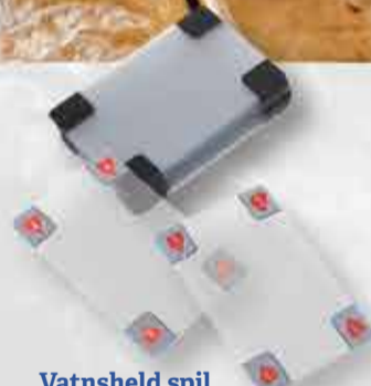
Vatnsheld spil 2.950 kr.