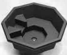
Grettislaug 259.000 kr.