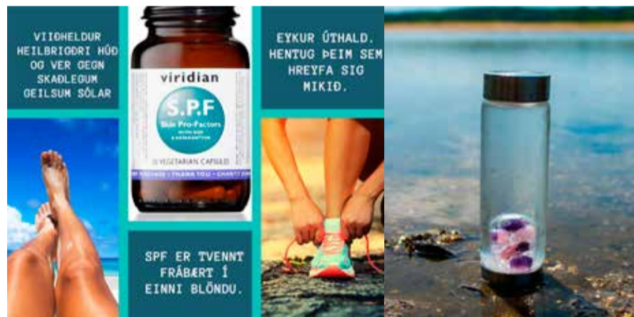
Innra og ytra

Allir jógapakkinn Liðleiki og styrkur sumar, vetur, vor og haust.