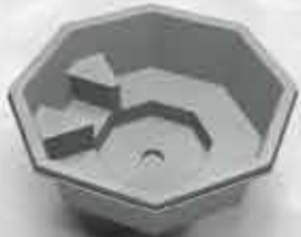
Snorrslaug 299.000 kr.