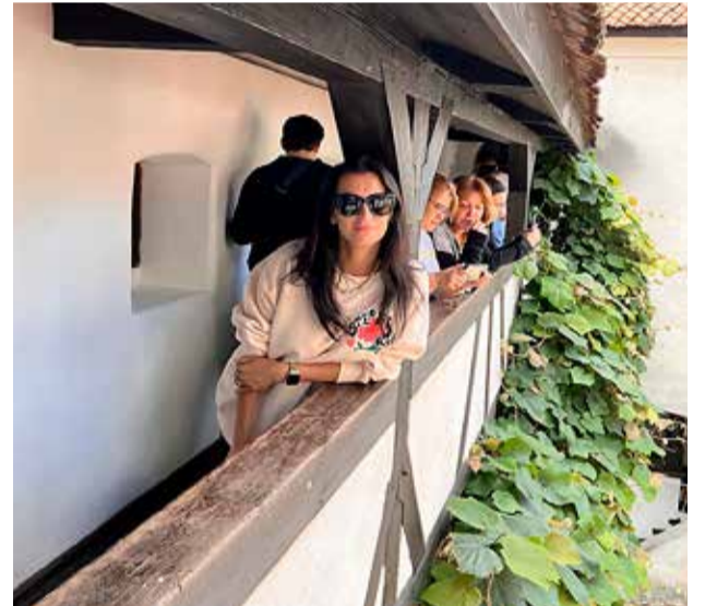
Stödd í Drakúlakastalanum í Rúmeníu.