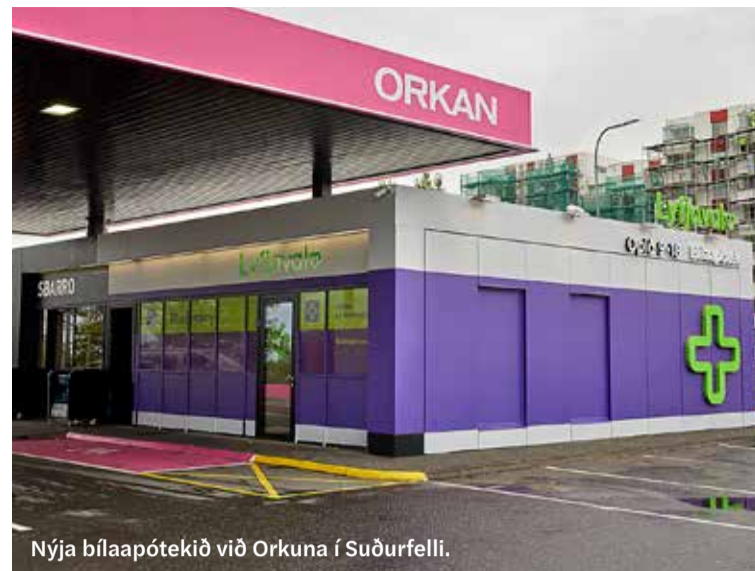
Nýja bílaapótekið við Orkuna í Suðurfelli.

getur pantað lyf og aðrar vörur. Það getur valið um að fá sent heim eða sótt vöruna í það apótek sem hentar því best. Þá er engin bið, bara að rúlla t.d. í einhver af bílaapótekunum og sækja pakkann. Fólk er búið að greiða og við búin að taka vöruna til þegar það kemur.