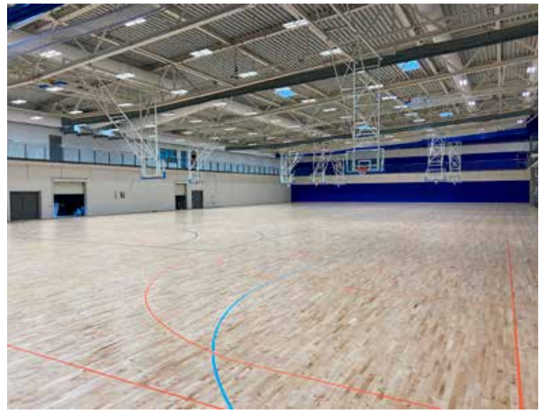
Parketsalur í nýja íþróttahúsinu.