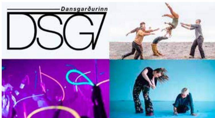
Úr starfi Dansgarðsins.