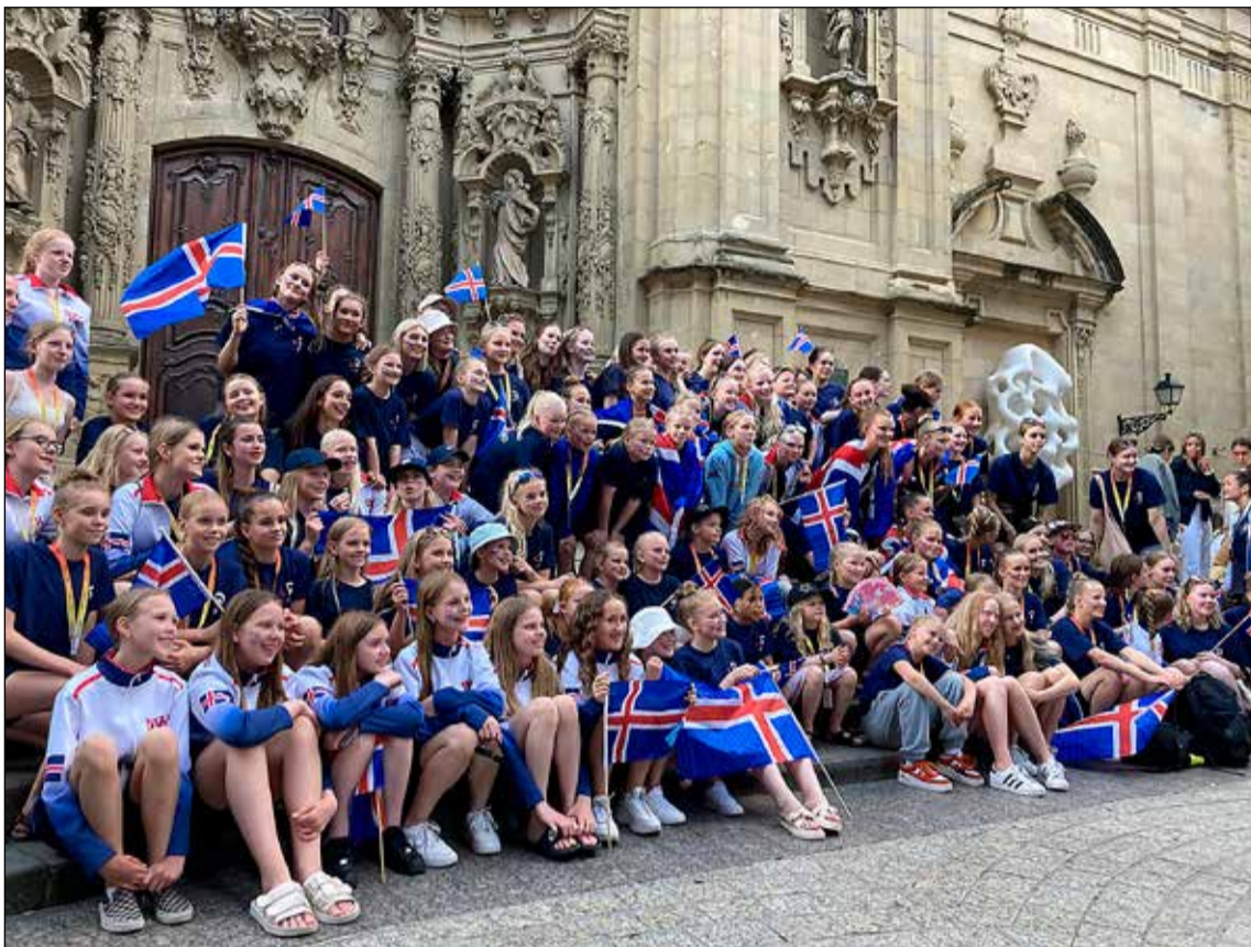
Nemendur Klassíska listdansskólans á Spáni.

Nemendur úr Klassíska listdansskólanum tóku þátt í Dance World Cup á Spáni í sumar. Krakkar á aldrinum fjögurra til tuttugu og sex ára tóku þátt í þessu heimsmeistaramóti og dansarar úr 10 íslenskum dansskólum tóku þátt í keppninni í ár, alls 208 krakkar.