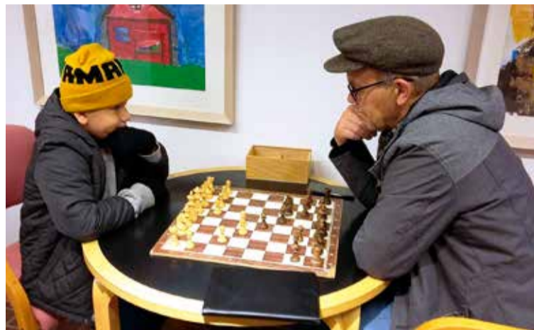
Hvað ungur nemur gamall temur var eitt sinn sagt. Hér sitja tveir að tafli yngri og eldri.

Félagsstarfið er opið fimm daga vikunnar og þó svo að töluvert sé lagt upp úr því að skapa aðstæður og athvarf fyrir eldri borgara og almennt þau sem ekki eru lengur þátttakendur á vinnumarkaði, þá er