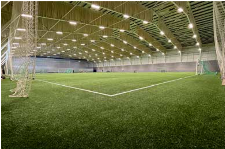
Nýtt glæsilegt fjölnotahús ÍR við Skógarsel.

Eins og fram kemur á forsíðu verður haldinn ÍR dagur þann 27. ágúst frá kl. 11 til 14 þar sem borgarstjóri mun vígja nýja og glæsilega parkethöll er verður heimavöllur bæði handknattleiks- og körfuknattleiksdeildar. Á ÍR deginum býðst gestum að skoða allt svæðið, taka út aðstöðuna og fá kynningu hjá deildum félagsins á starfsemi þeirra veturinn 2022/2023. Íþróttafélag Reykjavíkur býður upp á frjálssar, knattspyrnu, handknattleik, körfuknattleik, júdó og taekwondo. Allt á sama blettinum fyrir iðkendur