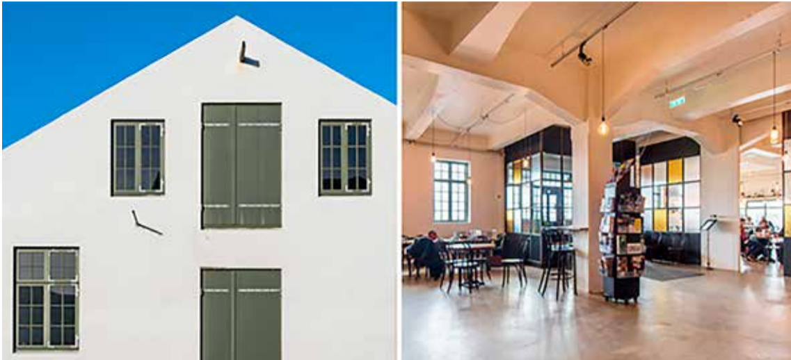
Alliance húsið og veitingastaðurinn Matur og drykkur.

Erfiðlega hefur gengið að selja Alliance húsið á Grandagarði 2. Tilraunir borgarinnar til sölu þess hafa ekki lukkast. Nú hefur borgarráð samþykkt að hefja enn á ný sölufarli á húsinu og byggingarrétti á lóð þess.