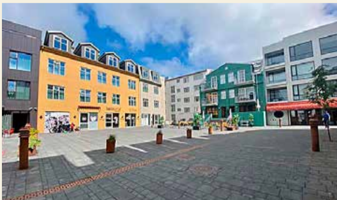
Oft er fáferðugt á torginu á milli Hverfisgötu og Laugavegar.

- rekstraraðilar telja sig þó sjá breytingar