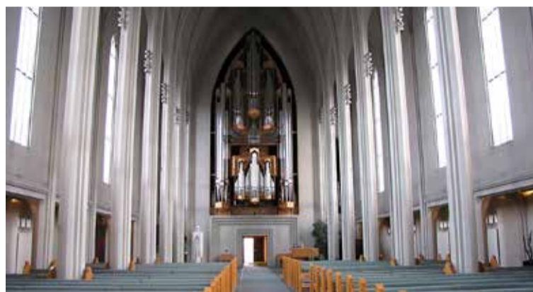
Séð inn í kór Hallgrímskirkju.

Kristmyndin er eitt þekktasta verk Thorvaldsens. Styttan er 3,45 metrar á hæð og telja áhugasamir um uppsetningu hennar að hún mynd sóma sér vel í krónum í Hallgrímskirkju. Bertel Thorvaldsen var íslenskur í föðurætt og er listfengi að finna í ættum hans. Kristján Eldjárn forleifafæðingur og fyrrverandi forseti Íslands ritaði grein í sýningarskrá fyrir stórsýningu sem haldin var á verkum