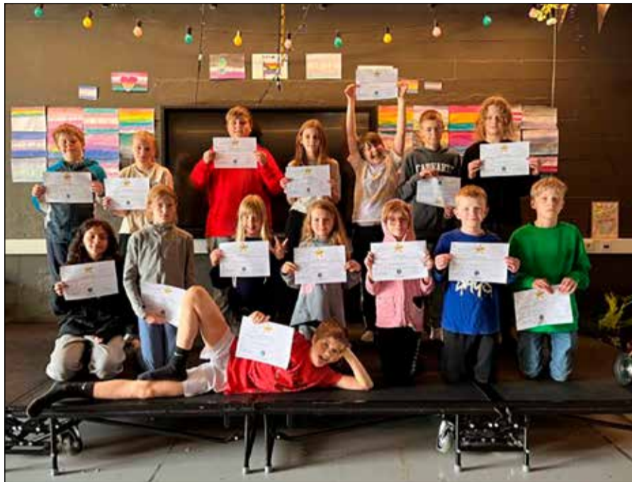
Þátttakendur með útskriftarskírteini sín.