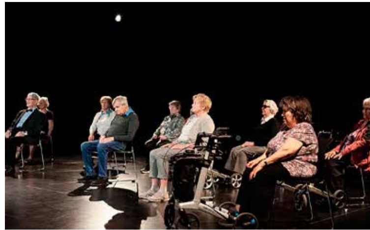
Danshópurinn frá Þorraseli.

Aðgangur er frír að sýningunum. Hægt er að nálgast miða á https://tix.is/is/event/13769/let-s-dance/