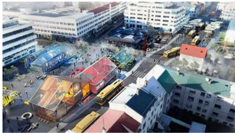
Fyrirhugað útlit umhverfis við Hlemm.

Áætluð verklok á þessum fyrsta áfanga eru næsta vor. Ekki er gert ráð fyrir umferð einkabíla við torgið í framtíðinni og fær einkabíllinn að víkja fyrir almenningsamgöngum, gangandi og hjólandi vegfarendum. Gert er ráð fyrir að Hlemmur verði með öllu bíllaus á næstu þremur árum. Þetta verkefni hófst með