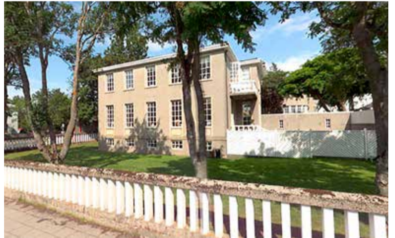
Hamragarðar við Hávallagötu var reist fyrir Jónas frá Hriflu og teiknað af Guðjóni Samúelssyni.