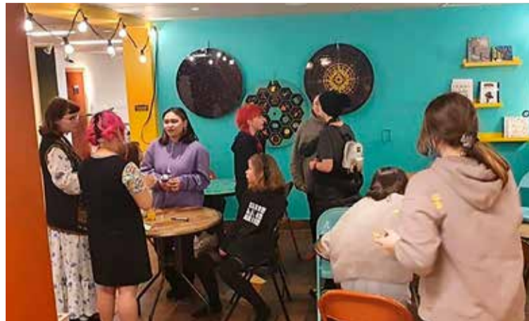
Frá starfi í Animeklúbb.

Hvað er gert í Anime. Þar er teiknað, spilað, spjallað, fönðrað, horft á þætti, gluggað í bækur eða bara "tjillað" með krökkunum. Anime klúbburinn er byggður þannig upp að þar finnst eitthvað fyrir eitthvað fyrir flesta. Félagar í Íslenska myndasögusamfélaginu sjá um að skipuleggja smíðjur og alls kyns afþreyingu, þar á meðal bíóferðir og hrekkjavökuböll og margt fleira. Anime klúbburinn í Grófinni hefst miðvikudaginn