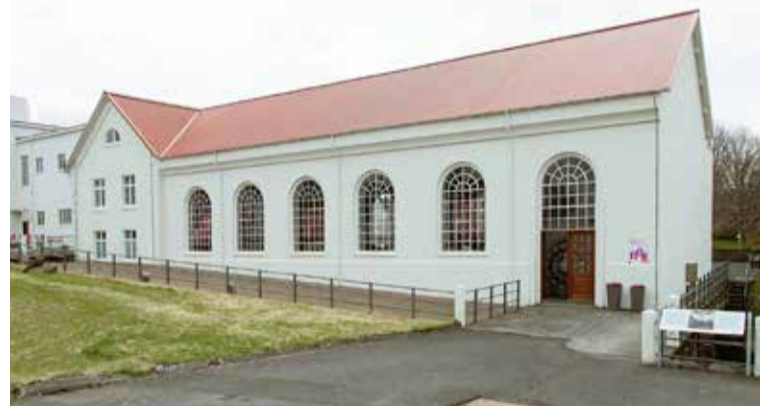
Rafstöðvarhúsið í Elliðaárdal. Ljóst er að þarna var ekkert til sparað að gera aðstöðu rafveitunnar sem glæsilegasta.