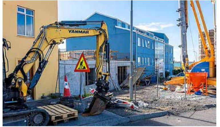
Vinnusvæði við Vesturgötu 67 þar sem framkvæmdir hafa verið stöðvaðar.

Þrátt fyrir andstöðu nággranna sem sögðu hið nýja kassalaga hús á skjön við götumyndina og þar með ekki uppfylla skilmála deiliskipulags réðst borgin í framkvæmdir við hið nýja hús. Félagsbústaðir hf. höfðu á árinu 2020 fengið deiliskipulagi breytt svo í stað húss upp á tvær og hálfra hæð má byggja fjögurra hæða hús. Rök í málinu eru að öll aðliggjandi hús og öll hús í nærliggjandi götum eru með mænispaki, en á Vesturgötu 67 á að reisa hús sem er kassalaga með flötu þaki. “Það passar alls ekki inn í götumyndina,” segir um sjónarmið þeirra sem