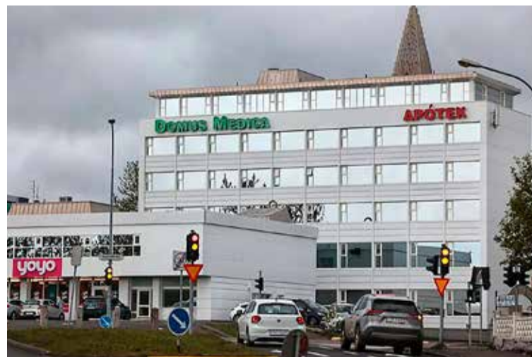
Domus Medica við Egilsögötu.

Hinir nýju eigendur hafa ekki afráðið með öllu hvers konar starfsemi verður í húsinu en áhersla mun verða lögð á heilbrigðisþjónustu. Engin áform munu vera um að flytja starfsemi Heilsugæslunnar Höfða á Egils-götuna. Í dag er móttaka fyrir flóttafólk í húsinu og gert er ráð fyrir að hún verði þar eitthvað áfram.