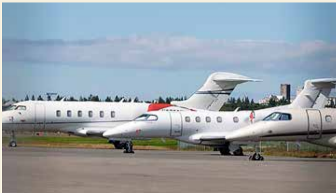
Einkapötur á Reykjavíkflugvelli.

Einkapötum sem hafa viðkomu á Reykjavíkflugvelli hefur fjölgað í sumar. Um eitt hundrað einkapötur höfðu lent á Reykjavíkflugvelli um miðjan júlí. Vélarnar skapa tekjur fyrir flugvöllinn þótt deilt sé um hvort gjaldtaka fyrir stæði þeirra sé nægilega há. Sitt sýnist þó hverjum um ágæti þeirra. Þær geta valdið töluverðum hávaða í flugtaki, sem er mörgum borgarbúum til ama. Eins hefur lengi verið horft eftir að æfinga- og einkaflug verði flutt af Reykjavíkflugvelli.