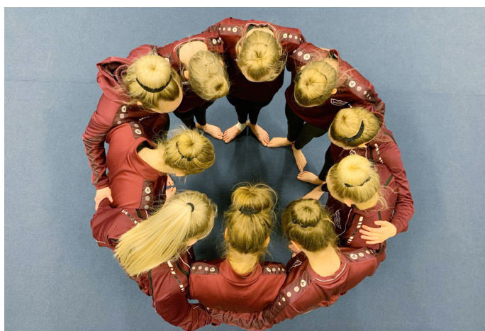
Stjójum Selfyssinga til sigurs.

Við viljum hvetja alla til að mæta á mótið á laugardaginn