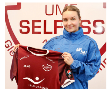
Clara í herbúðum Selfoss.

„Við erum mjög ánægð með að leikmaður á hennar kaliberi vilji koma í knattspyrnukademiuna í Fjölbrautaskóla Suðurlands og spila með Selfoss. Hún mun klárlega styrkja