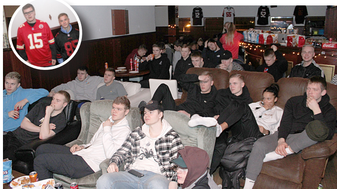
Hluti hópsins búinn að koma sér fyrir og fylgist spennur með framgangi mála.

Mikil stemning og góð mæting var á kvöldinu en boðið var upp á kjúklingavængi, eðlu og snakk ásamt fleira góðgæti. Eins og allir vita er stór hluti hátíðarinnar einmitt að narta í kjúklingavængi með eldheitri sósu ásamt öðru krudferi. Í Bandaríkjunum er það aðeins Þakkargjörðarhátiðin sjálf sem fer fram úr Ofurskálinni hvað matarneyslu varðar. Það er eitthvað undursamlega amerískt og gott við þetta! Meðan