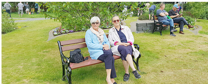
Myndin er tekin á hátíðinni Blóm í bæ 2019.

Á fundi bæjarráðs Hveragerðisbæjar, þann 6. febrúar sl. voru lagðar fram niðurstöður þjónustukönnunar sveitarfélaga 2019 sem framkvæmd var af Gallup. Í skýrslunni kemur fram að Hveragerðisbær fær hæstu einkunn allra sveitarfélaga í þjónustukönnun Gallup þegar spurt var um ánægju íbúa með sveitarfélagið sem stað til að búa á. Bæjarfélagið hefur skipað sér í efstu sæti undanfarin ár en nú eru íbúar Hveragerðisbæjar á toppnum þó rétt sé að geta þess að lítil munur sé á efstu sætunum.