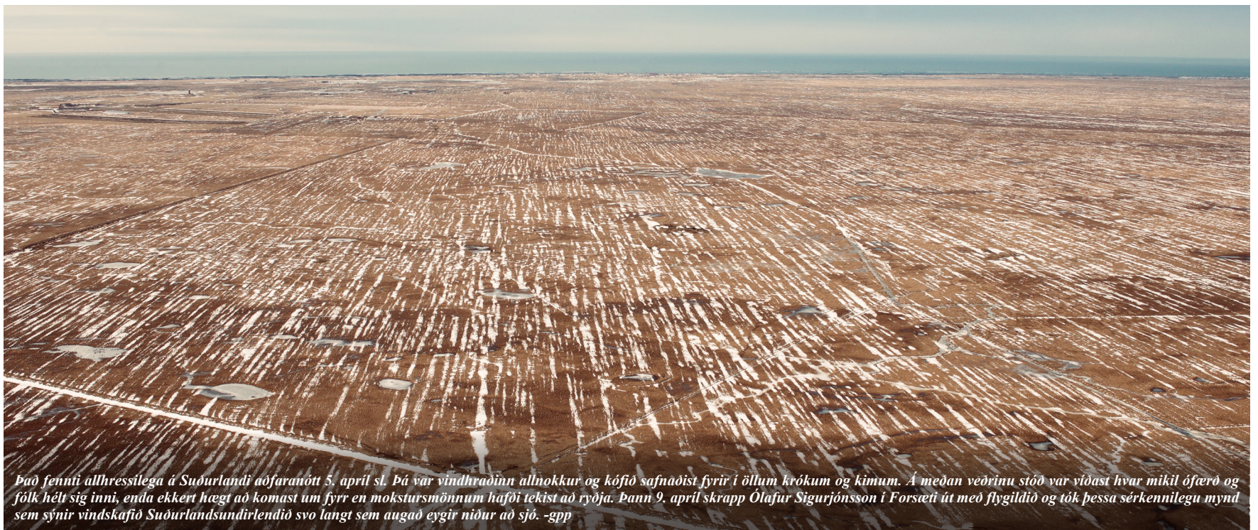
Það fennati allhressilega á Suðurlandi aðfaranótt 5. apríl sl. Þá var vindhradinn allnokkur og kófið safnaðist fyrir í öllum krókum og kímum. Á meðan veðrinu stóð var víðast hvar mikil ósterð og fólk hélt sig inni, enda ekkert hægt að komast um fyrr en mokstursmönnum hafði tekist að ryðja. Þann 9. apríl skrapp Ólafur Sigurjónsson í Forsæti út með flygildid og tók þessa sérkennilegu mynd sem sýnir vindskáfið Suðurlandsundirlendið svo langt sem augað eygir niður að sjó. -gpp