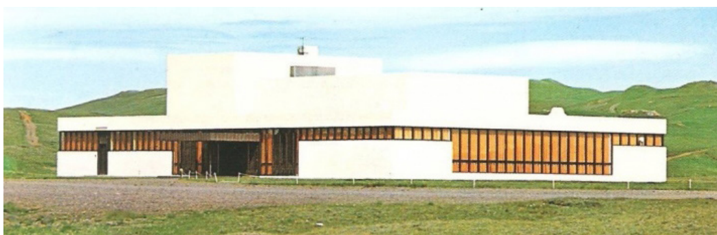
Myndin er síðan 1970.

Það er óhætt að segja að margir hafa fylgst spenntir með framkvæmdum á þessum áberandi stað í bæjarfélaginu og er ekki að efa að þarna muni myndast lifandi og fjölbreyttur áningarstaður fyrir íbúa og aðra gesti Suðurlands en með þessari viðbót við fjölbreytta flóru afþreyingar og veitingastaða verður Hveragerði enn ákjósanlegri staður fyrir sunnudagsrúntinn og eins þegar Suðurland er sótt heim.