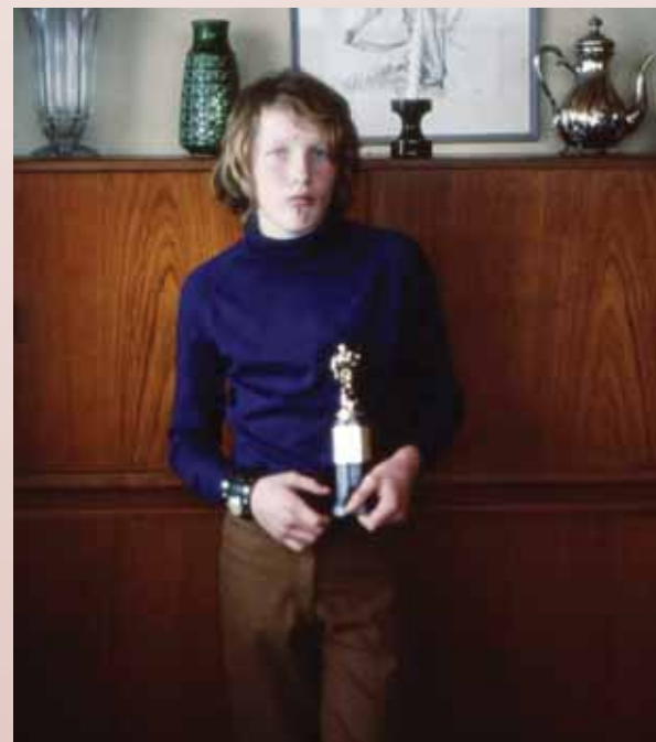
Leikmaður 4. flokks, í kringum 1971. Nokkrir bikarar í Tíbrá skemmdust í jarðskjálftanum mikla 2008. Þessi bikar finnst ekki í dag, sennilega er hann einn af þeim sem skemmdust og var fleygt.