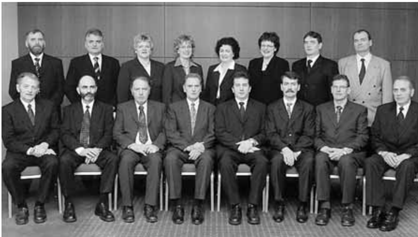
Hér má sjá systkinin á Brúnastöðum.