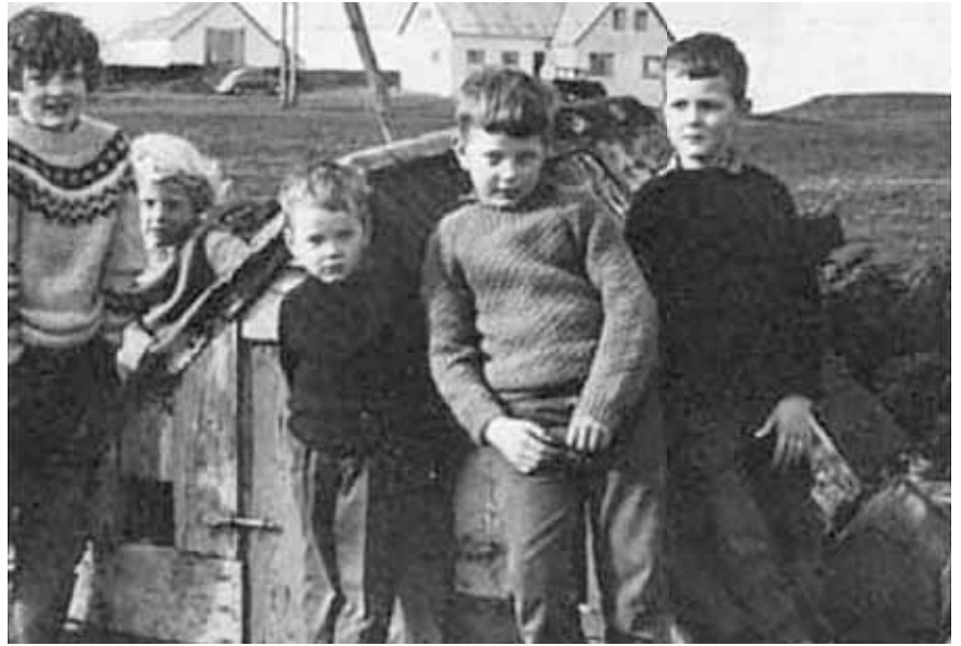
Hér má sjá yngstu systkinin á Brúnastöðum.