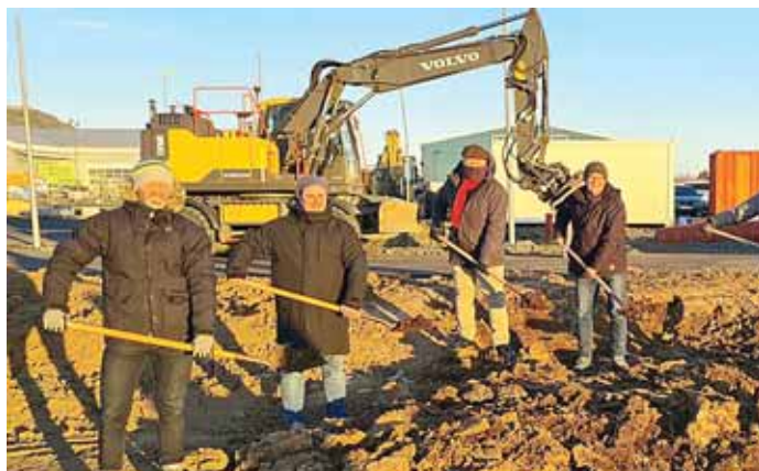
Við skóflustungu að Heiðarstekk 1-3.

Skóflustunga að 28 nýjum leiguíbúðum sem Bjarg íbúðafélag byggir við Heiðarstekk 1 og 3 var tekin í hressandi norðanátt á föstudag. Um er að ræða svokölluð „kubhús“, vistvænar og endingagóðar