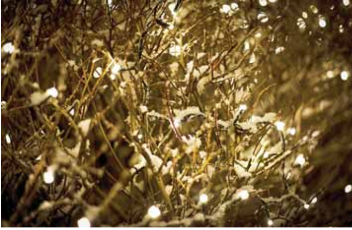
Í byrjun vikunnar snjóaði duglega og jólaljósín njóta sín enn betur í skammteginu.

A síðustu mánuðum höfum við öll staðið frammi fyrir miklum samfélagslegum breytingum vegna baráttunnar við þann vágast sem kom til sögunnar í upphafi árs. Takmarkanir í samfélaginu hafa reynst mörgum einstaklingum erfiðar. Þá hafa margir einangrast, misst vinnunna og jafnvel ástvini. Þessi staðreynd blasir við okkur í dag og því er svo mikilvægt að við hlúum hvert að öðru og töpum ekki gleði og hamingju.