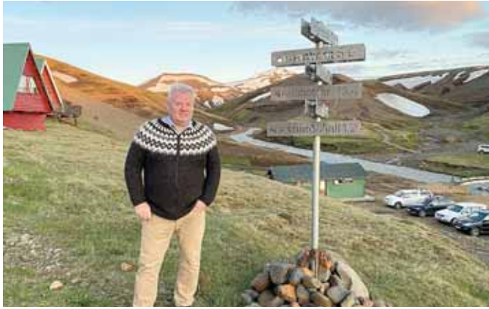
Á leið minni norðan úr Eyjafirði heim í Syðra-Langholt ákvað ég að aka suður yfir Kjöl í fallegri júnínótt. Tók krók inn í Kerlingarfjöll sem er einn af mínum kærustu stöðum á landinu.

Pau lýsa fegurst, er lækkar sól, í blámaheidi mín bernsku jól.