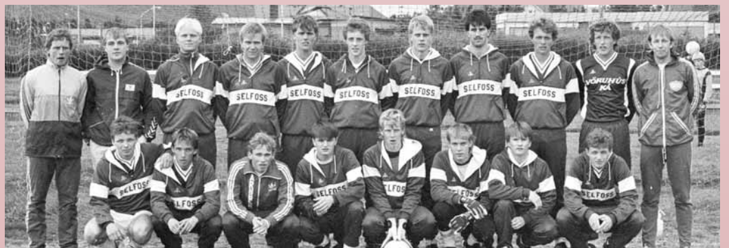
Selfossliðið árið 1987.