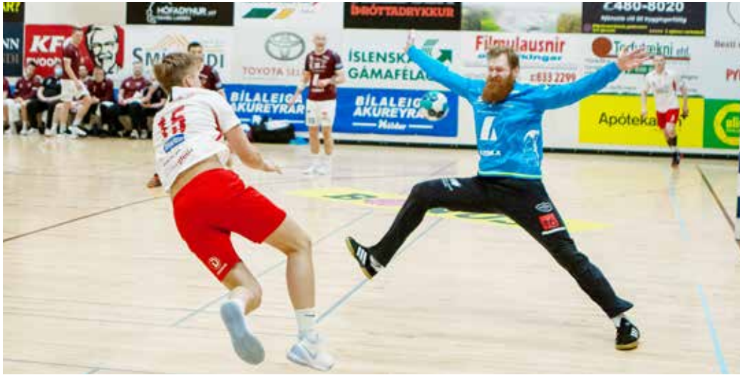
Vilius átti frábæra leiki og varði hátt í tuttugu skot í hvorum leik.