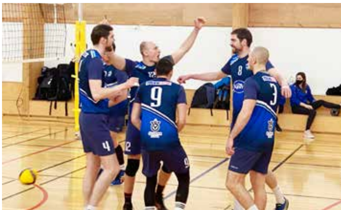
Hamarsmenn fagna stigi gegn Þrótti Vogum í síðustu viku.

Hamarsmenn byrjuðu leikinn ef miklum krafti og unnu fyrstu hrinuna örugglega 25-18. Önnur hrinan var jöfn frá fyrstu