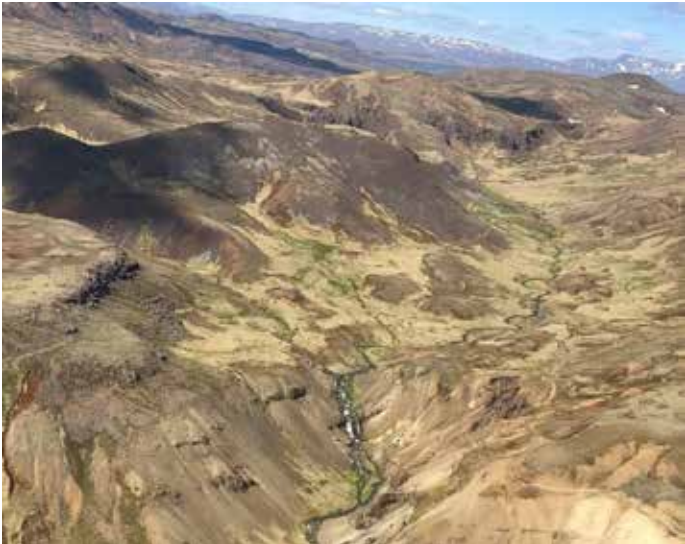
Myndin er tekin sumarið 2020 og sýnir umhverfi Reykjadal og útsýni yfir til Þjóðgarðsins á Þingvöllum.

Á fundi bæjarráðs Hveragerðisbæjar þann 4. febrúar sl. var lagt fram erindi frá Umhverfis- og samgöngunefnd Alþingis þar sem óskað er eftir umsögn um tillögu til þingsályktunar um áætlun