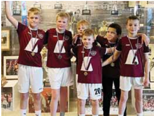
Krakkarnir á yngri ári með gullverðlaunin sín.

báðir hóparnir efstu deild. Alls sendi Selfoss átta lið til keppni og stóðu allir iðkendur sig með þrýði utan vallar sem innan. -eg