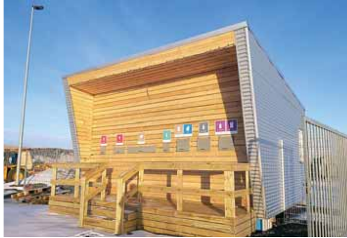
Á gámasvæðinu er falleg bygging þar sem má flokka allt vandlega. (Ljós. LM)

Í Skaftárhreppi er í gangi tilraunaverkefni um sorpmál. Hreppnum er skipt í nokkur svæði þar sem er mismunandi sorphirða og á einu svæðinu sjá íbúar alfarið um að koma sínu sorpi á gámasvæðinu við Kirkjubæjarklaustur. Á gámasvæðinu hafa nýlega verið settar upp samræmdar merkingar sem verið er að innleiða á Íslandi.