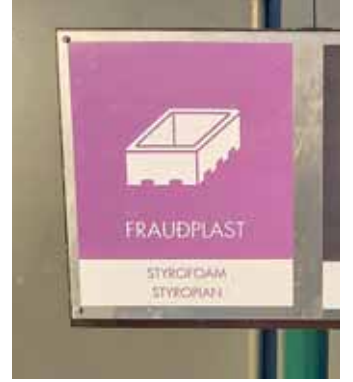
Myndin er lýsandi, litir verða alltaf þeir sömu á öllum flokkunarstöðvum og texti á þremur tungumálum.

Skaftárhreppur setti upp nýjar merkingar á sorpplát á gámasvæðinu í byrjun árs 2021. Þetta eru samræmd merki sem Fenúr hefur hannað og sýna vel, með mynd og á þremur tungumálum, hvað á að fara í hvert sorpplát eða gám. Reykjavík var fyrsta sveitarfélagið til að setja upp merkingarnar í nóvember 2020. Danir hönnuðu merkin í upphafi en síðan hafa hin Norðurlöndin og Eyrstrasaltslöndin sýnt áhuga á að merkja sorpplát á sama hátt.