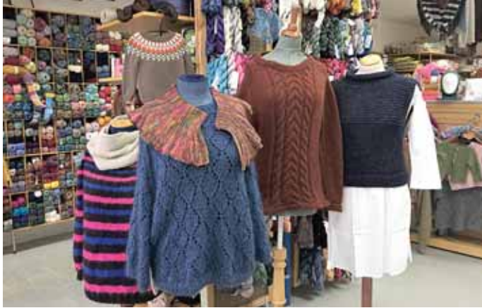
Frumgerðir allra uppskrifta sem Hannyrðabúðin birtir eru til sýnis í versluninni, hér má sjá nokkur sýnishorn.

Gott úrval er í Hannyrðabúðinni og margt sem ekki fæst í öðrum verslunum hér á landi. „Við viljum gjarnan skapa okkur sérstöðu og erum með um 140 mismunandi garntegundir í versluninni, flestar flytjum við sjálfar inn. Okkur finnst skemmtilegt að vinna með fallegt garn og viðskiptavinir okk-