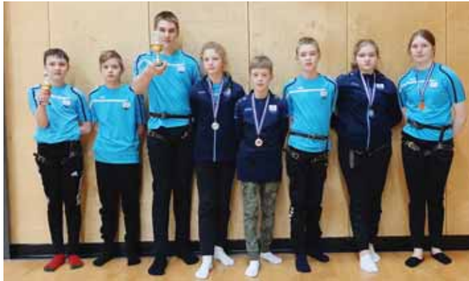
Keppendur Þjótanda, sem voru einu keppendur HSK í barnaflokkum, með verðlaun sín að móti loknu.